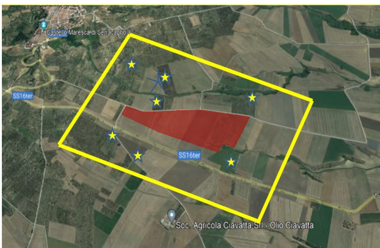
Figura 1 - Serracapriola - buffer 500 mt

Inoltre, pur ricadendo l'area del progetto, all'interno delle zone D.O.P. - D.O.C. e I.G.P. della Provincia di Foggia (in particolare produzioni vinicole e olearie), non sono state rilevate colture arboree e coltivazioni di pregio da segnalare. Come è possibile verificare dalle seguenti ortofoto (fig. 1), nell'intorno dei 500 m è evidenziata la presenza di oliveti e vigneti per uva da vino (stelline gialle) che, da una prima verifica in sito, non risultano essere in possesso di certificazioni di qualità in atto; in tal senso, è prevista una verifica dei fondi in oggetto attraverso la consultazione delle fonti istituzionali.