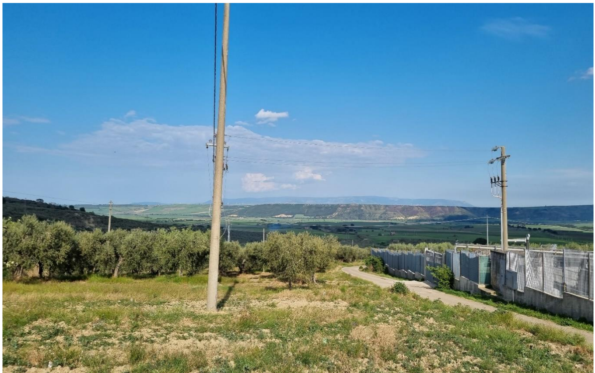
Particolare di coltivazioni arboree adiacenti al sito di realizzo