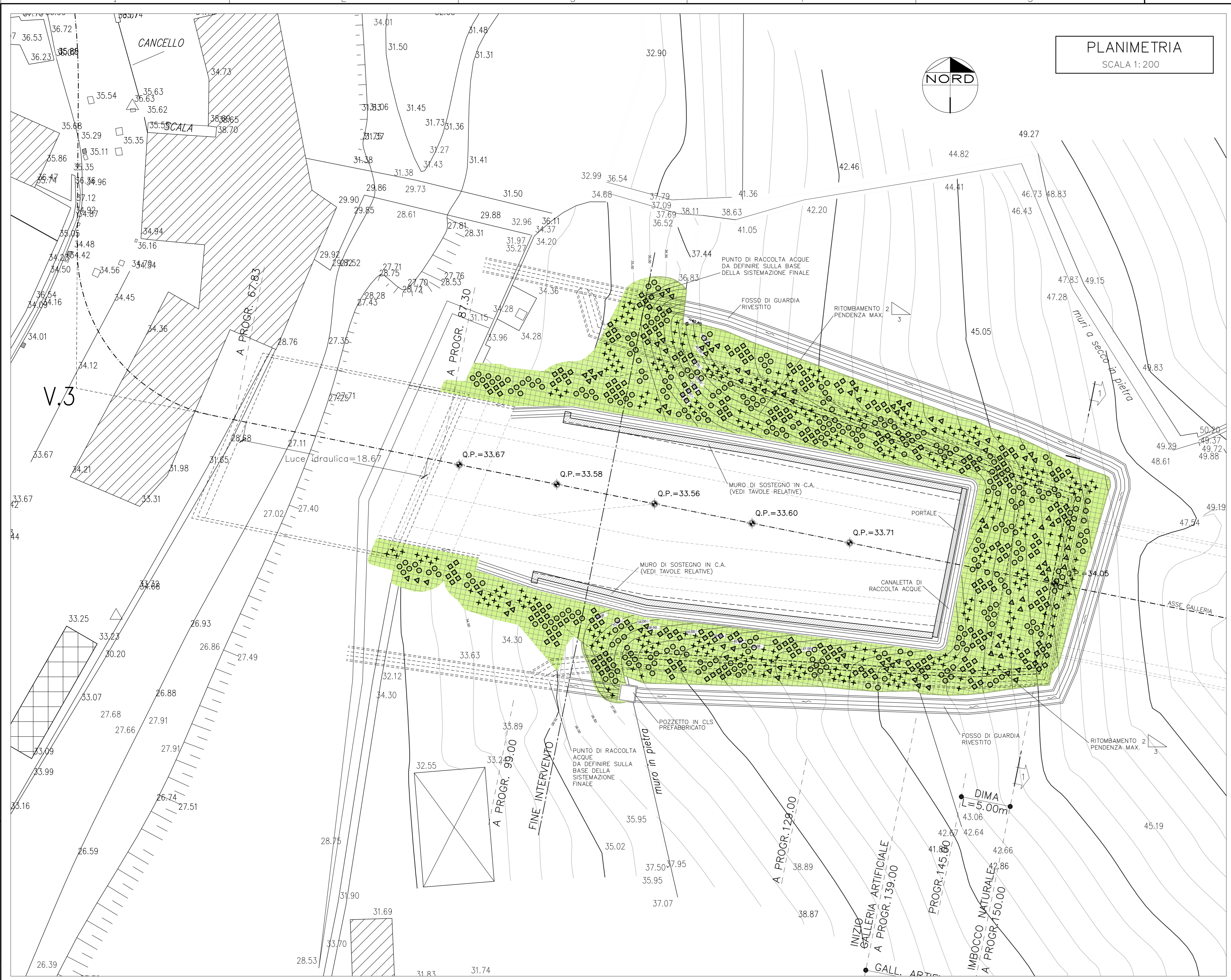
PLANIMETRIA SCALA 1:200