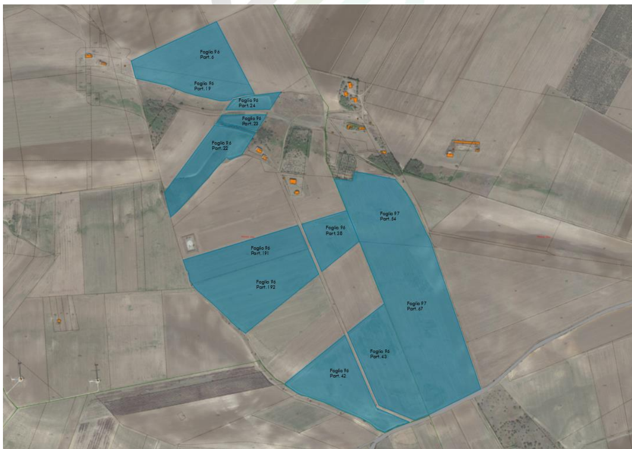
Fig. 1-2: Localizzazione area di intervento su ortofoto catastale, in blu la perimetrazione del sito