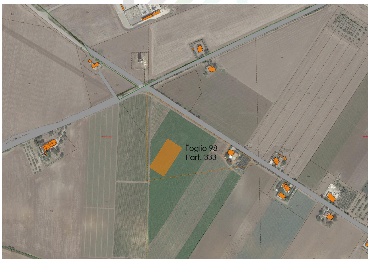
Fig. 1-3: Localizzazione area SSEU su ortofoto catastale, in arancio la perimetrazione dell'Area