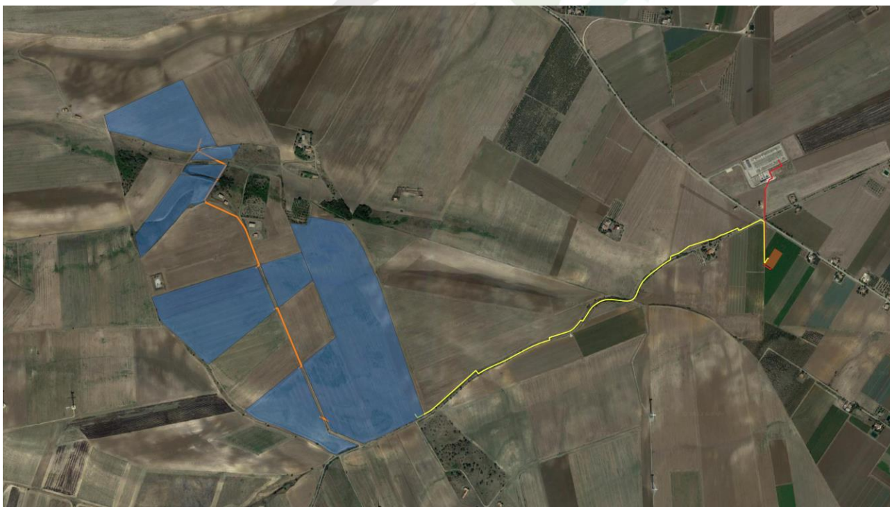
Fig. 1-1: Localizzazione area di intervento, in blu la perimetrazione del sito, in giallo il tracciato della connessione, in arancio l'area della SSEU

Le opere di rete interesseranno l'agro dello stesso comune in ragione della posizione della Stazione Elettrica di Smistamento a 150 kV della RTN denominata "Valle" , di cui uno stallo del futuro ampliamento è stato indicato dal gestore come punto di connessione dell'impianto.