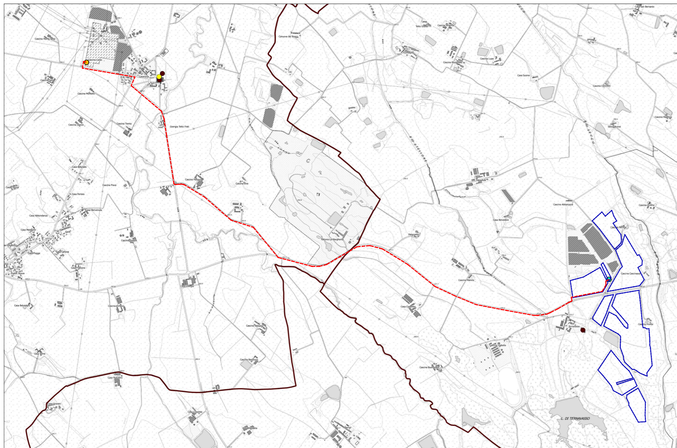
PTC: Sistema dei beni culturali, centri storici, aree storico-culturali e localizzazione dei principali beni - inquadramento delle aree di impianto e delle opere di connessione

..... Limite dell'area periurbana torinese (Art. 34 Nda)