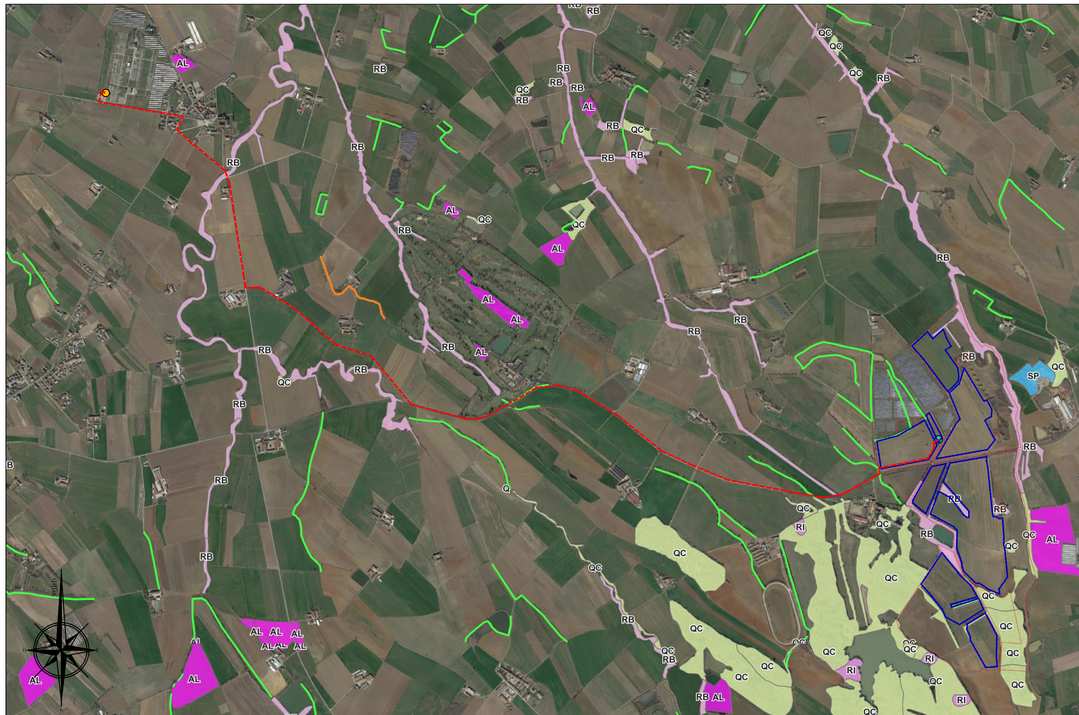
Carta Forestale - inquadramento delle aree di impianto e delle opere di connessione