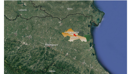
INQUADRAMENTO TERRITORIALE 0 25 50 km