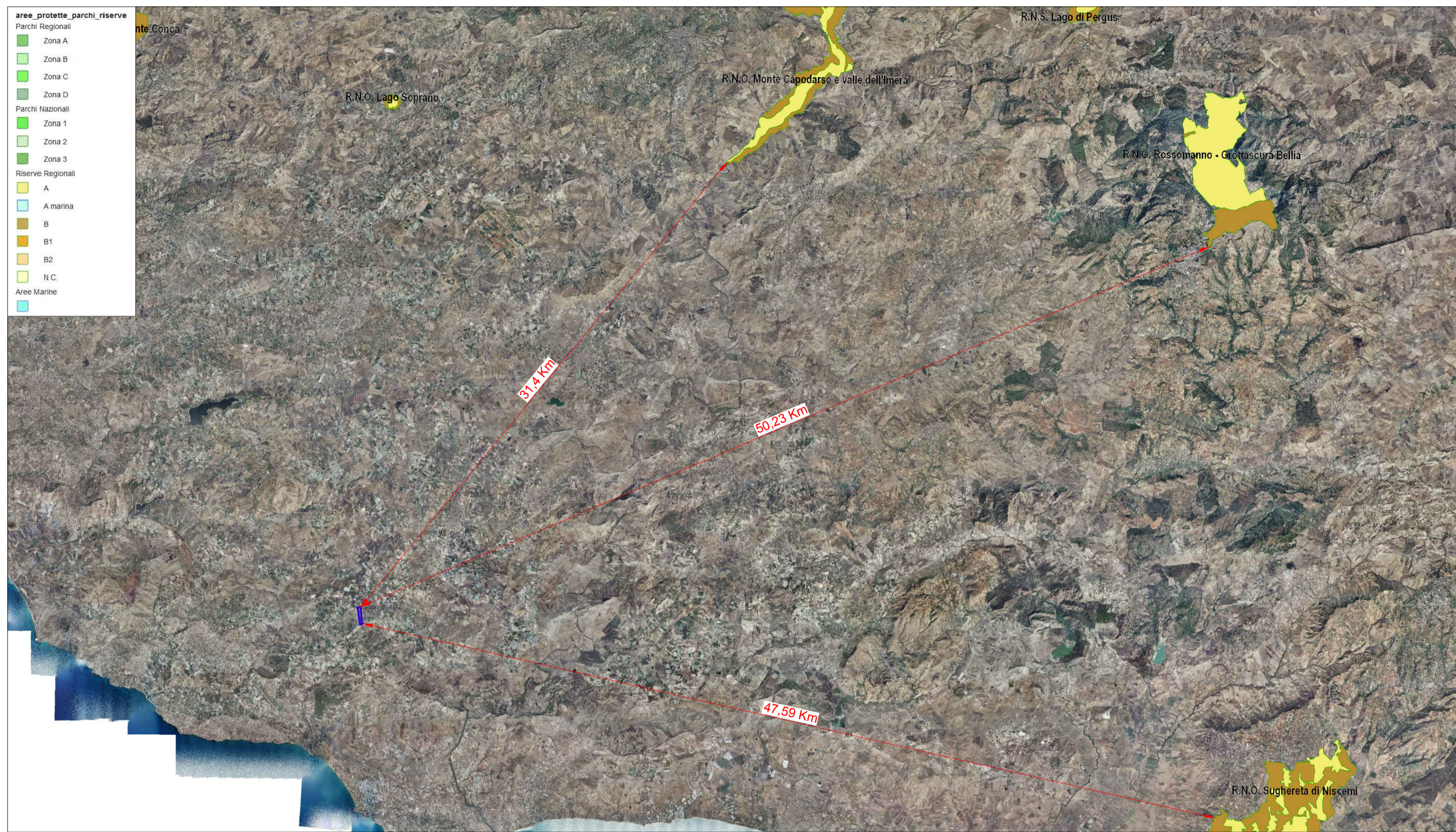
PARCHI E RISERVE SCALA 1:200.000