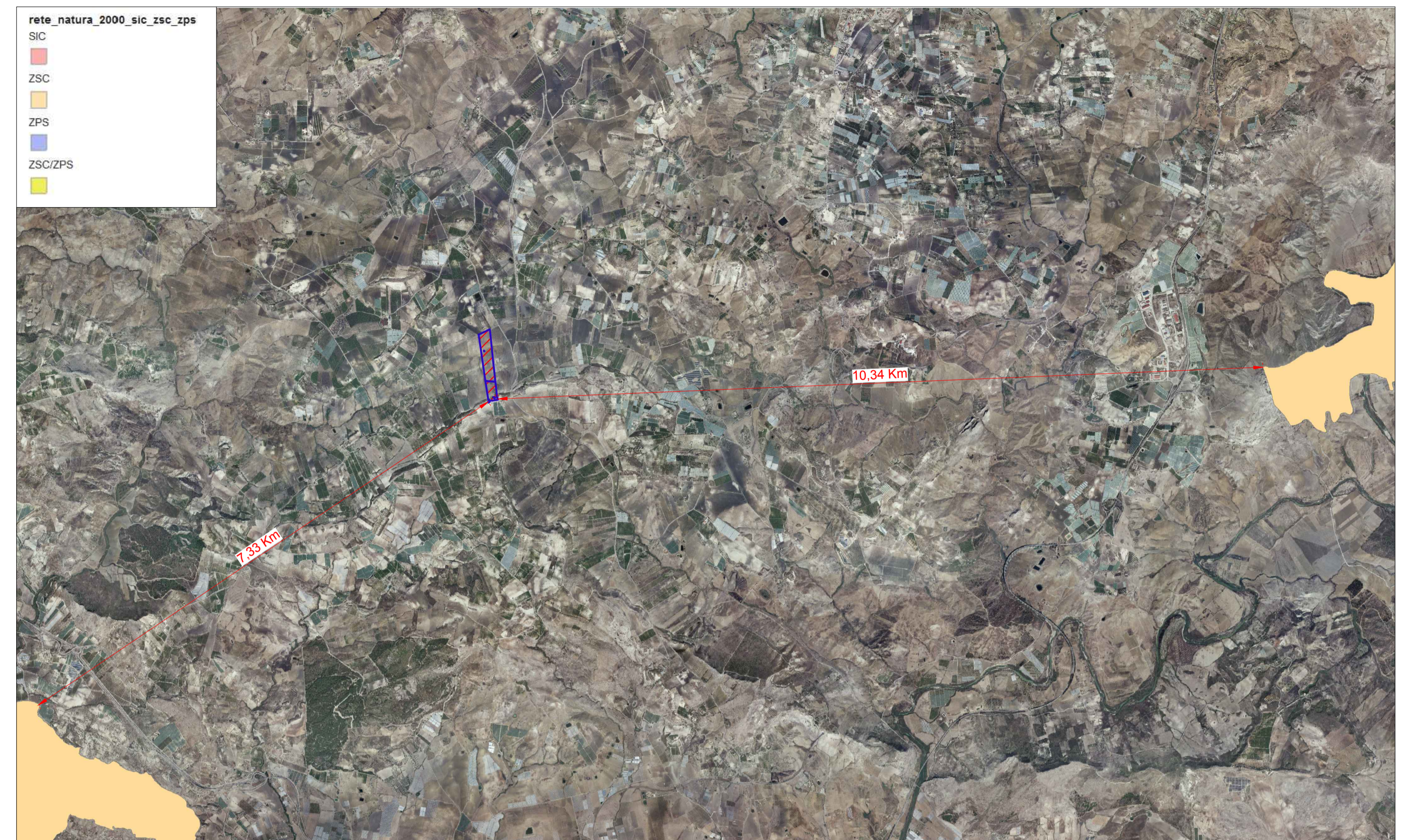
AREE SIC E ZPS SCALA 1:50.000