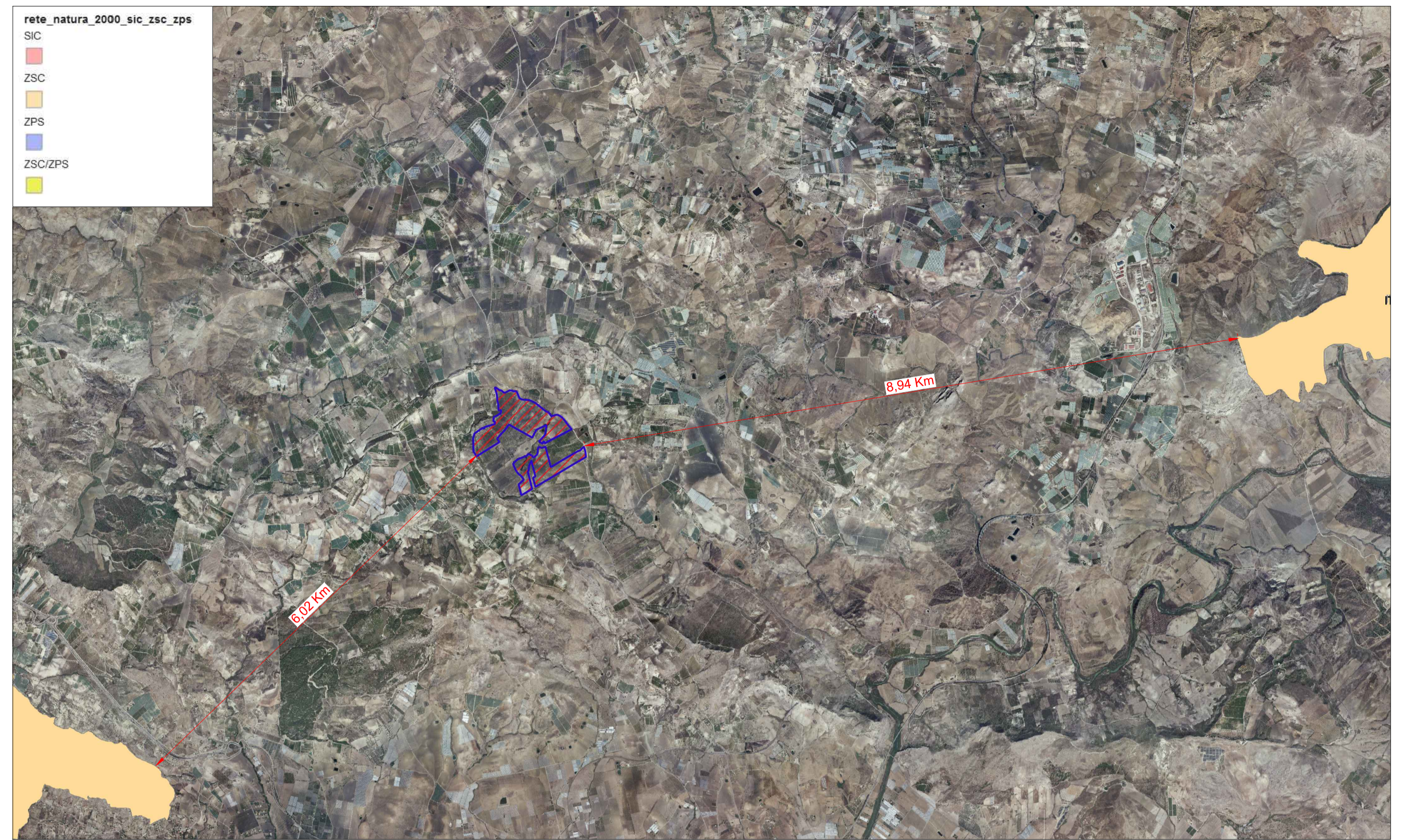
AREE SIC E ZPS SCALA 1:50.000