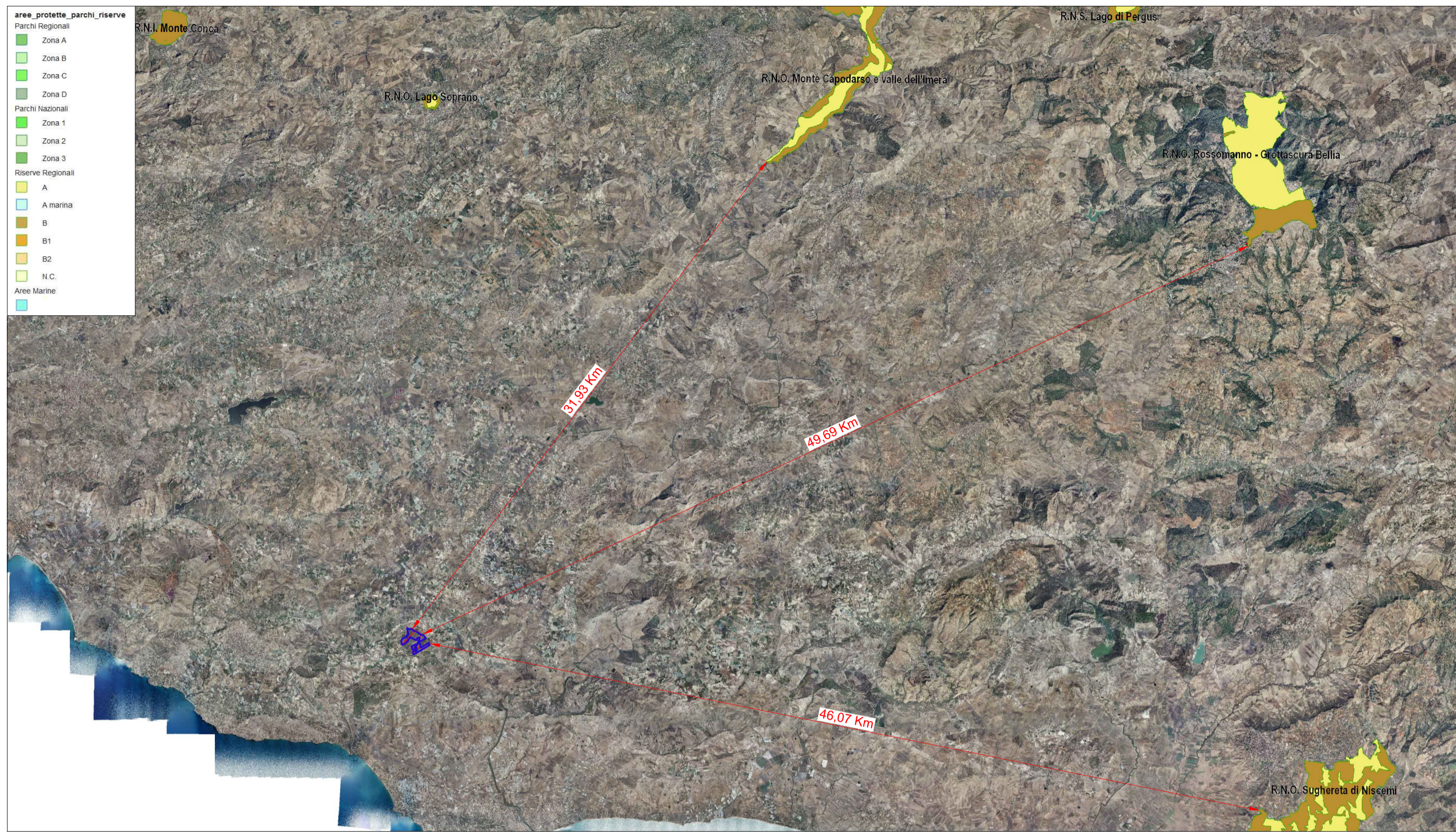
PARCHI E RISERVE SCALA 1:200.000