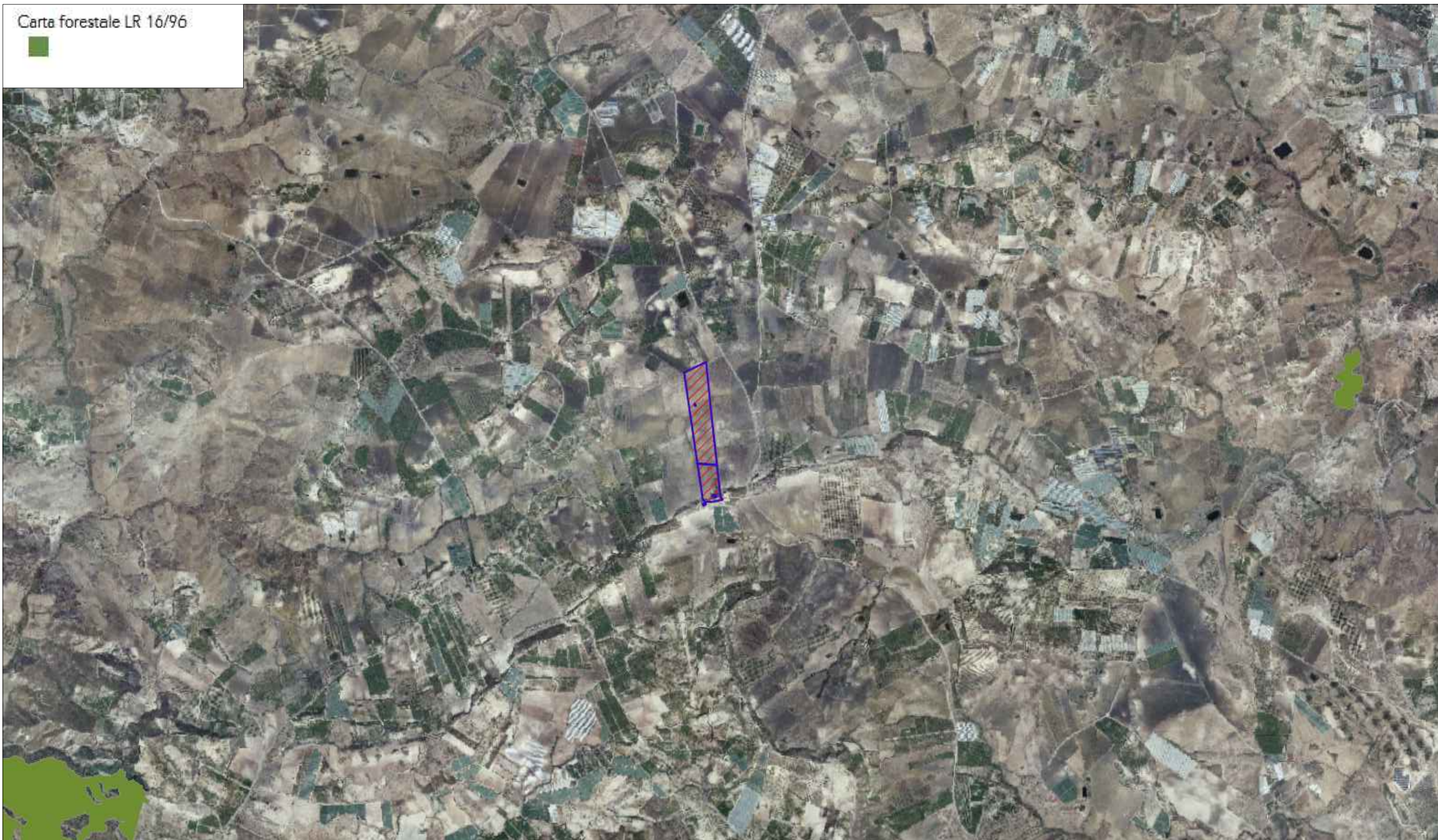
STRALCIO CARTA FORESTALE L.R. 16/96 SCALA 1:25.000