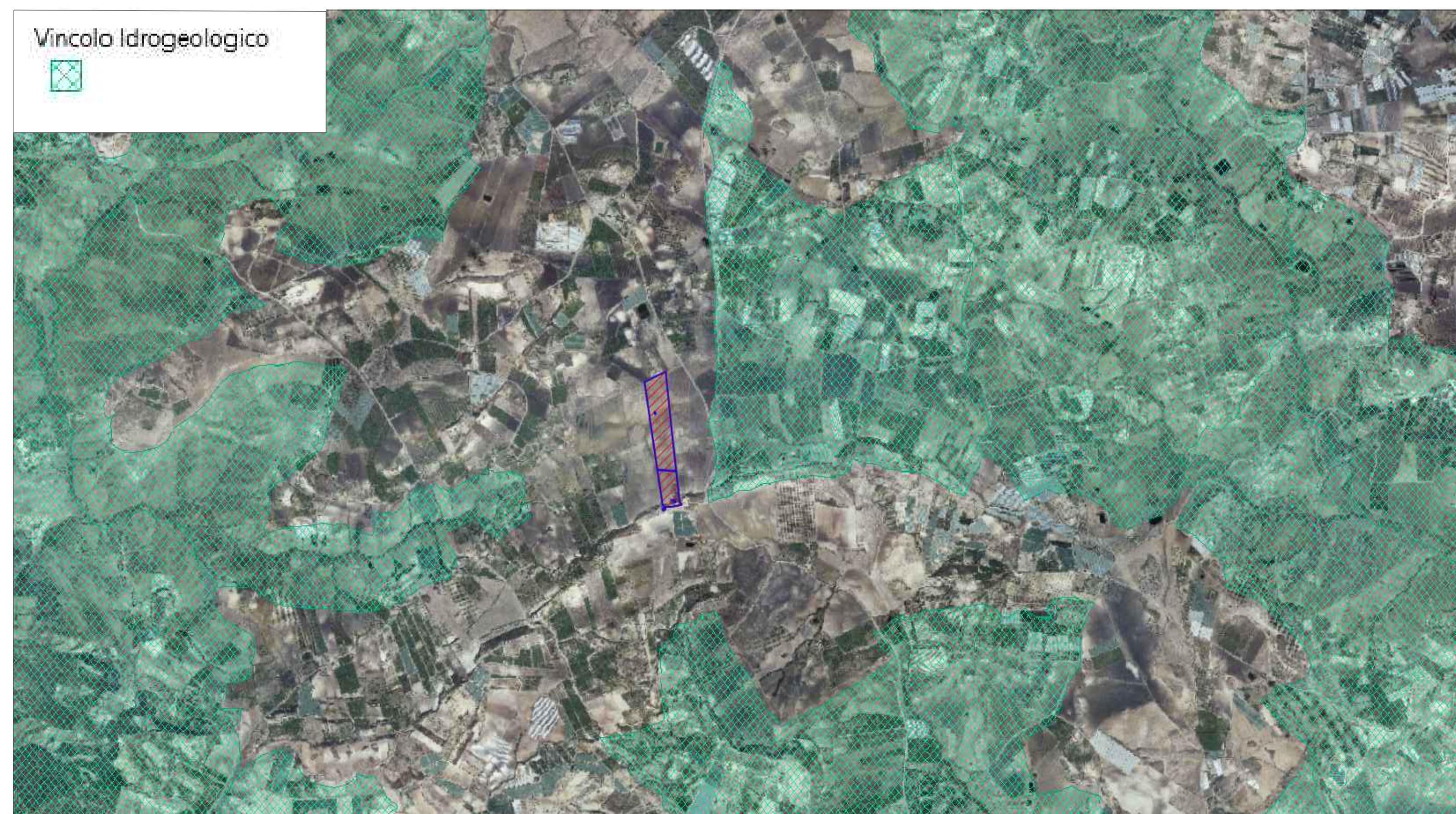
STRALCIO MAPPA VINCOLO IDROGEOLOGICO SCALA 1:25.000