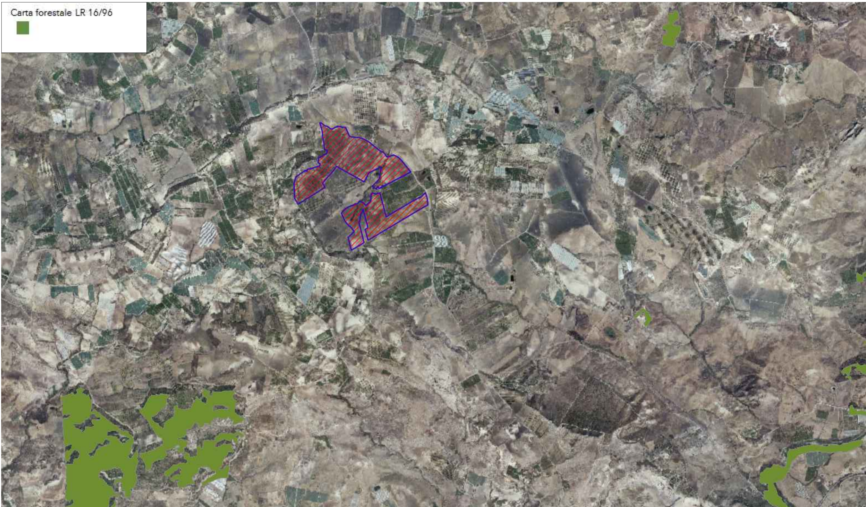
STRALCIO CARTA FORESTALE L.R. 16/96 SCALA 1:25.000