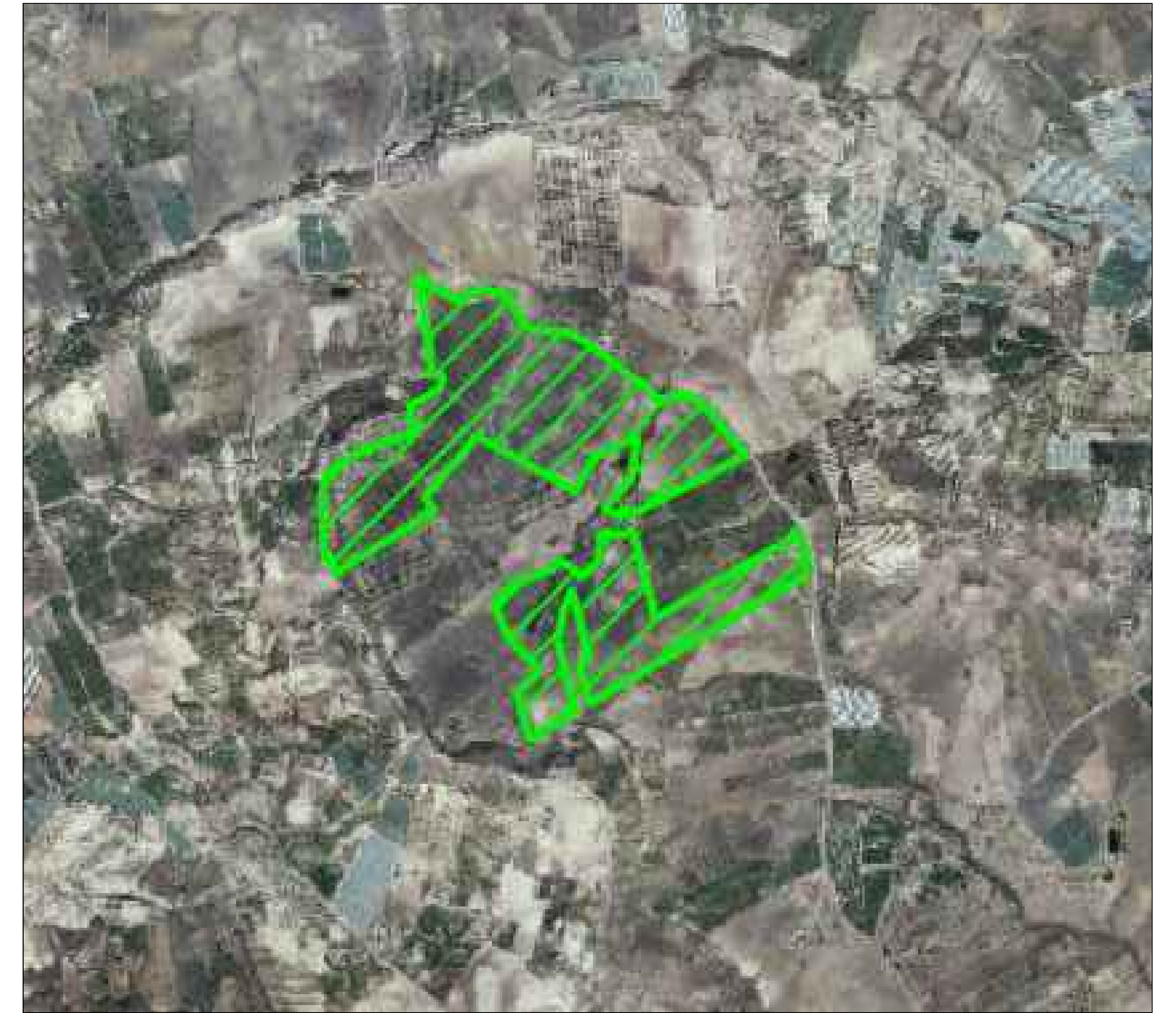
Area Impianto FV in progetto