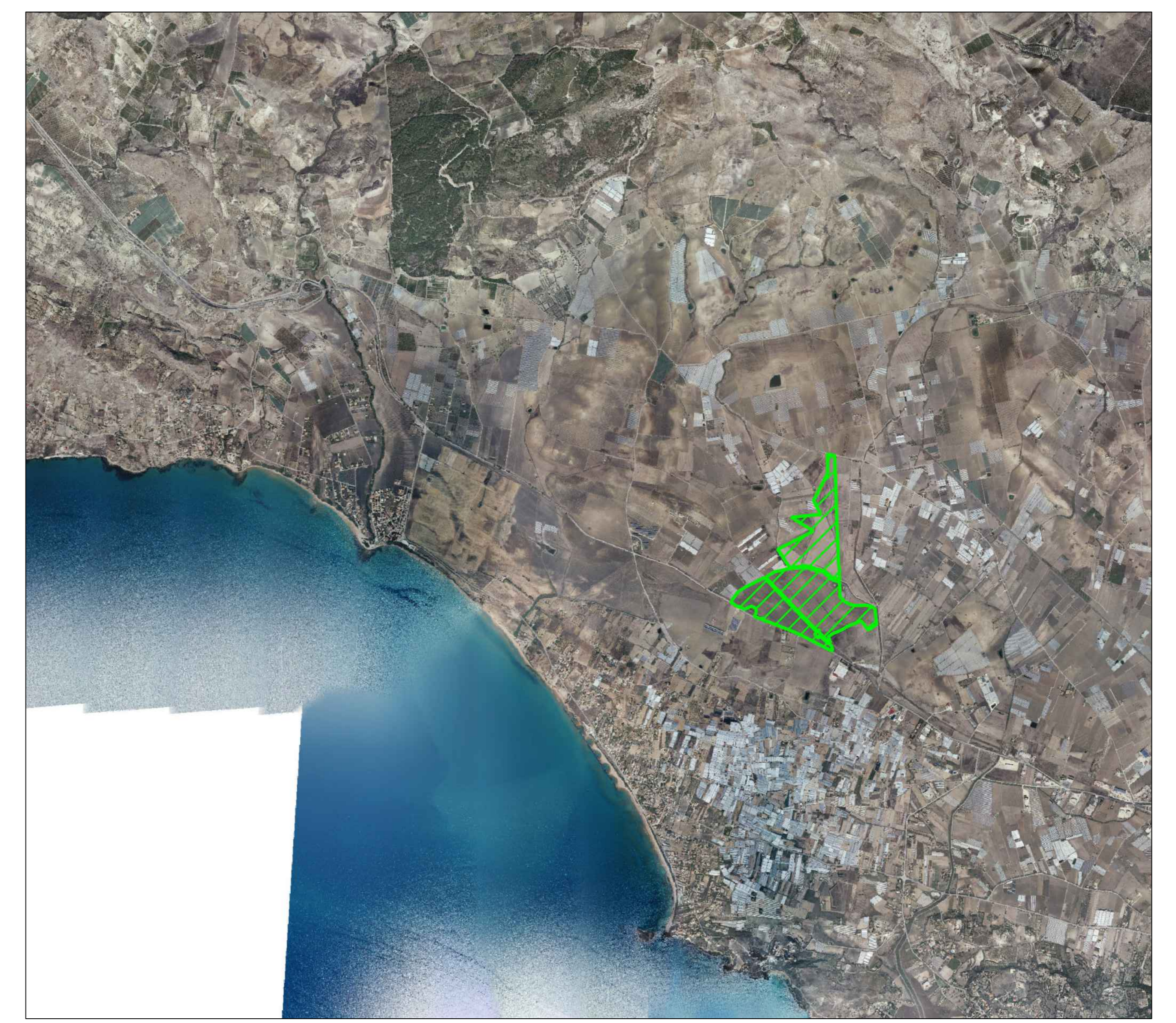
Area Impianto FV in progetto