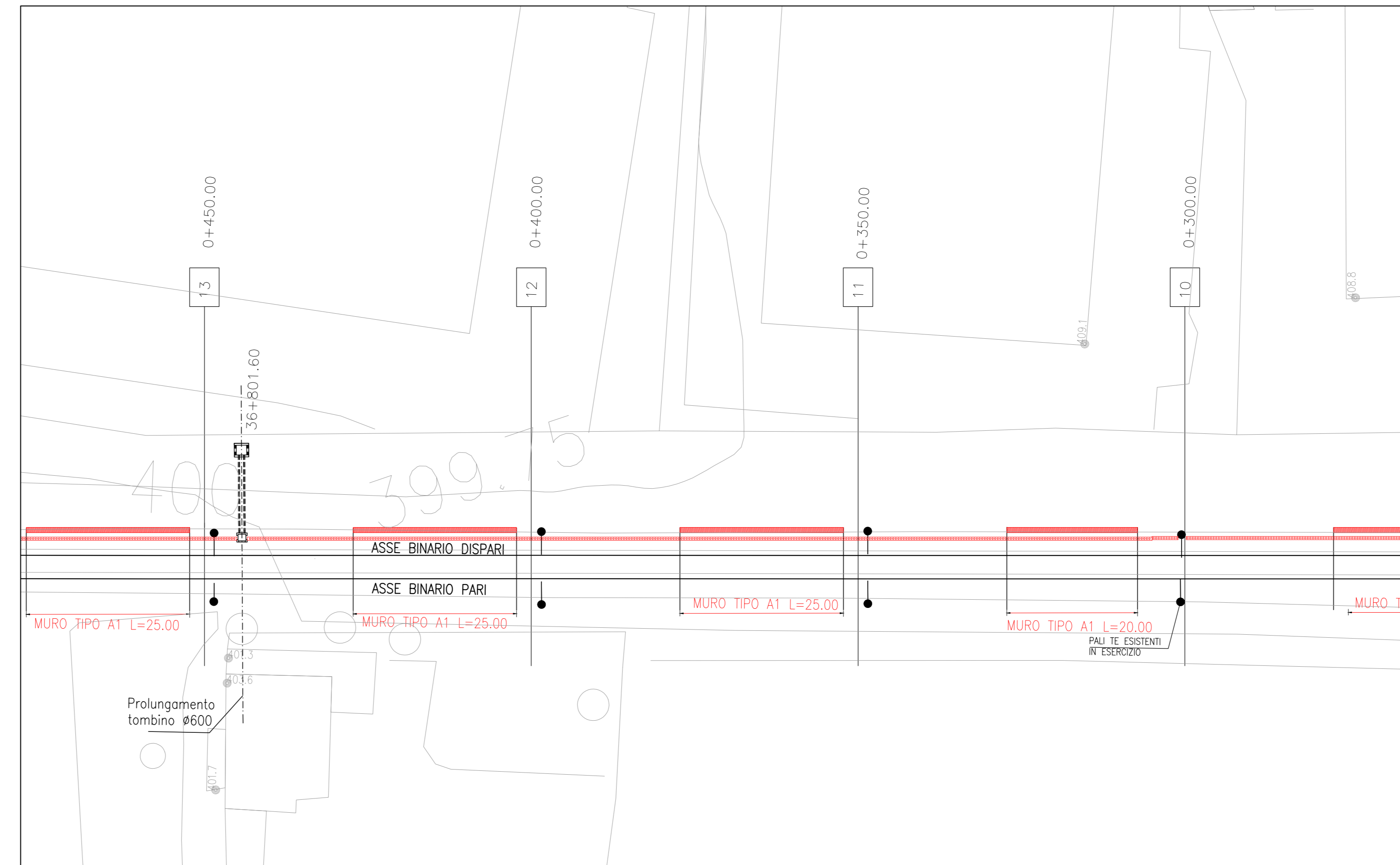
FASE 2 1:500