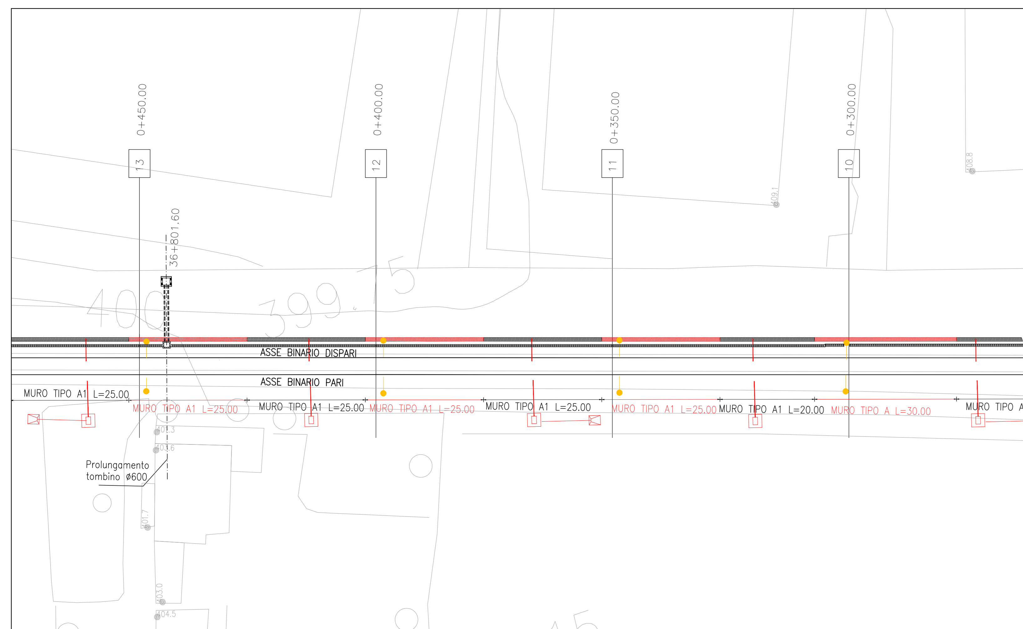
FASE 3 1:500