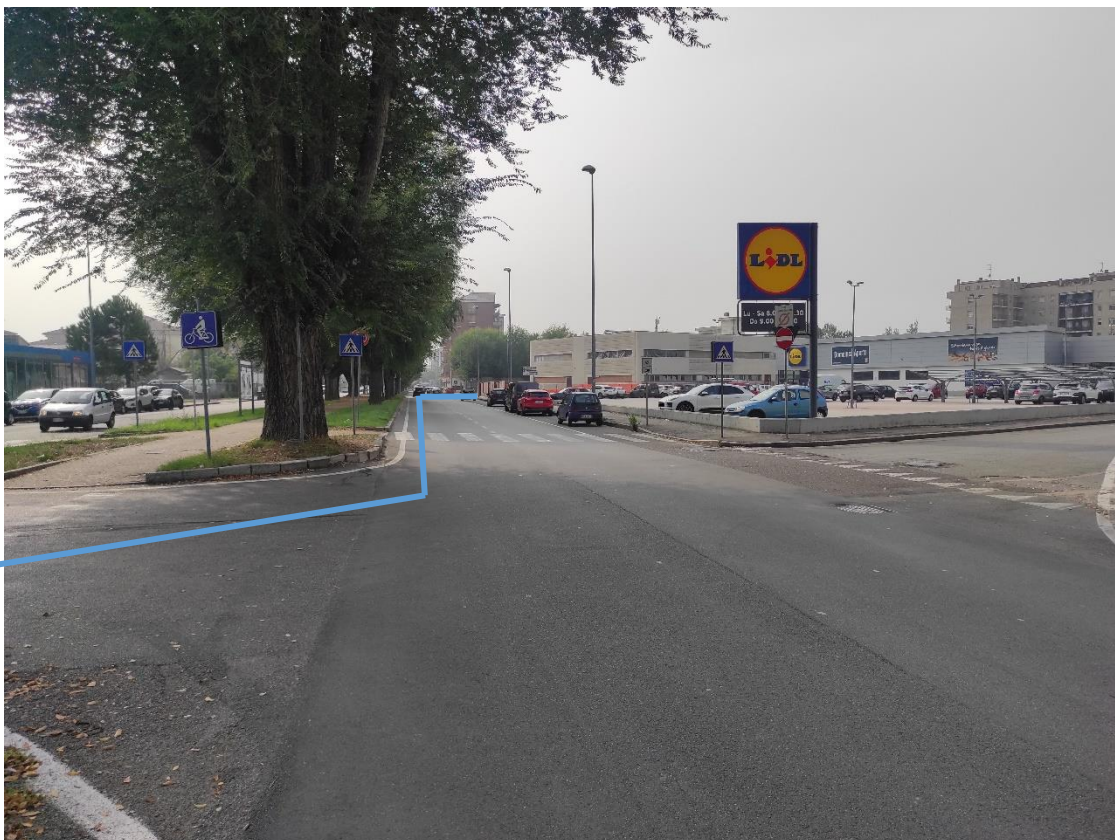
Figura 47. Strada Comunale Via San Giovanni Bosco - Posa linea elettrica su strada asfaltata