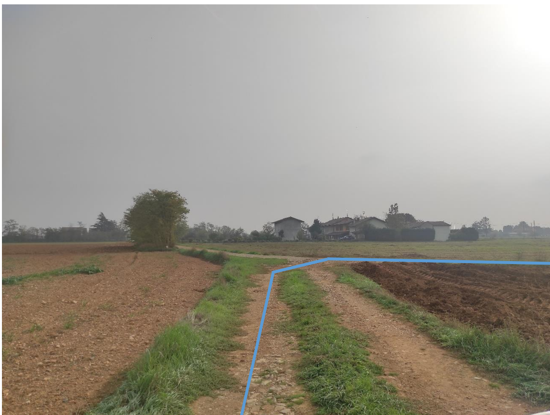
Figura 2. Strada vicinale - Posa linea elettrica su strada sterrata