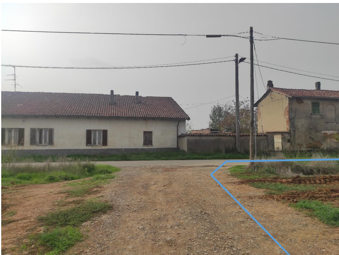
Figura 4. Incrocio Strada vicinale-Strada Comunale Via Duomo - Posa linea elettrica su strada sterrata