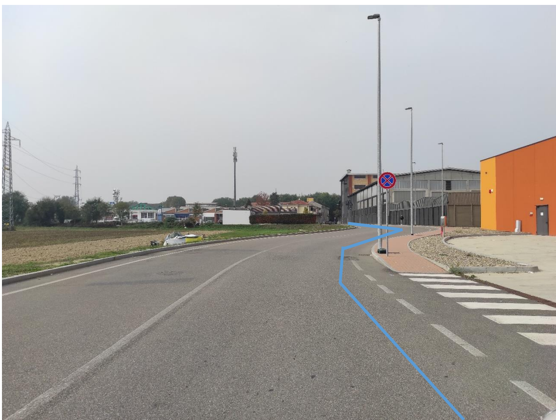
Figura 40. Strada Comunale Via Piave - Posa linea elettrica su strada asfaltata