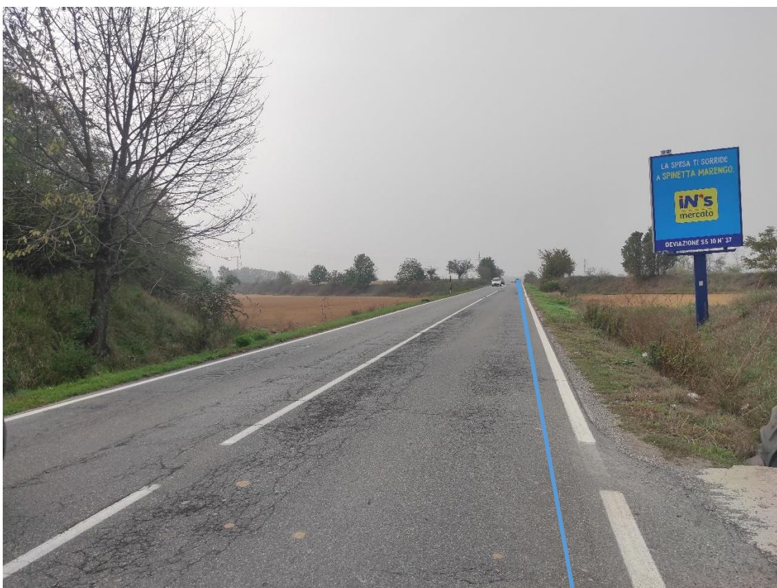
Figura 16. Strada Comunale Castelceriolo - Posa linea elettrica su strada asfaltata