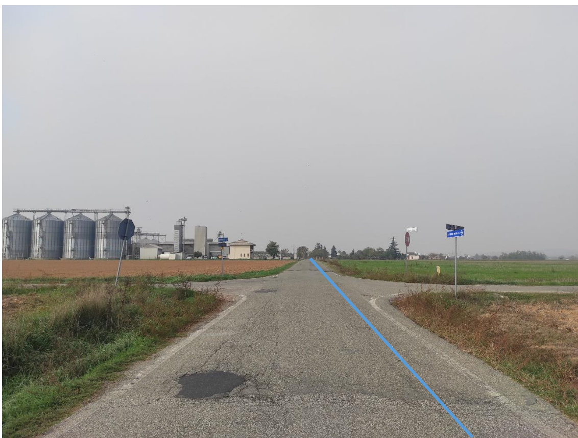
Figura 8. Strada Comunale Via Duomo - Posa linea elettrica su strada asfaltata