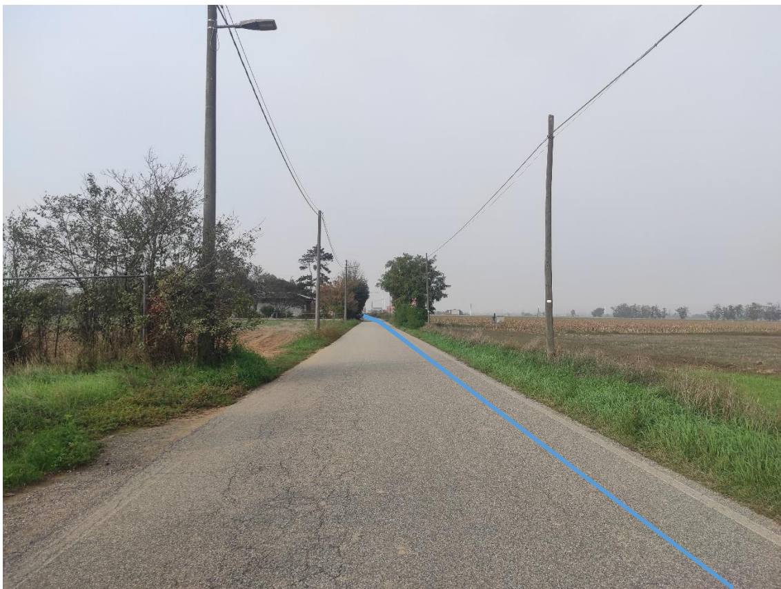
Figura 5. Strada Comunale Via Duomo - Posa linea elettrica su strada asfaltata