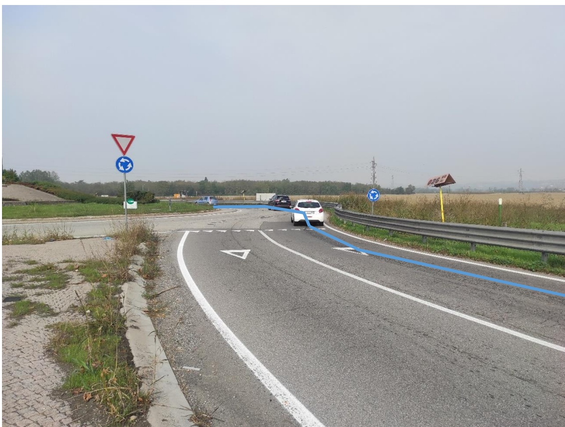
Figura 26. Strada Regionale 10 - Posa linea elettrica su strada asfaltata