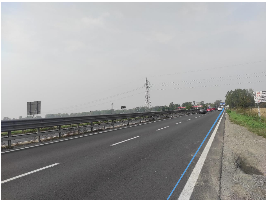
Figura 27. Strada Regionale 10 - Posa linea elettrica su strada asfaltata