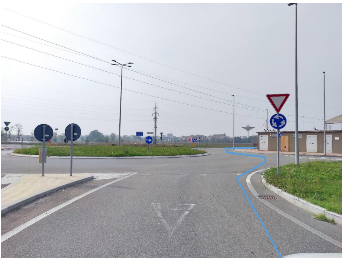
Figura 36. Strada Comunale - Posa linea elettrica su strada asfaltata