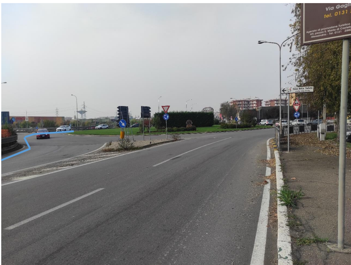
Figura 34. Strada Regionale 10 - Posa linea elettrica su strada asfaltata