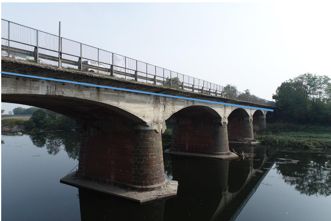
Figura 30. Strada Regionale 10-Attraversamento fiume - Posa linea elettrica su ponte