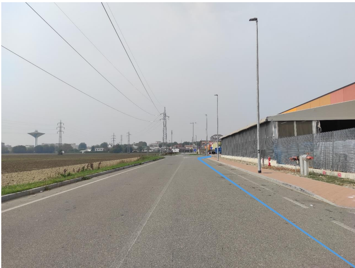
Figura 37. Strada Comunale - Posa linea elettrica su strada asfaltata