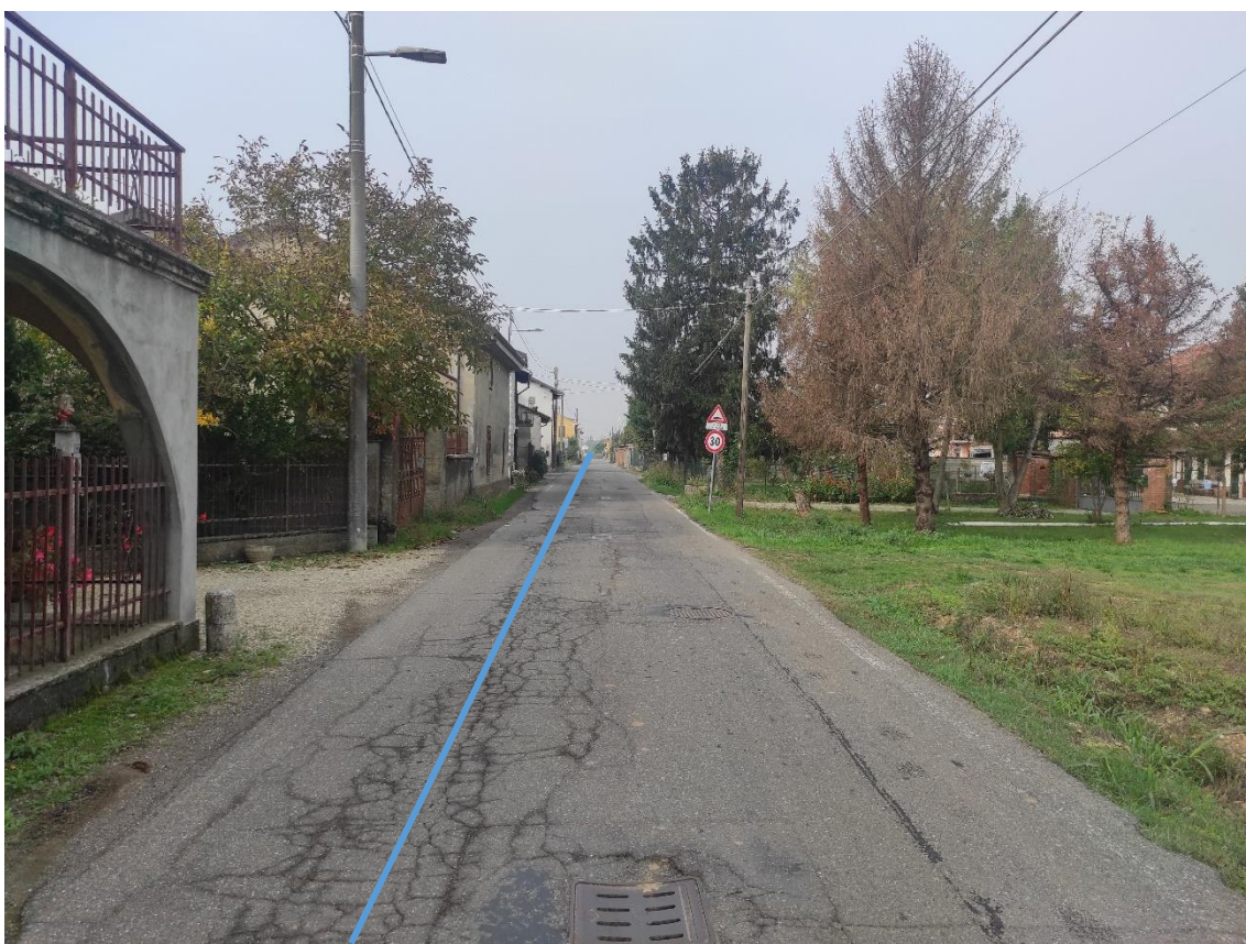
Figura 10. Strada Comunale Via San Giuliano Nuova - Posa linea elettrica su strada asfaltata