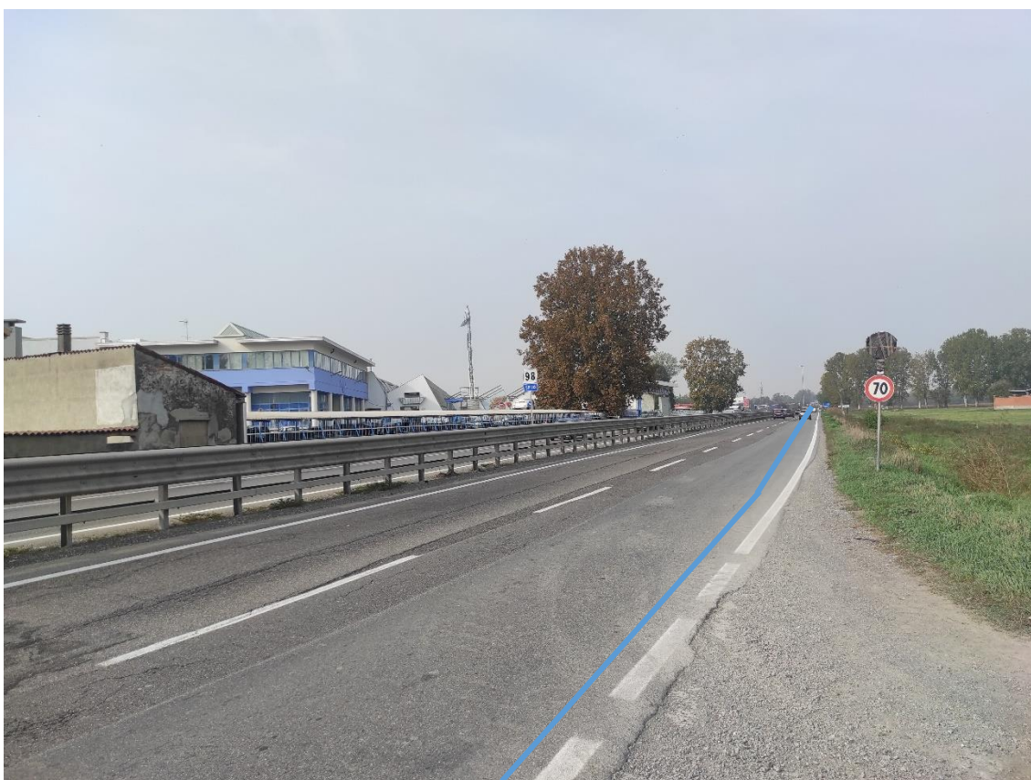
Figura 24. Strada Regionale 10 - Posa linea elettrica su strada asfaltata