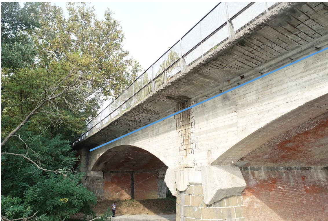
Figura 31. Strada Regionale 10-Attraversamento fiume - Posa linea elettrica su ponte