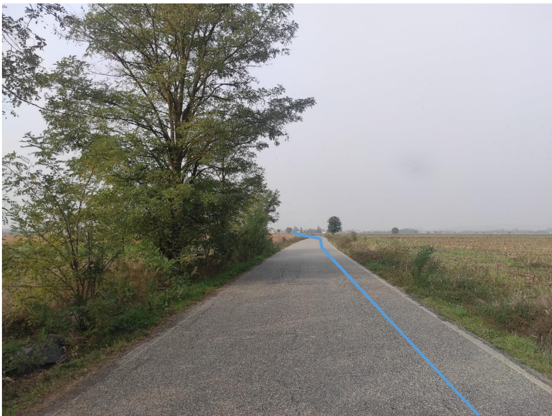
Figura 7. Strada Comunale Via Duomo - Posa linea elettrica su strada asfaltata