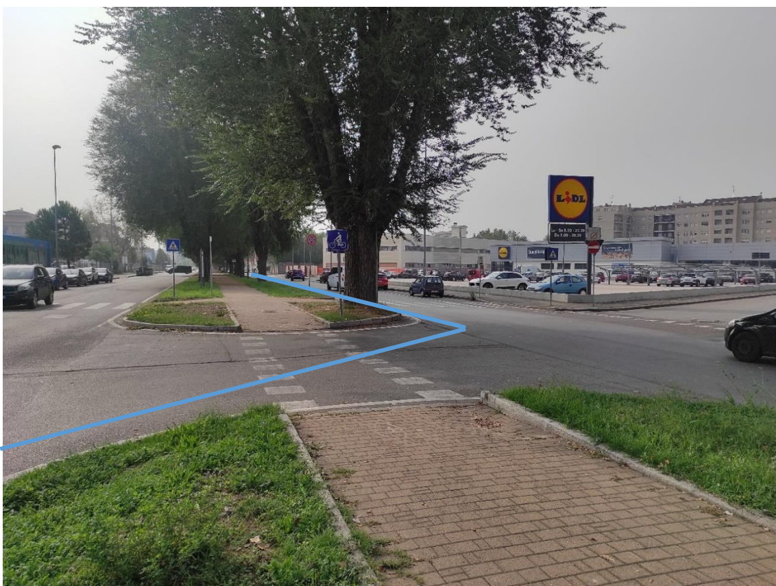
Figura 46. Strada Comunale Via San Giovanni Bosco - Posa linea elettrica su strada asfaltata