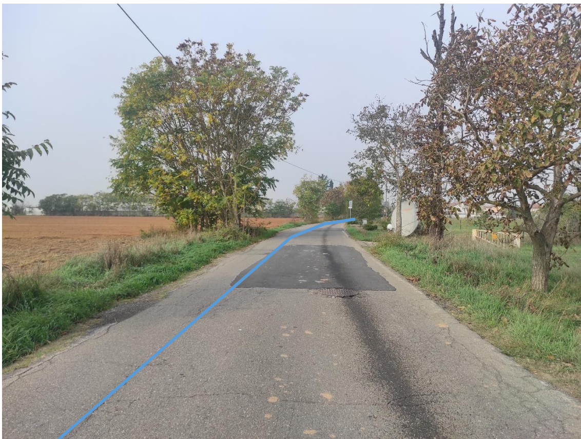
Figura 9. Strada Comunale Via San Giuliano Nuova - Posa linea elettrica su strada asfaltata