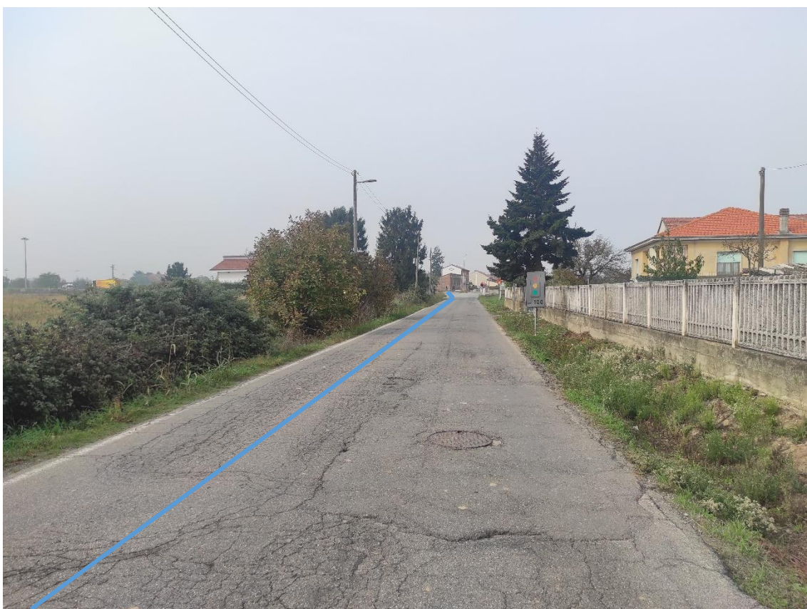
Figura 12. Strada Comunale Via San Giuliano Nuova - Posa linea elettrica su strada asfaltata