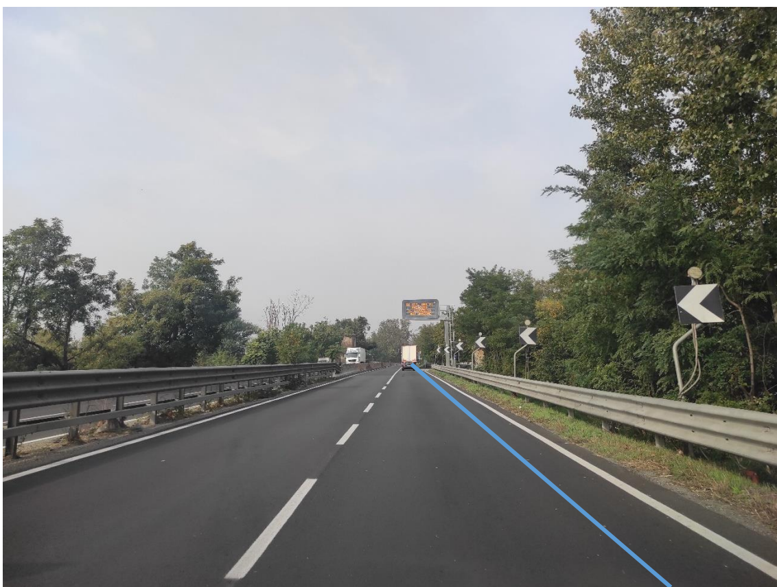
Figura 28. Strada Regionale 10 - Posa linea elettrica su strada asfaltata