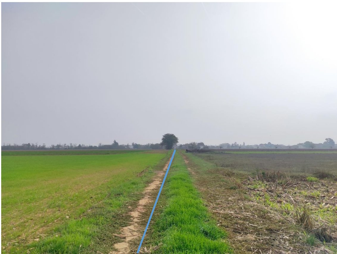
Figura 1. Strada vicinale - Posa linea elettrica su strada sterrata