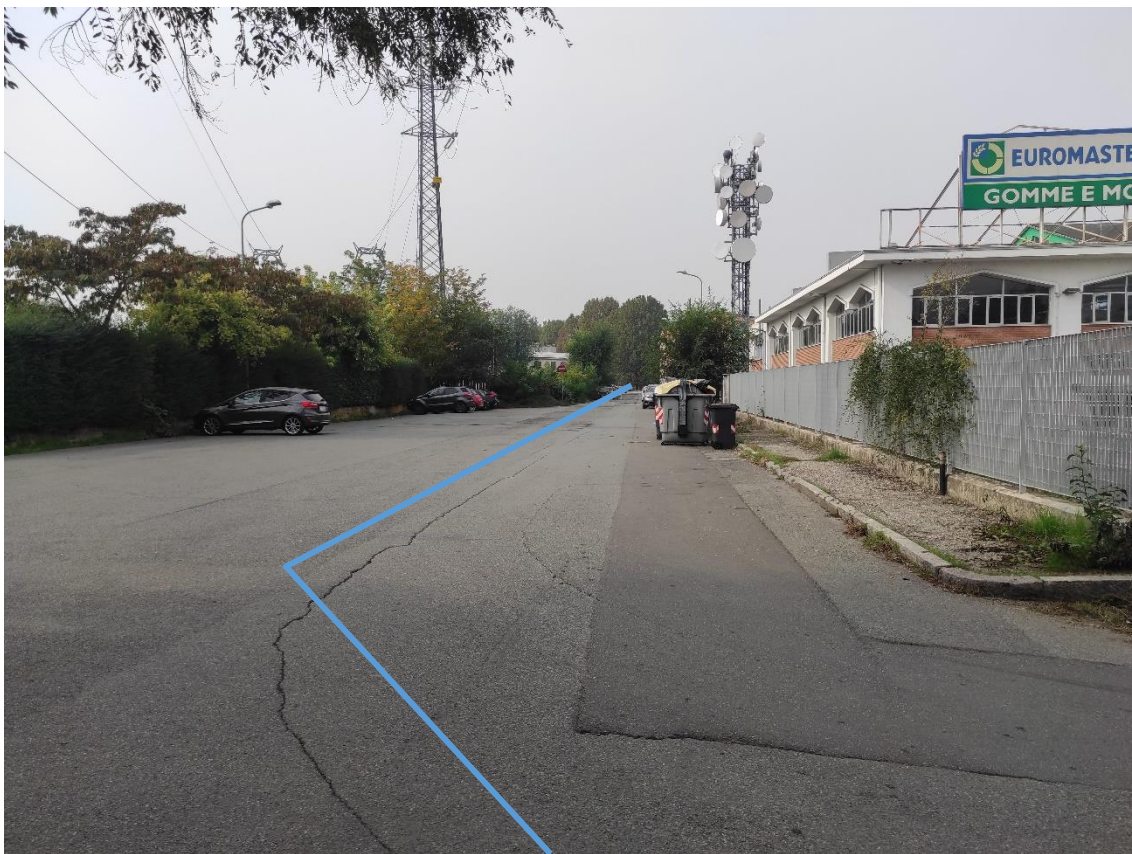
Figura 43. Strada Comunale Via Sardegna - Posa linea elettrica su strada asfaltata