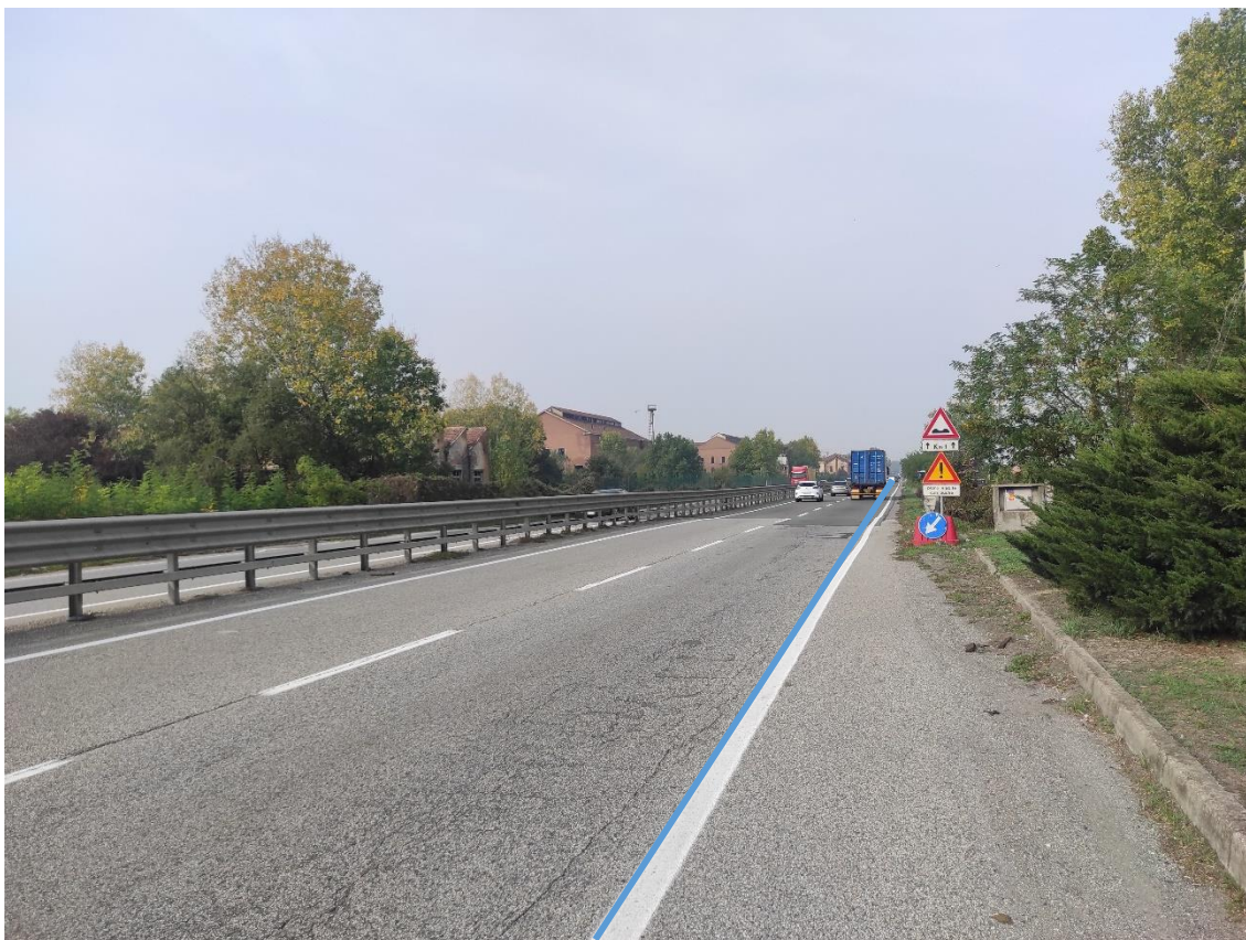
Figura 23. Strada Regionale 10 - Posa linea elettrica su strada asfaltata