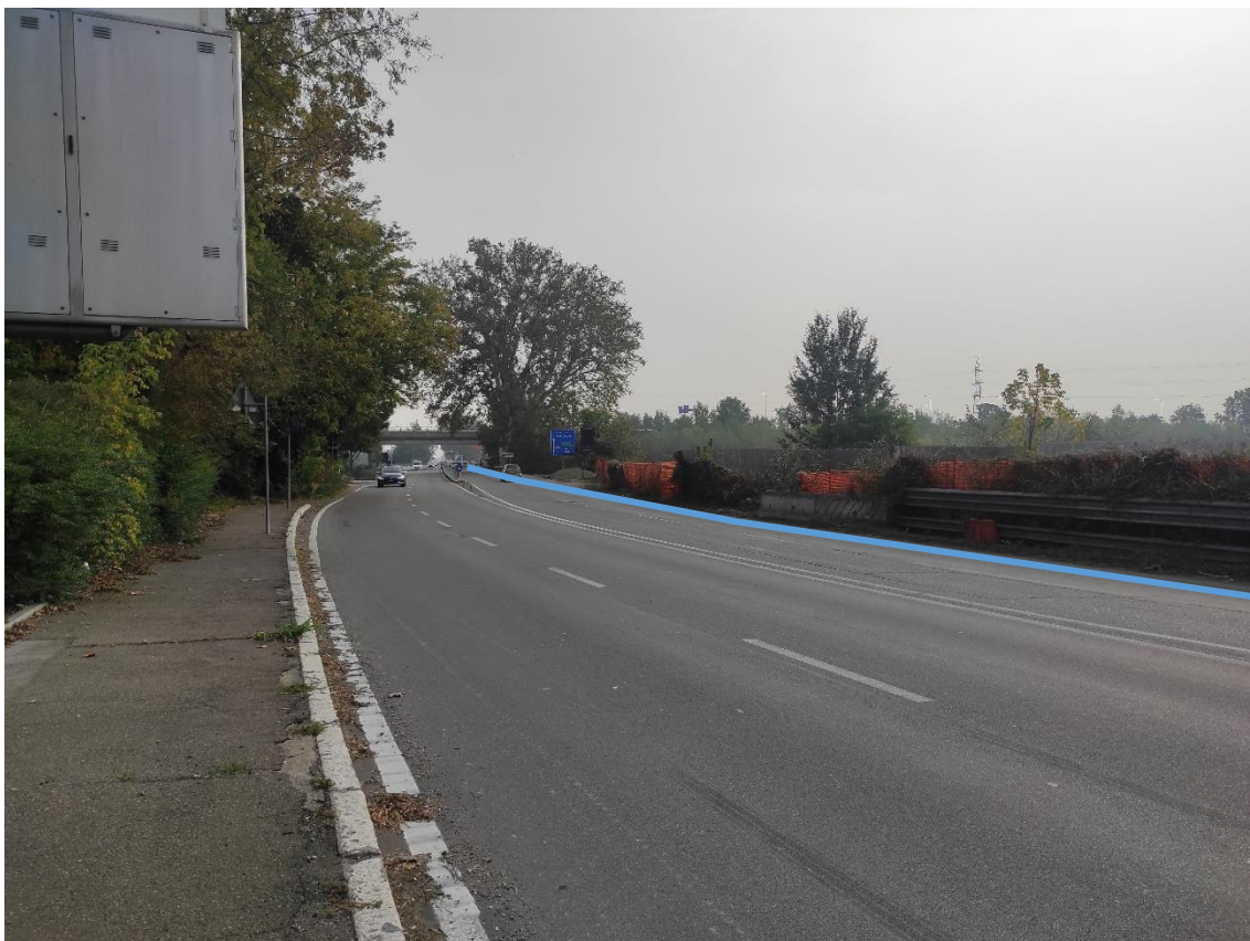
Figura 33. Strada Regionale 10 - Posa linea elettrica su strada asfaltata