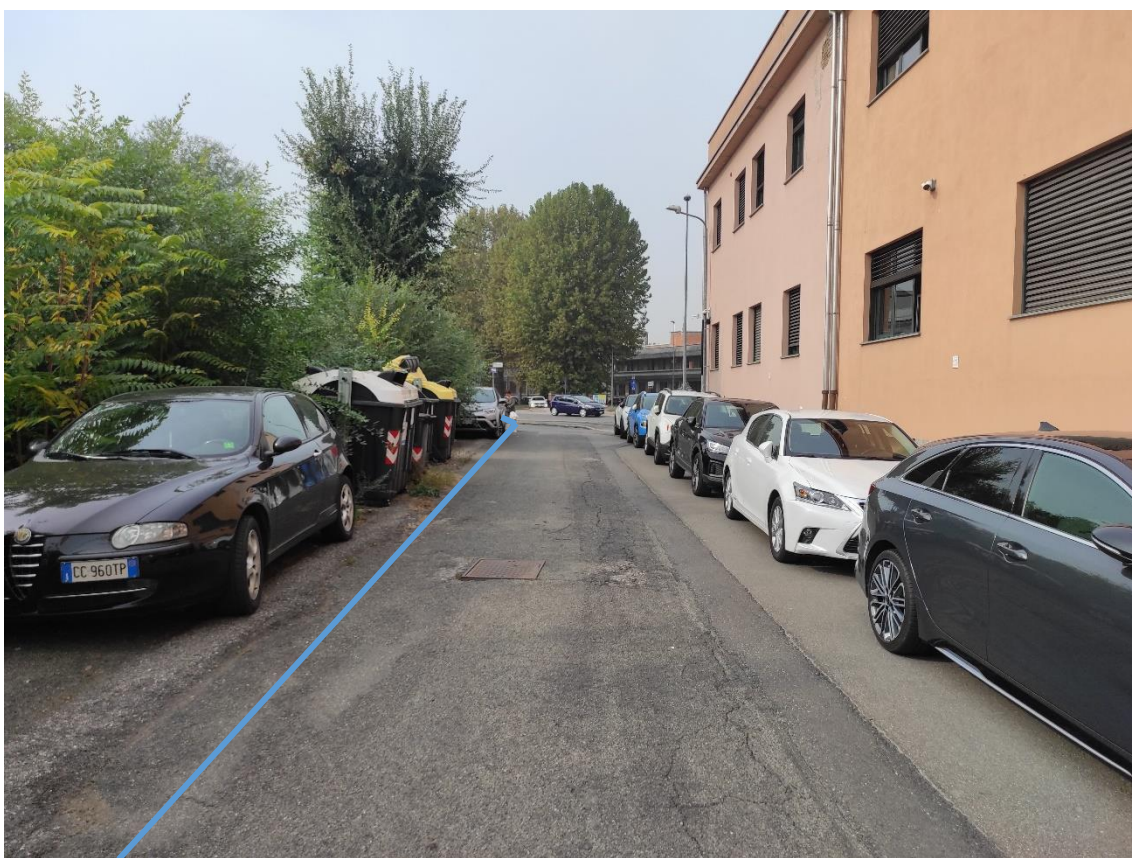
Figura 44. Strada Comunale Via Sardegna - Posa linea elettrica su strada asfaltata