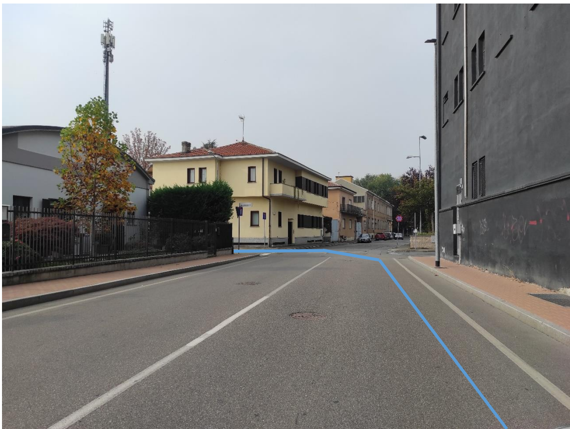
Figura 41. Incrocio Strada Comunale Via Piave-Via Sardegna - Posa linea elettrica su strada asfaltata