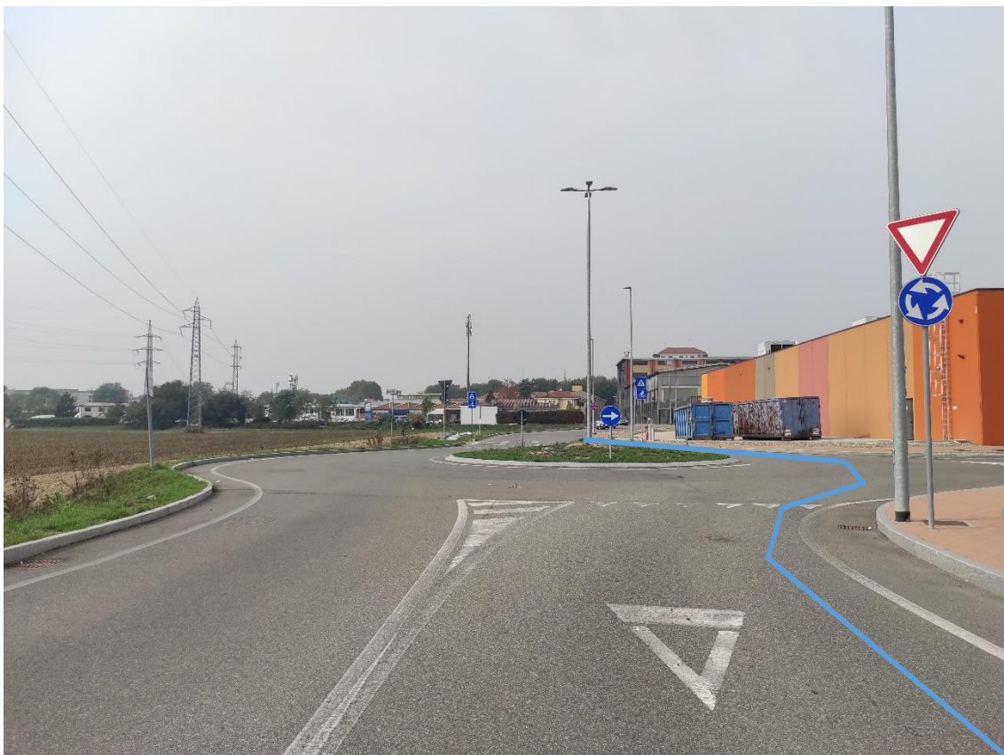
Figura 39. Strada Comunale - Posa linea elettrica su strada asfaltata