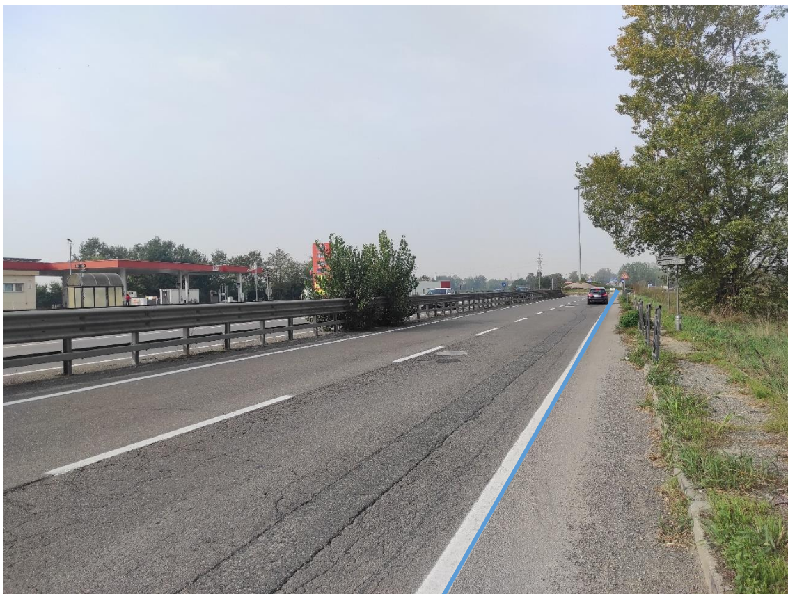
Figura 25. Strada Regionale 10 - Posa linea elettrica su strada asfaltata