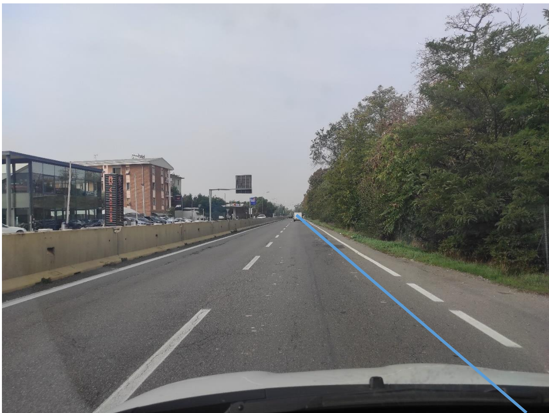
Figura 21. Strada Regionale 10 - Posa linea elettrica su strada asfaltata