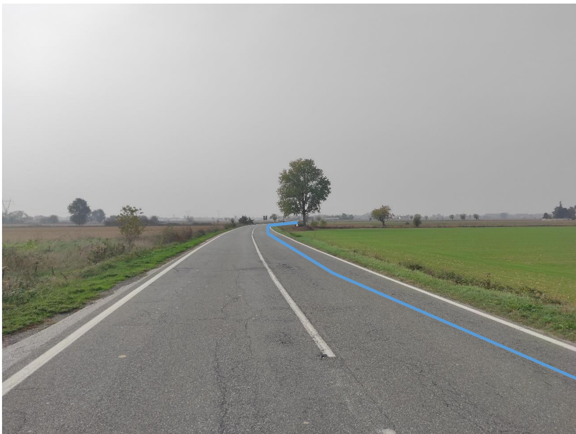
Figura 17. Strada Comunale Castelceriolo - Posa linea elettrica su strada asfaltata