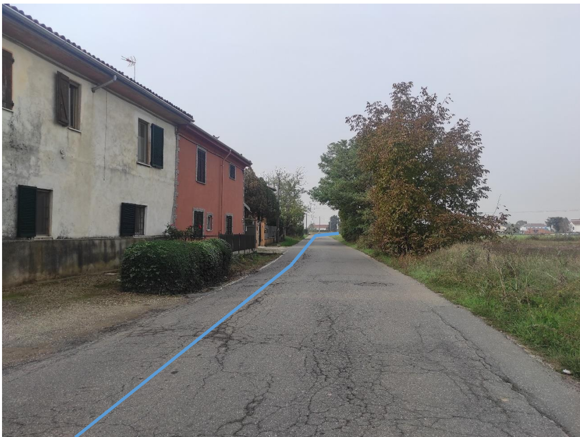
Figura 11. Strada Comunale Via San Giuliano Nuova - Posa linea elettrica su strada asfaltata