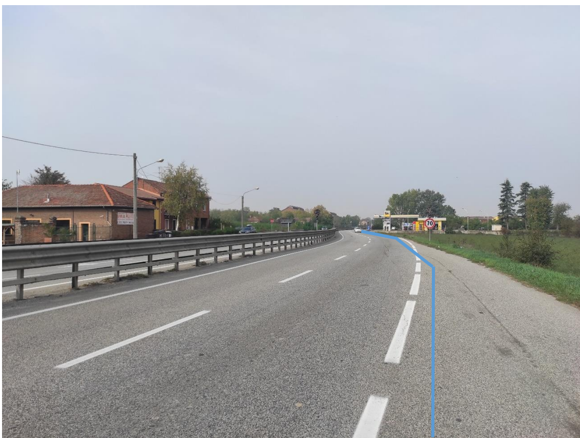
Figura 22. Strada Regionale 10 - Posa linea elettrica su strada asfaltata