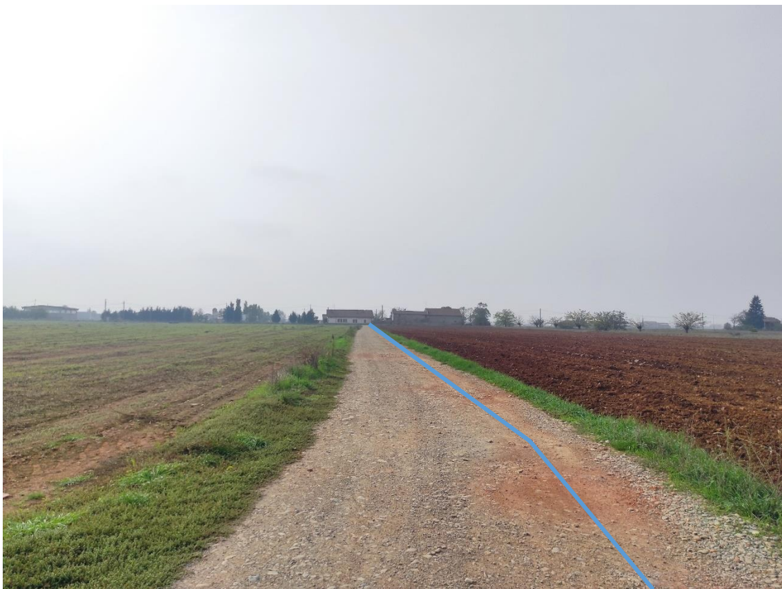
Figura 3. Strada vicinale - Posa linea elettrica su strada sterrata