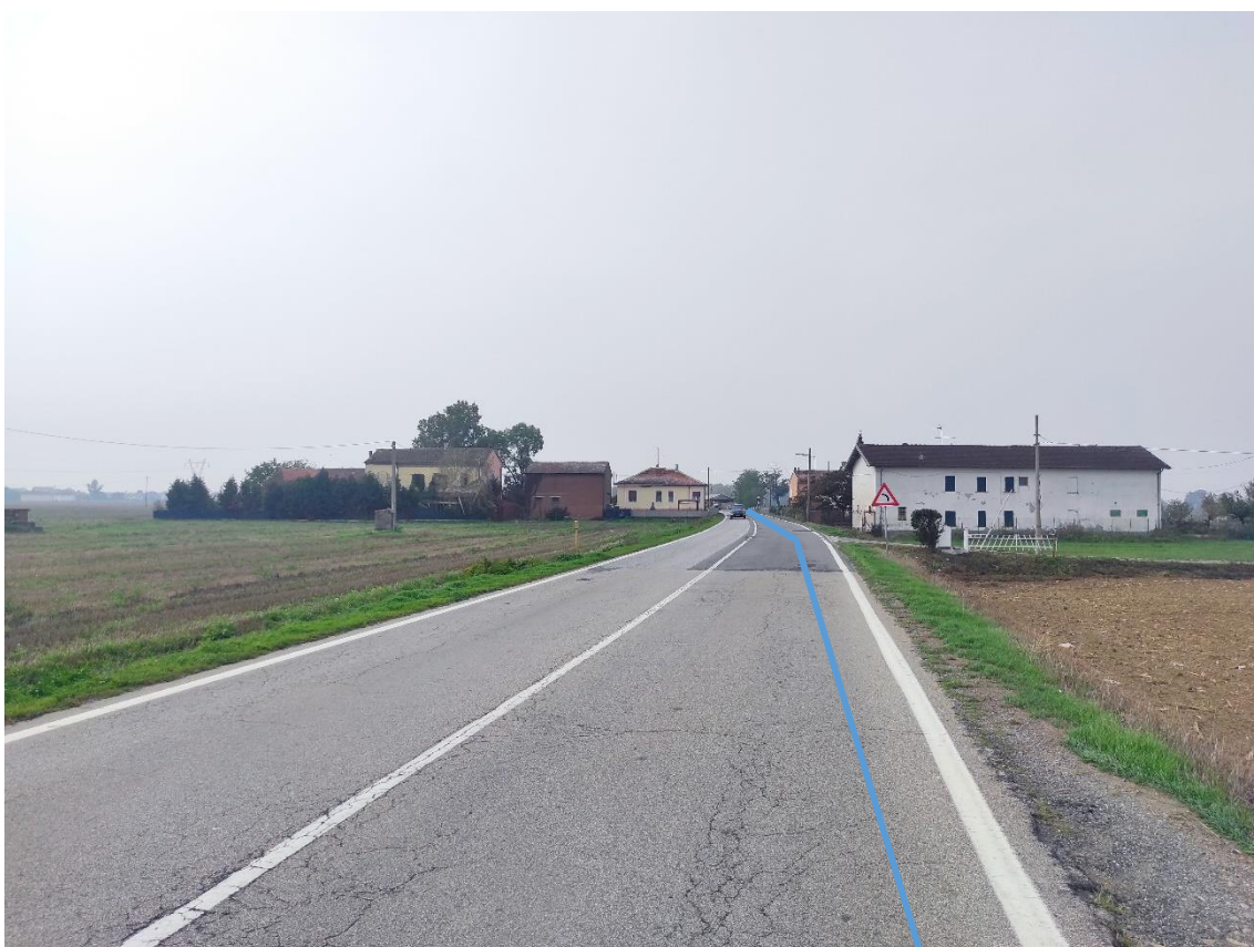
Figura 18. Strada Comunale Castelceriolo - Posa linea elettrica su strada asfaltata