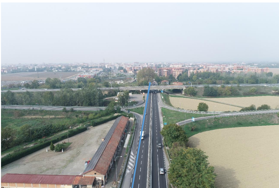
Figura 32. Strada Regionale 10 - Posa linea elettrica su strada asfaltata