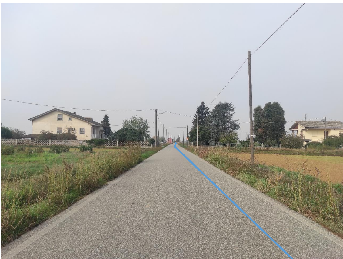
Figura 6. Strada Comunale Via Duomo - Posa linea elettrica su strada asfaltata