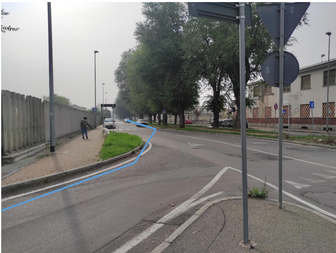
Figura 45. Incrocio St. Comunale Via Sardegna-Via S. Giovanni Bosco - Posa linea elettrica su strada asfaltata