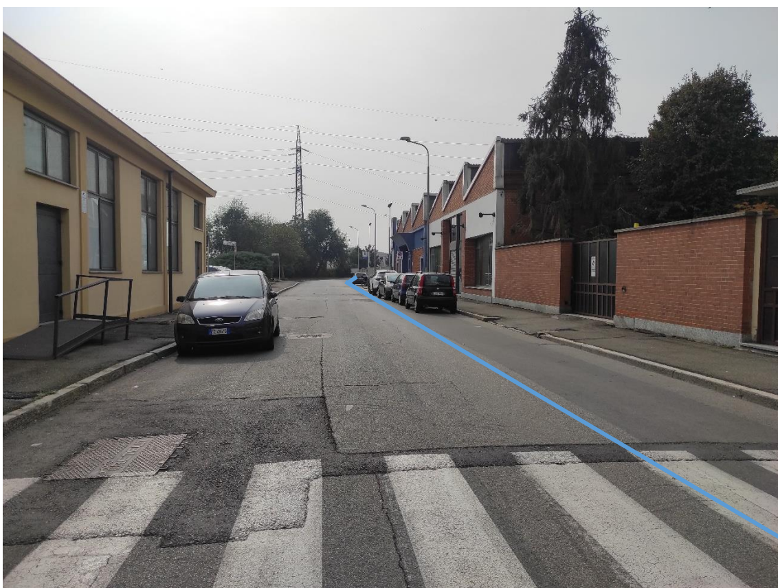
Figura 42. Strada Comunale Via Sardegna - Posa linea elettrica su strada asfaltata