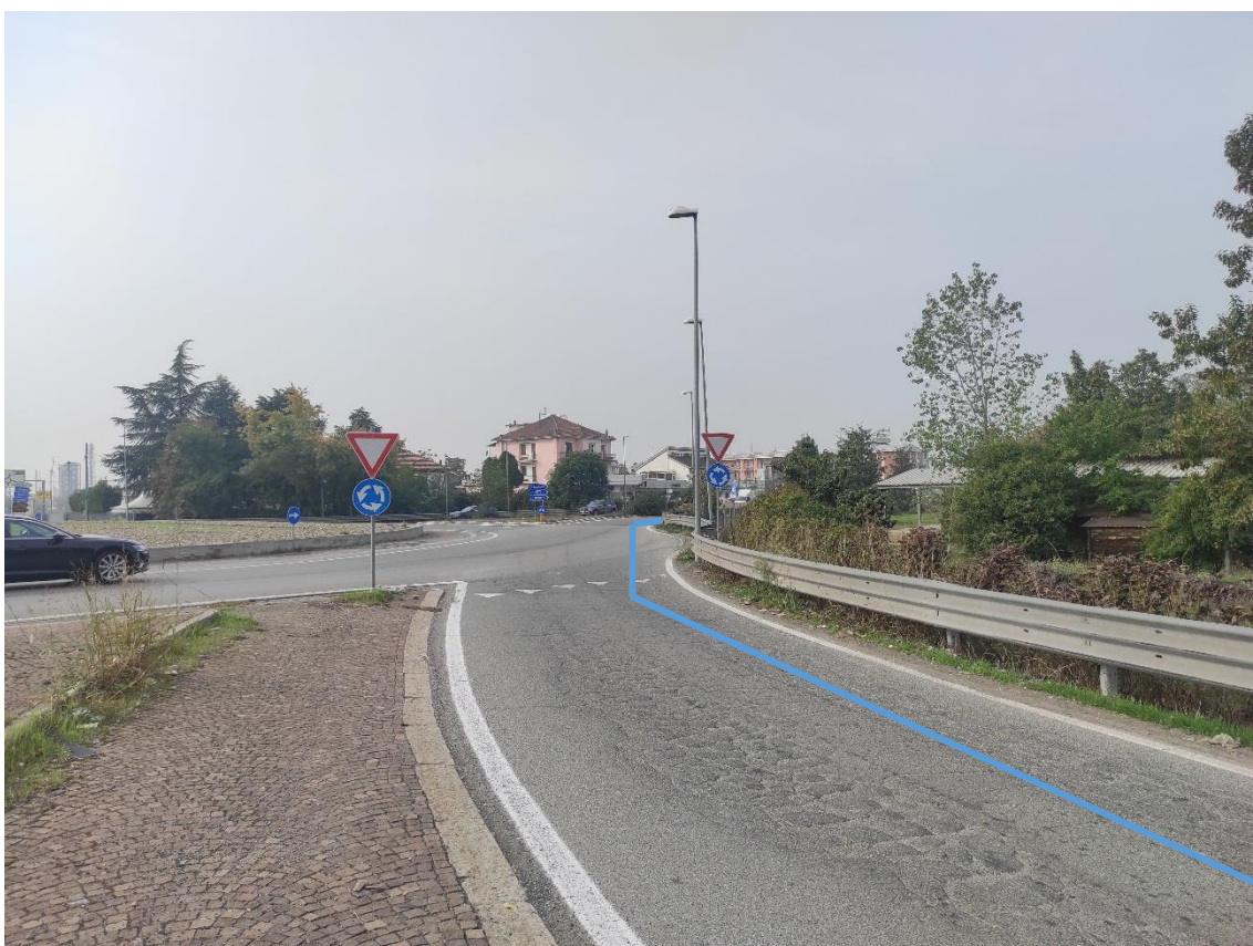
Figura 20. Incrocio Strada Comunale Castelceriolo-SR. 10 - Posa linea elettrica su strada asfaltata