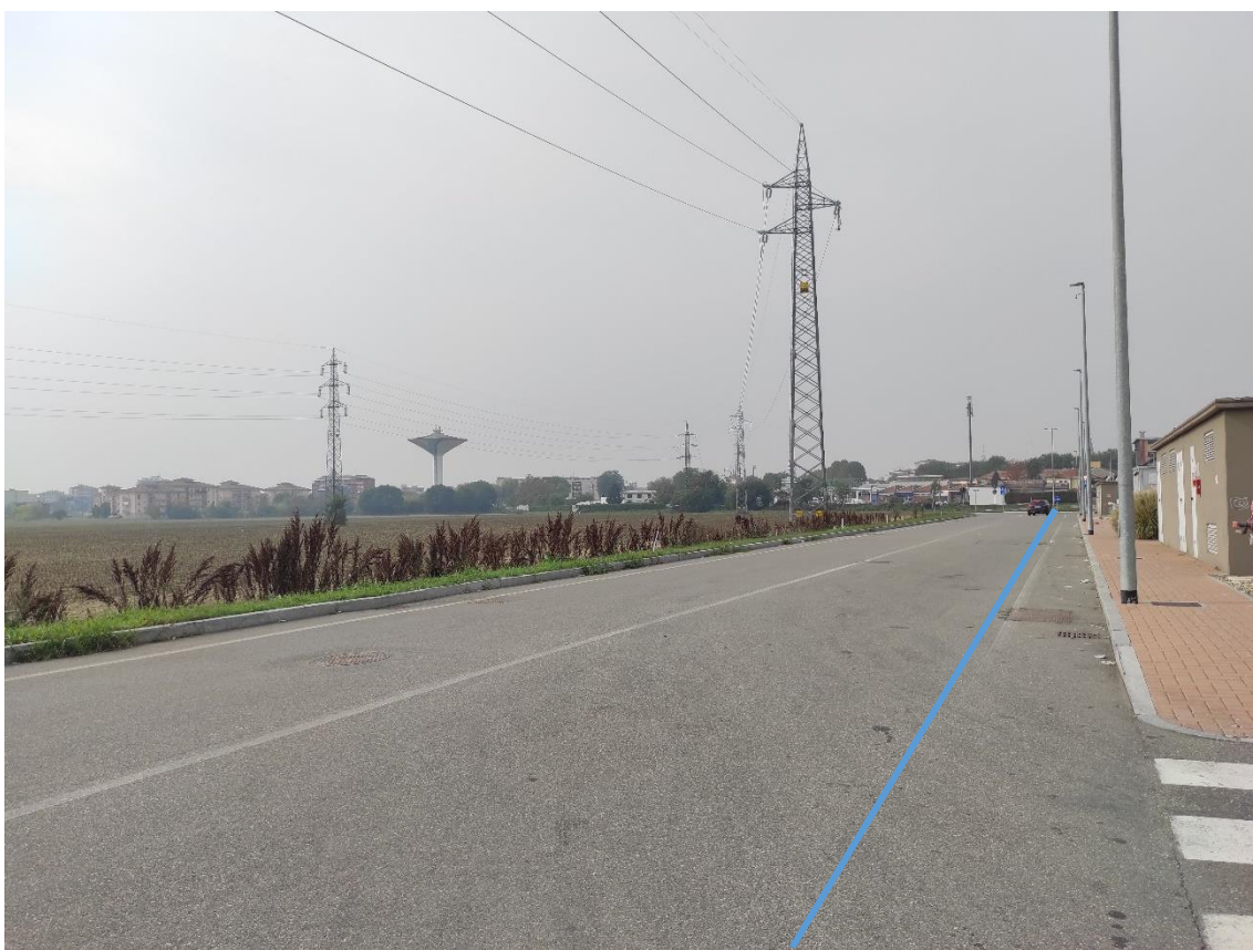
Figura 38. Strada Comunale - Posa linea elettrica su strada asfaltata