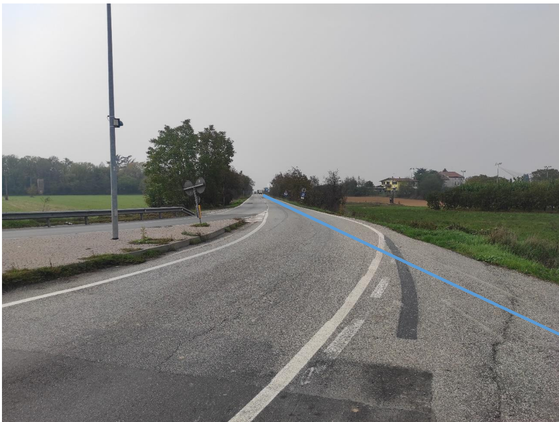
Figura 15. Strada Comunale Castelceriolo - Posa linea elettrica su strada asfaltata