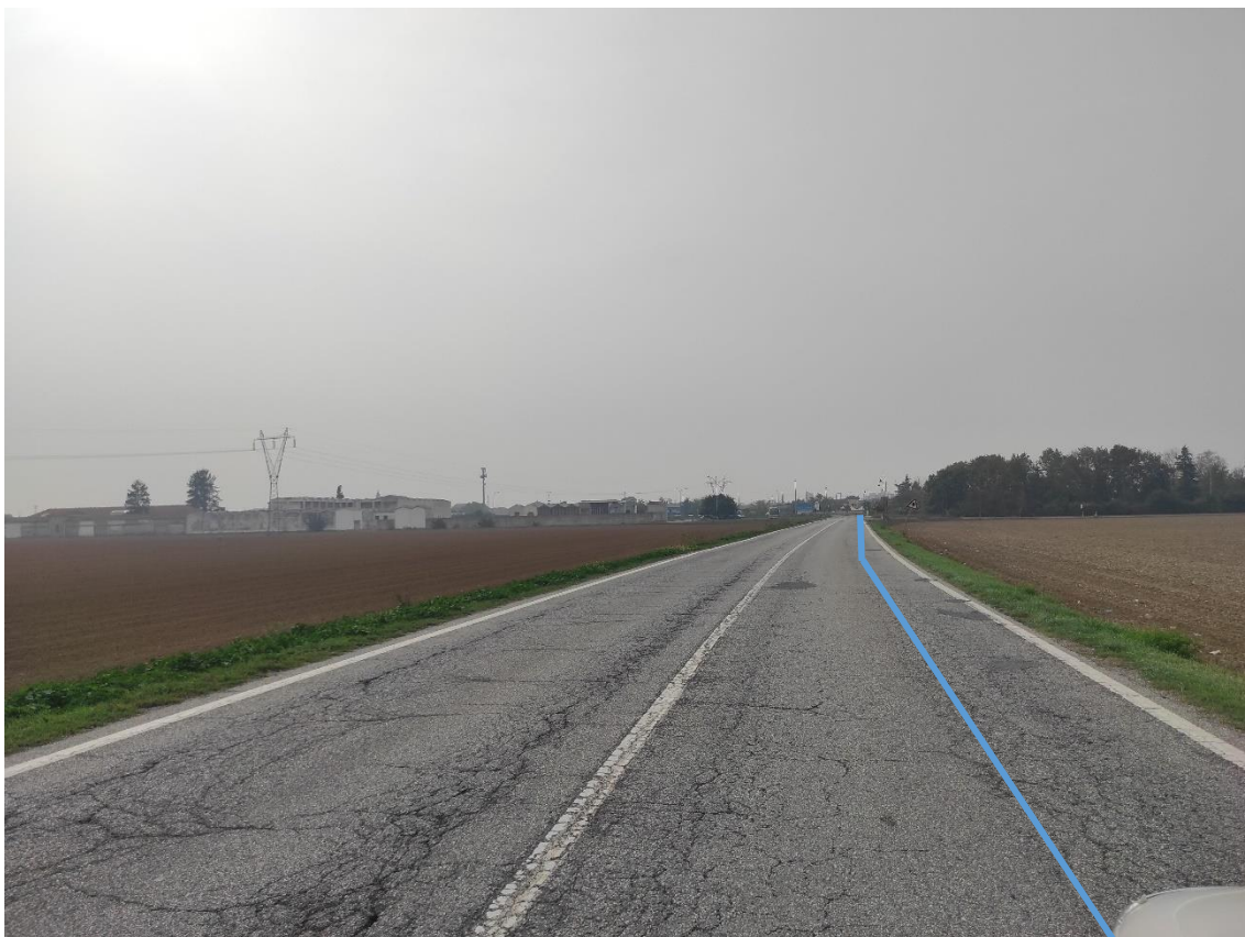
Figura 19. Strada Comunale Castelceriolo - Posa linea elettrica su strada asfaltata