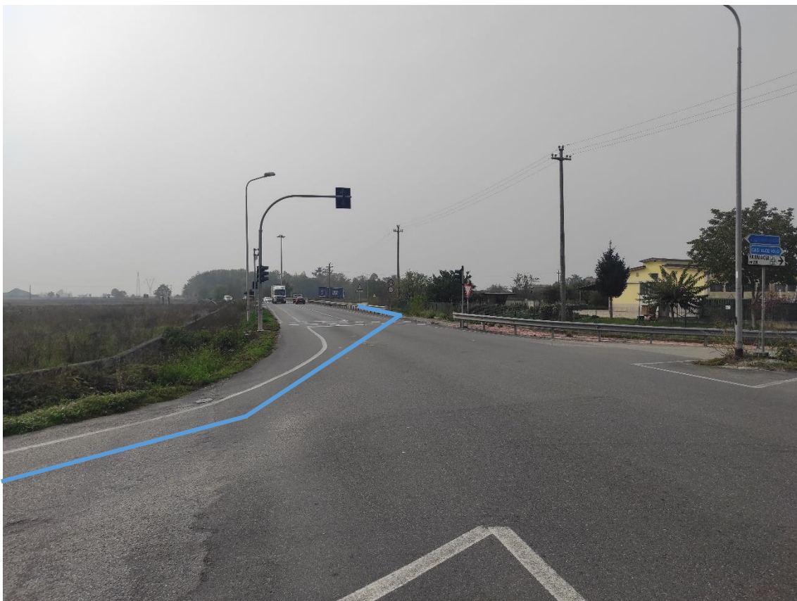
Figura 13. Incrocio Strada Comunale Via San Giuliano Nuova-SP.82 - Posa linea elettrica su strada asfaltata