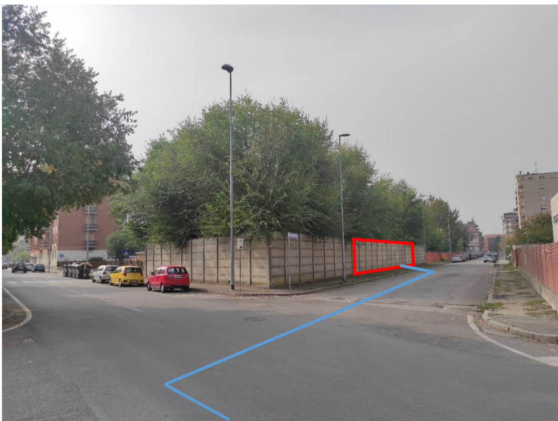
Figura 48. Incrocio Strada Comunale Via San Giovanni Bosco-Via Giovanni de Negri - Posa linea elettrica su strada asfaltata