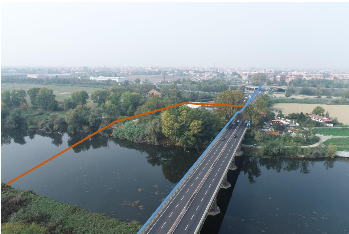
Figura 29. Strada Regionale 10-Attraversamento fiume - Posa linea elettrica su ponte e alternativa con TOC