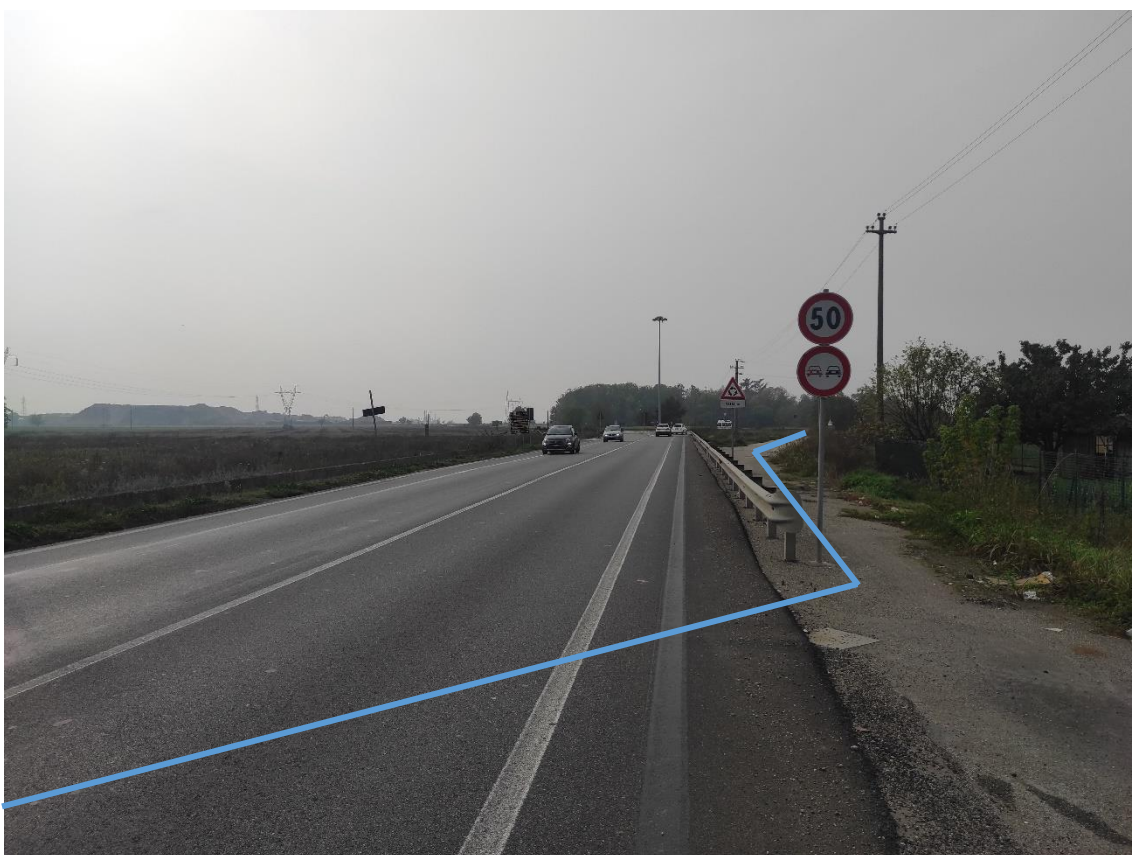
Figura 14. Percorso ciclopedonale adiacente alla SP.82 - Posa linea elettrica su strada asfaltata