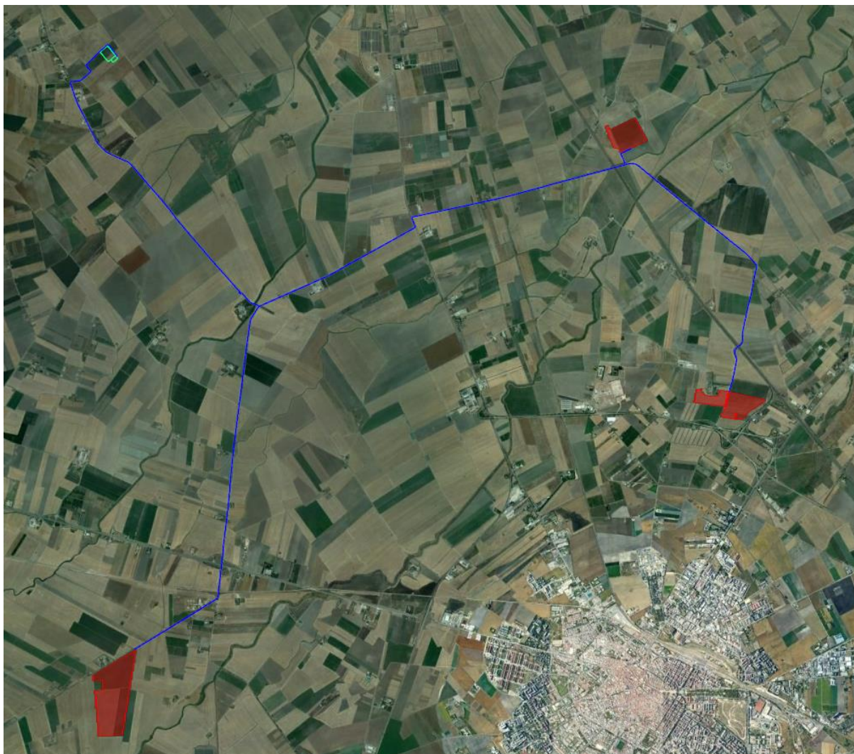
Figura 3.1: In blu il percorso di connessione dal campo FV (rosso) alla nuova SE di Trasformazione (verde)

Per la soluzione di connessione alla nuova SE partirà una linea in cavo interrato in alta tensione 36 kV verso le cabine di raccolta dell'impianto fotovoltaico. Da tali cabine avverrà la distribuzione interna all'impianto, sempre a 36 kV, verso le Power Station. Tutta la potenza generata dall'impianto fotovoltaico verrà ceduta in rete attraverso i suddetti sistemi.