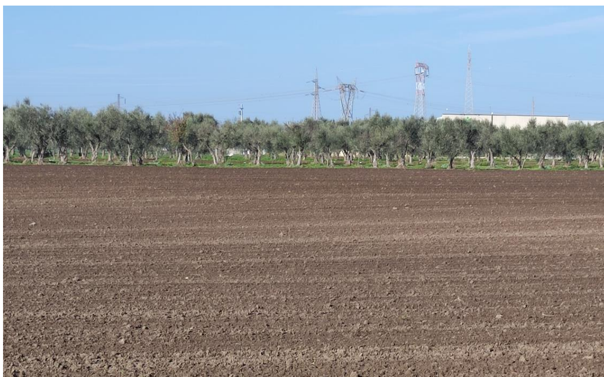
Particolare di coltivazioni arboree adiacenti al sito di realizzo