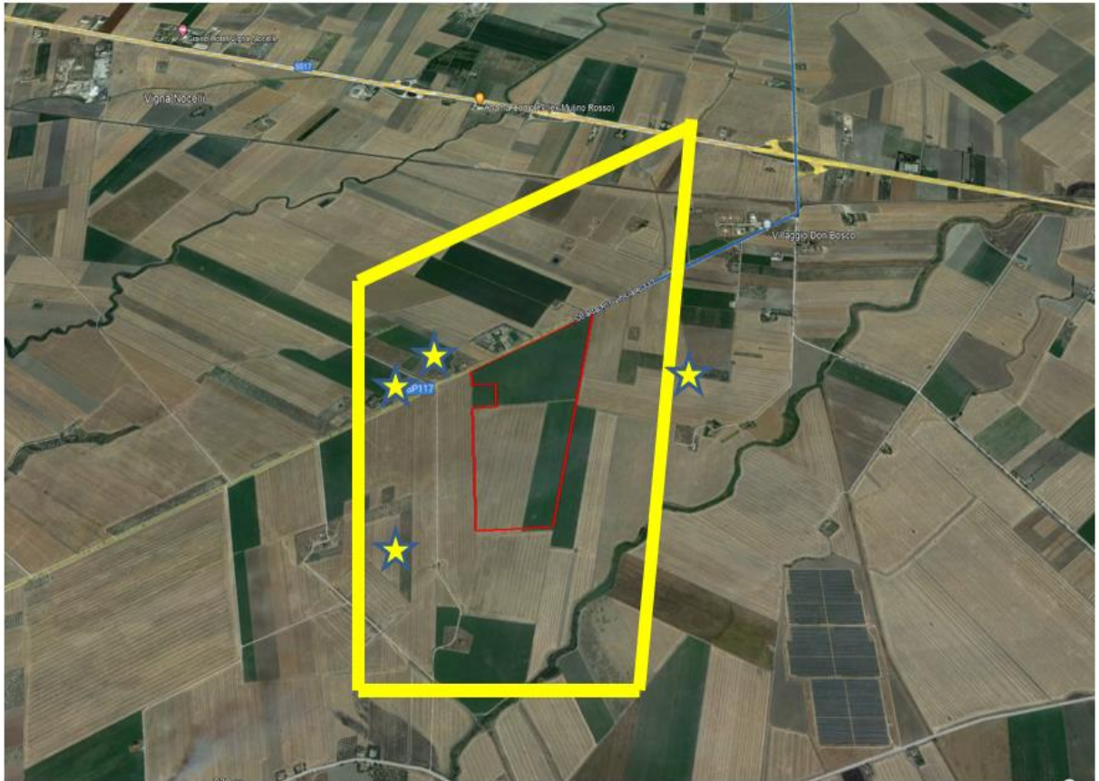
Figura 1A - agro di Lucera campo A - buffer 500 mt

consultazione delle fonti istituzionali.