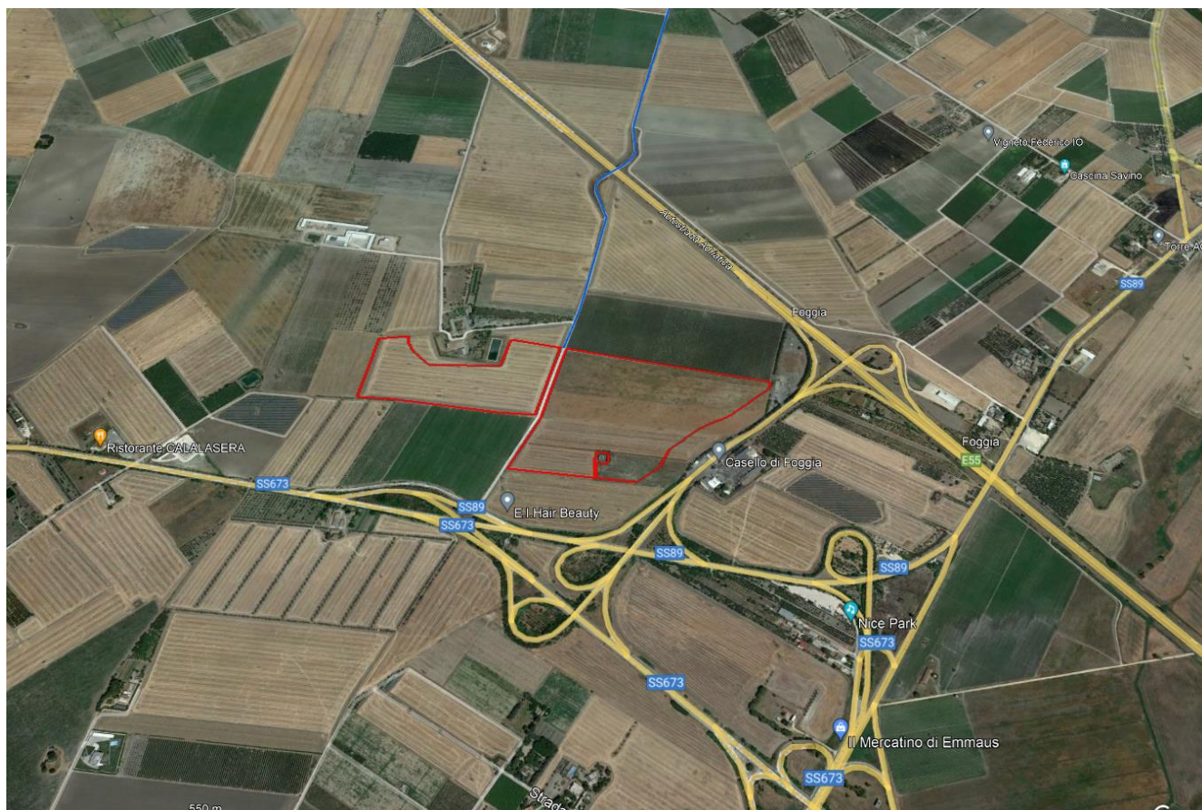
Ortofoto Campo C - agro di Foggia