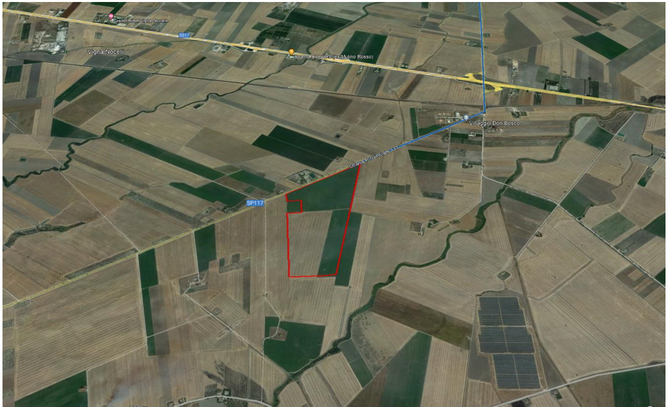
Ortofoto Campo A - agro di Lucera