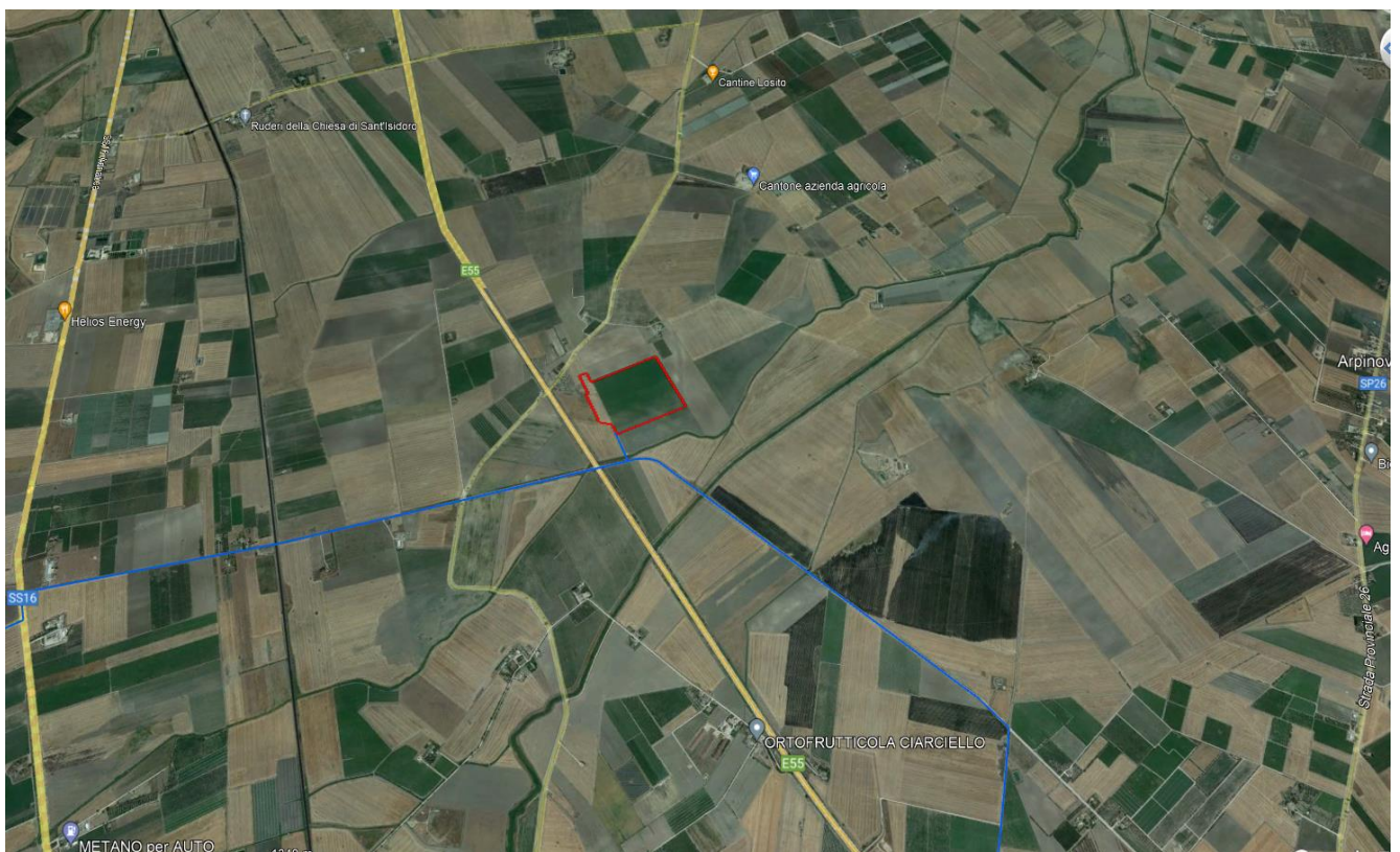
Ortofoto Campo B - agro di Foggia