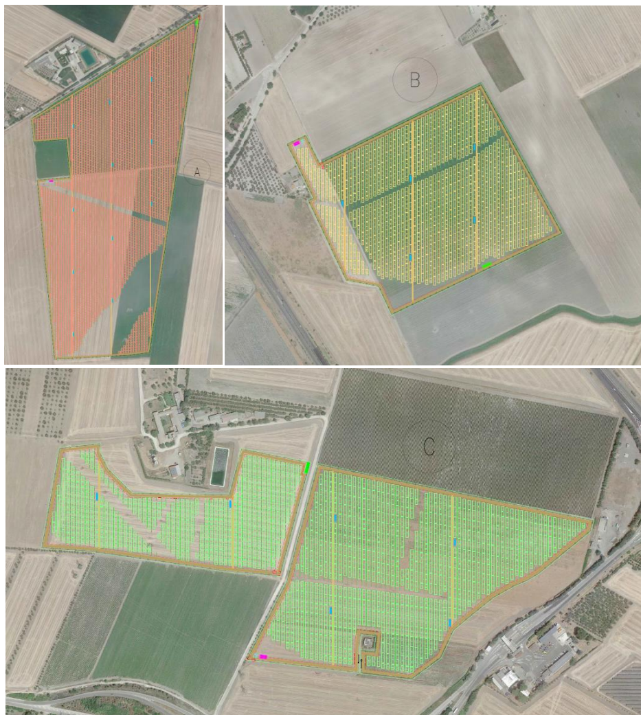
Figura 2.2: Layout di progetto