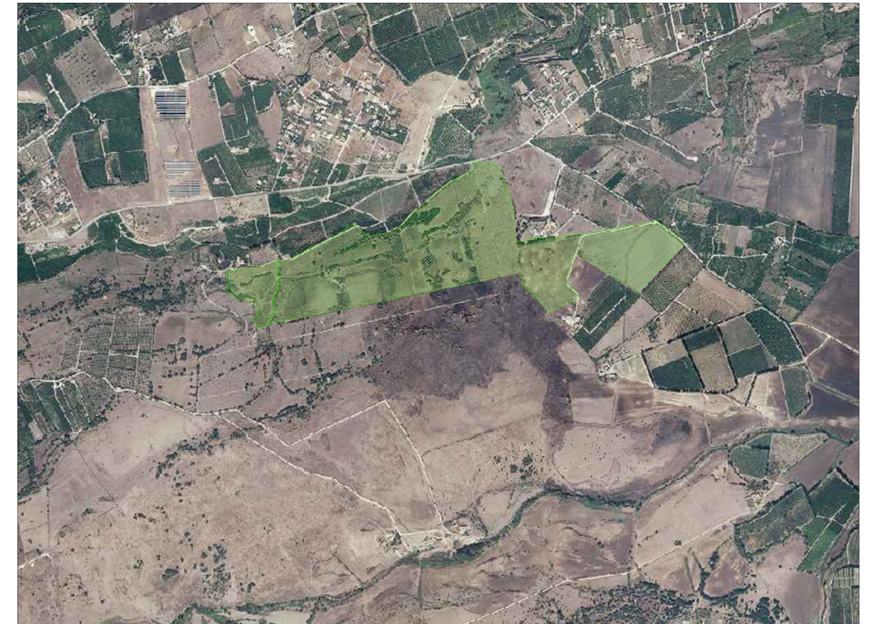
Area Impianto FV in progetto