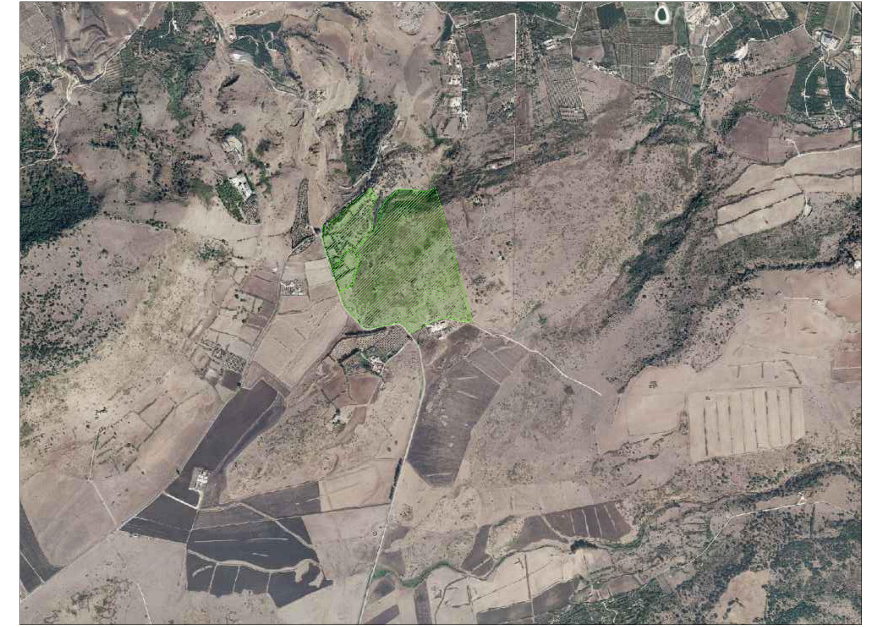
Area Impianto FV in progetto