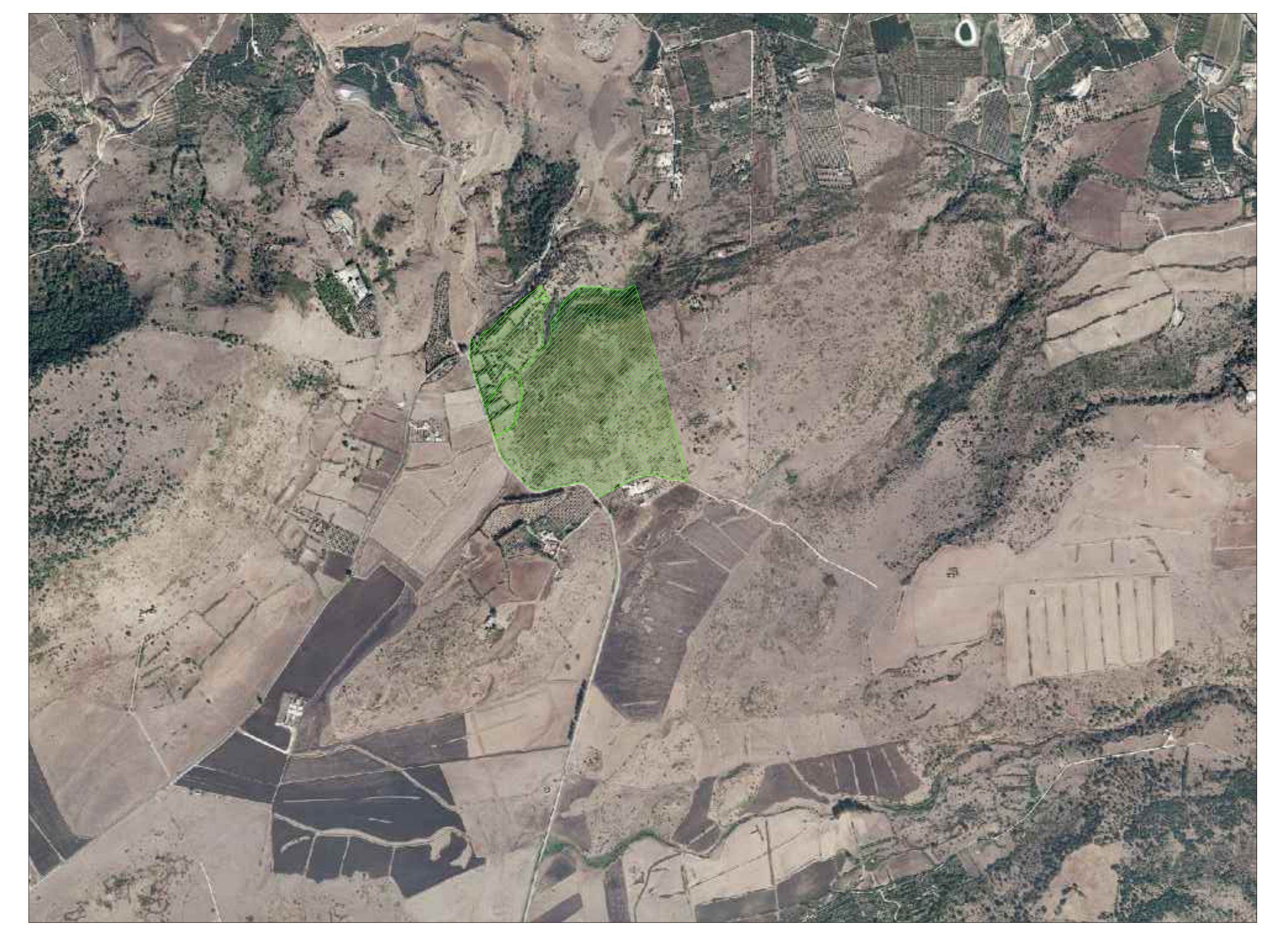
Area Impianto FV in progetto STRALCIO ORTOFOTO SCALA 1:10.000