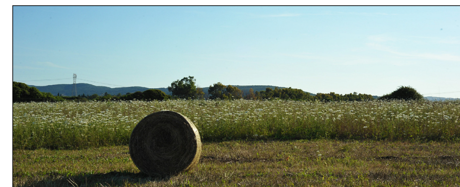
IMPIANTO AGRIVOLTICO SAS DOMOS COMUNE DI PORTO TORRES