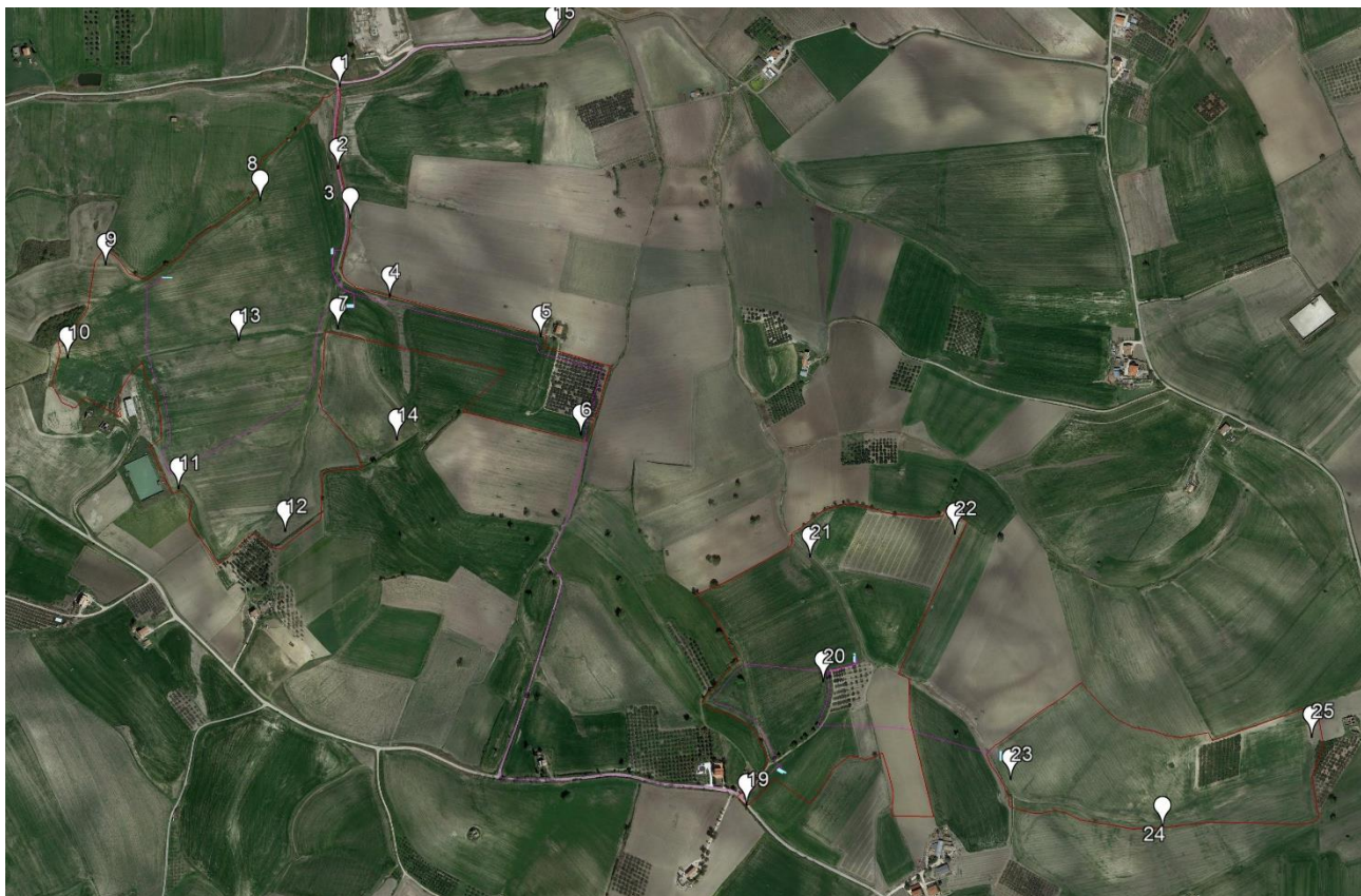
Inquadramento generale punti di ripresa