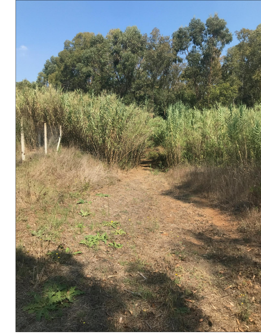
PUNTO DI SCATTO N. 5