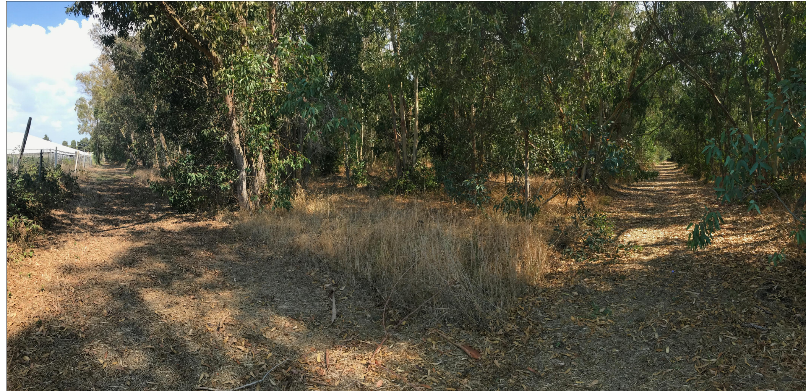
PUNTO DI SCATTO N. 3