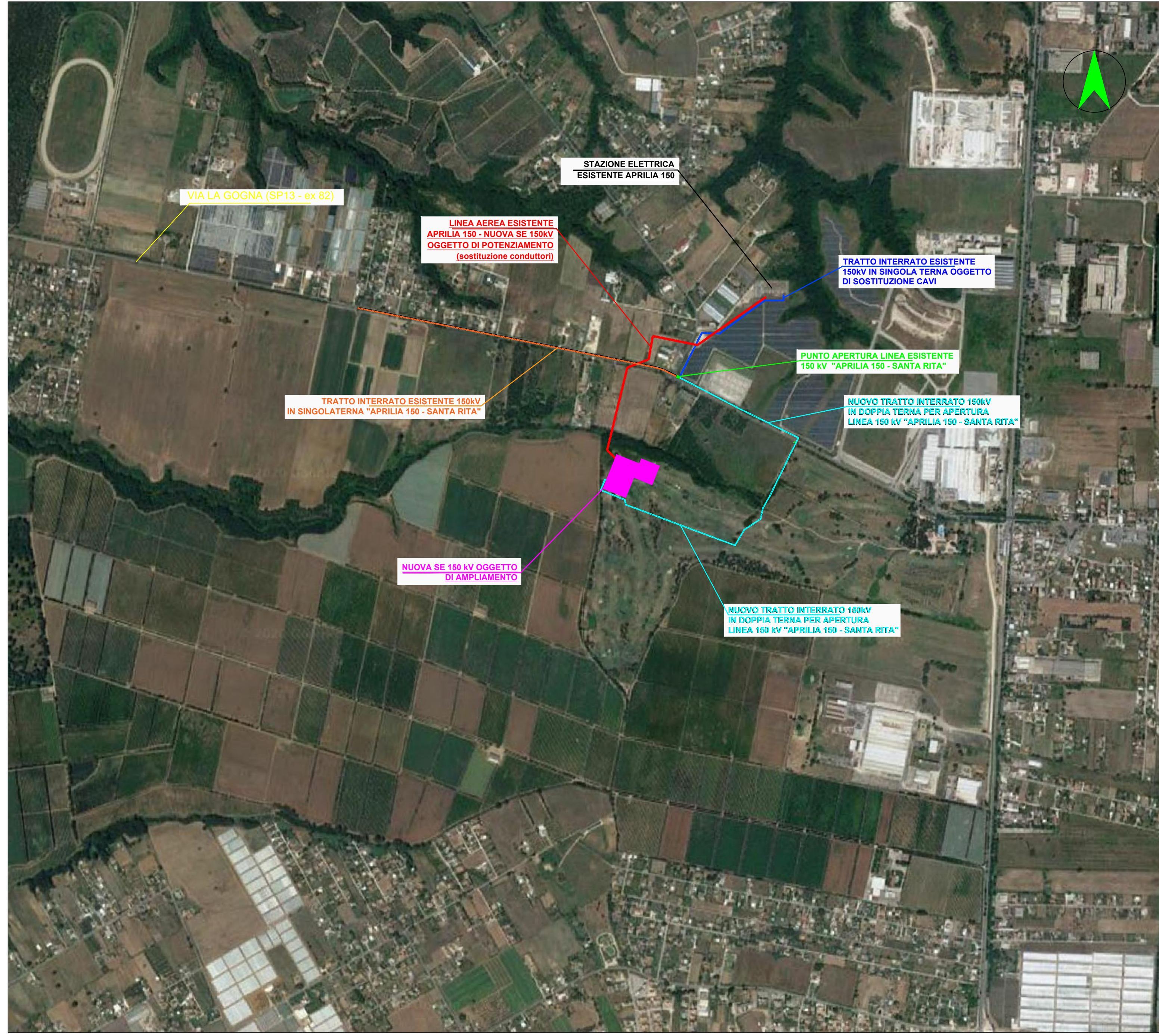
INQUADRAMENTO SU ORTOFOTO - Scala 1:10.000