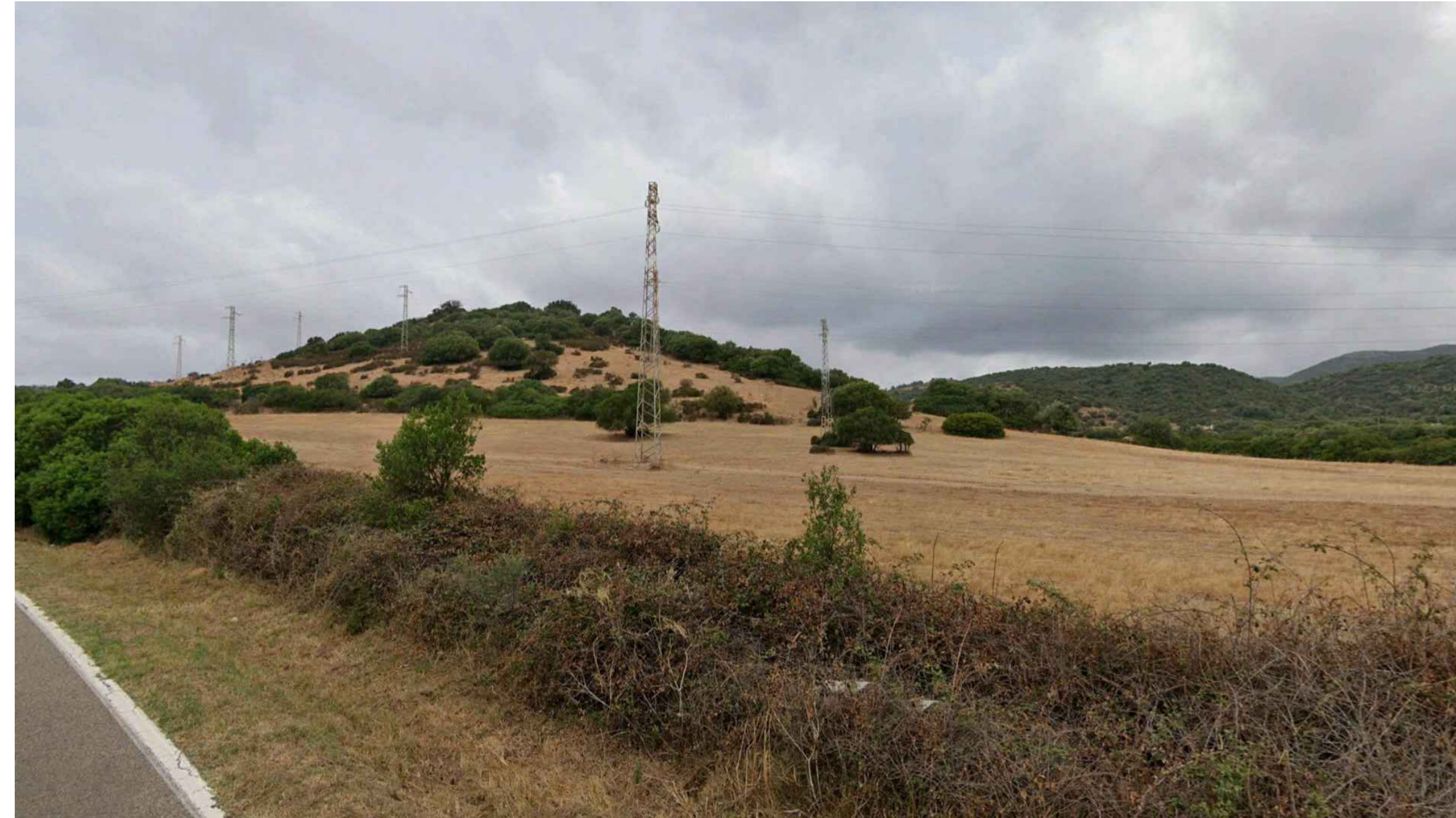
Vista 3 - Stato Ante Operam