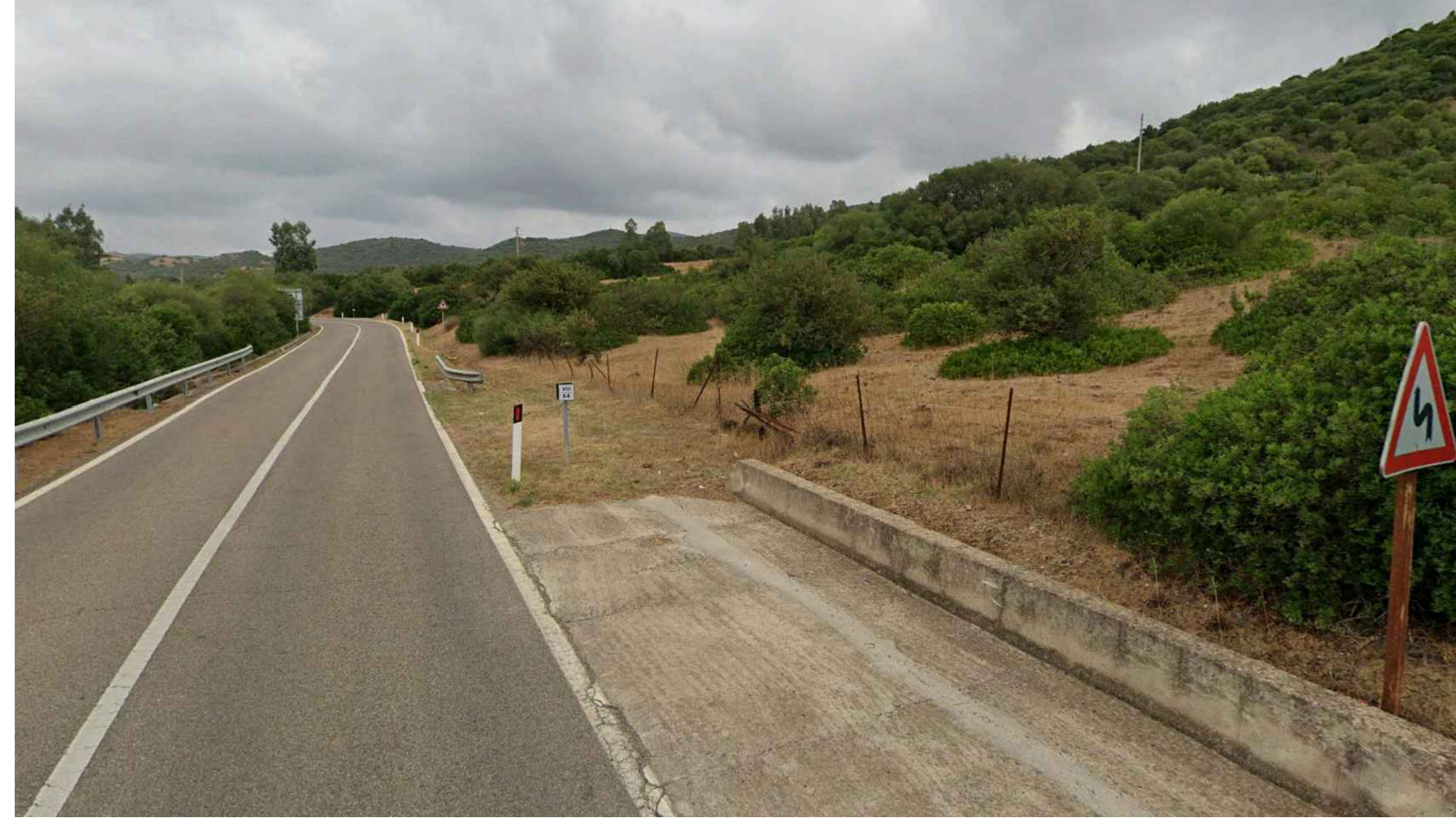
Vista 1 - Stato Ante Operam