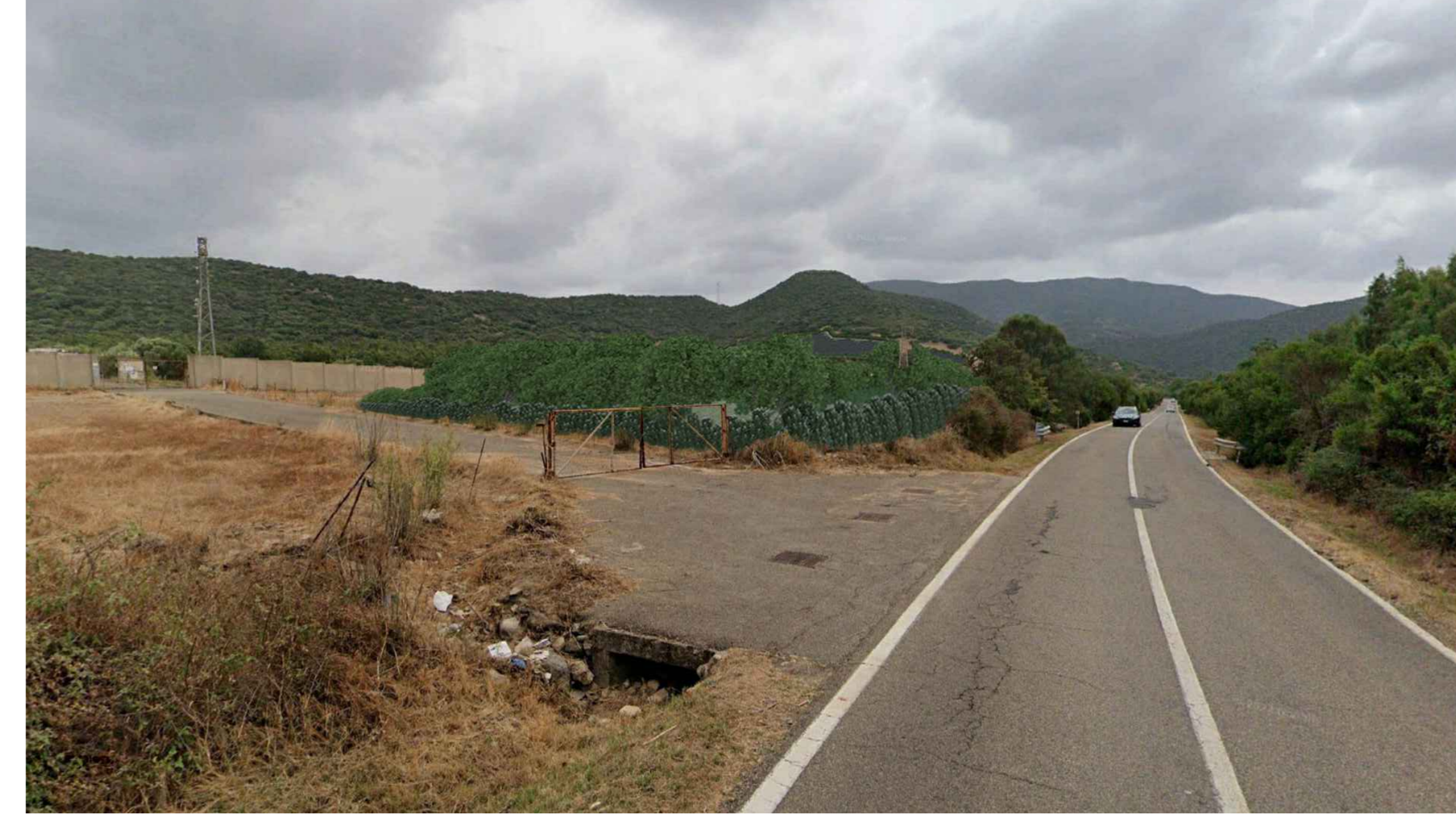
Vista 2 - Stato Post Operam