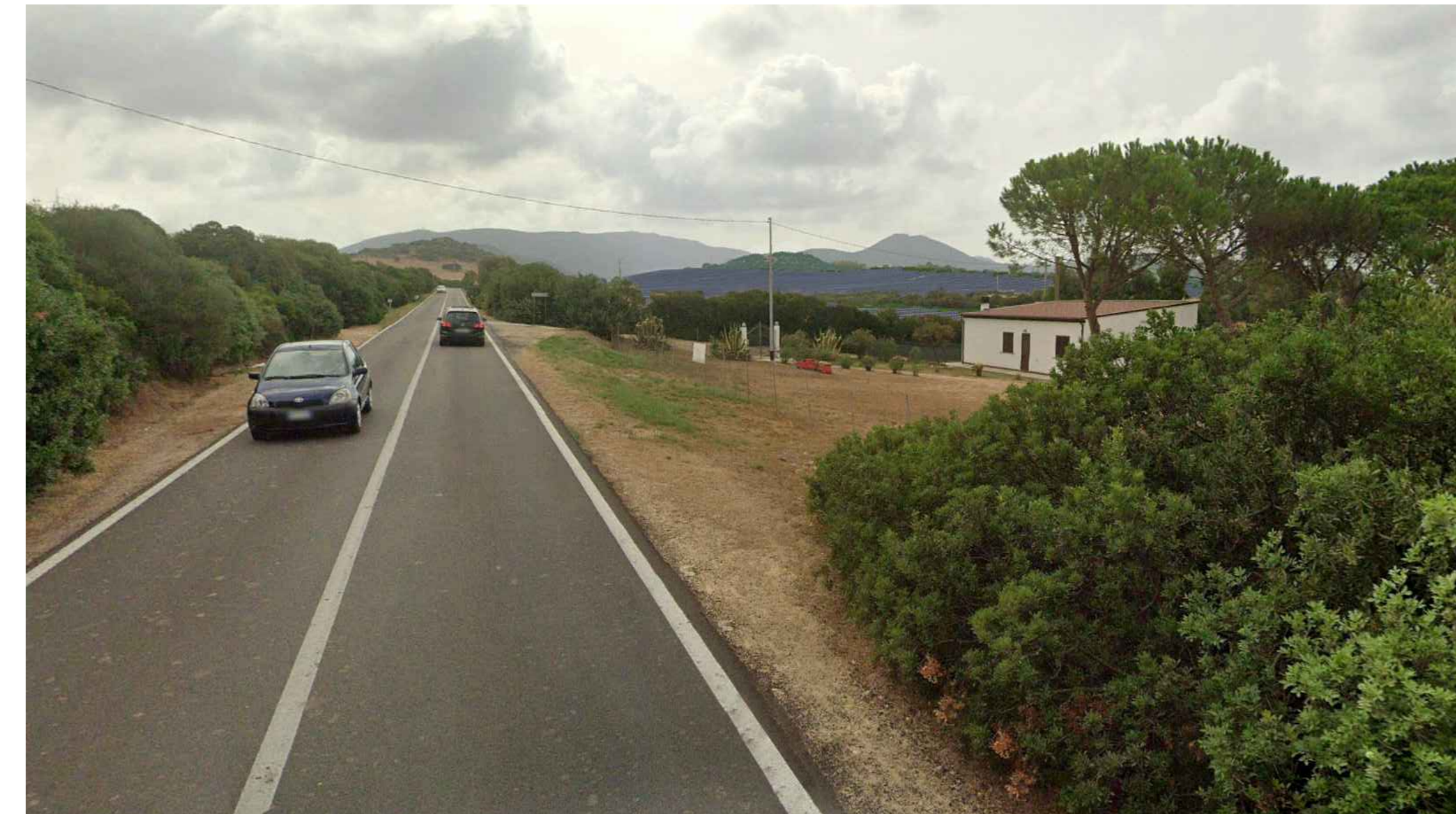
Vista 4 - Stato Post Operam