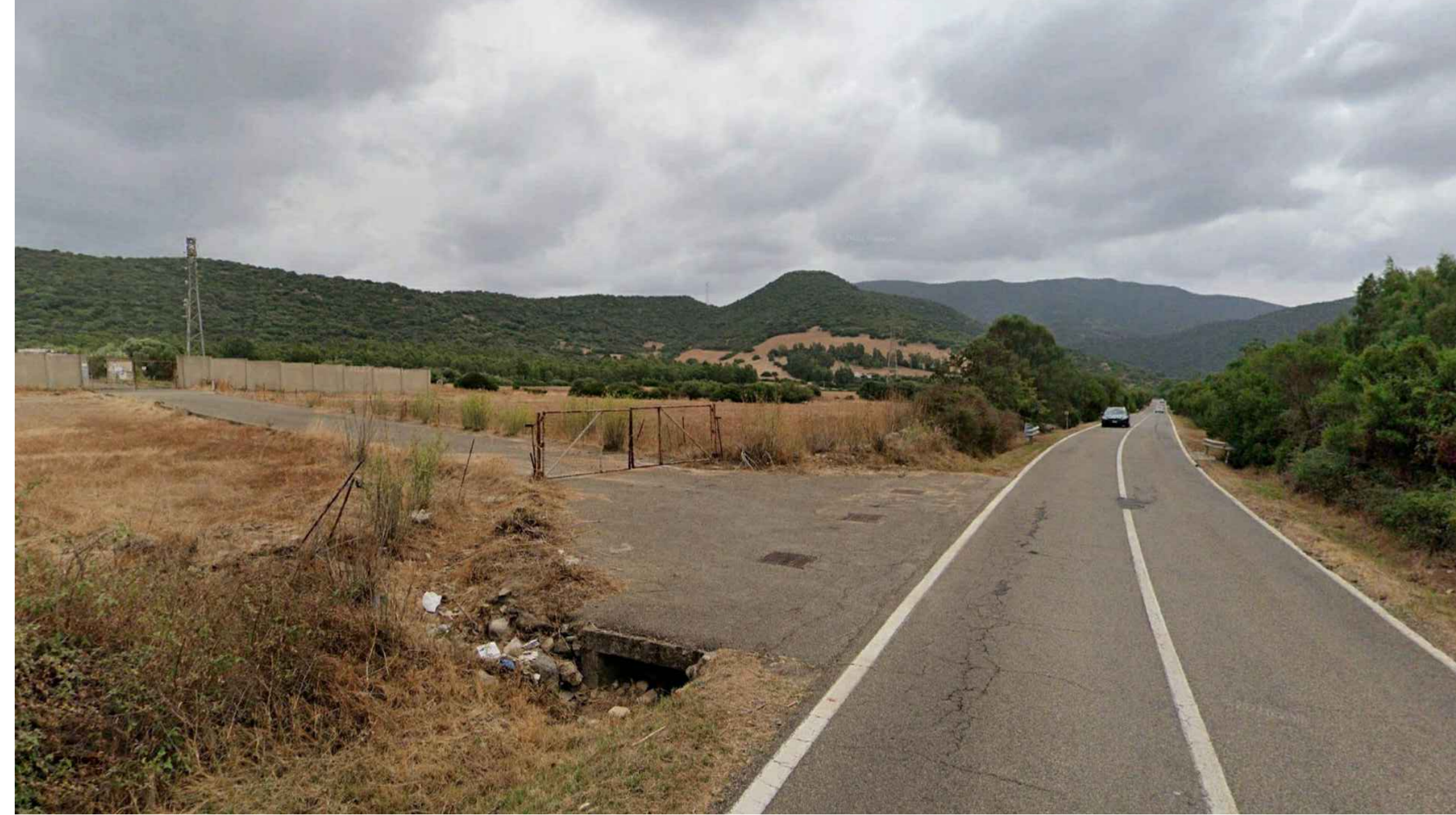
Vista 2 - Stato Ante Operam