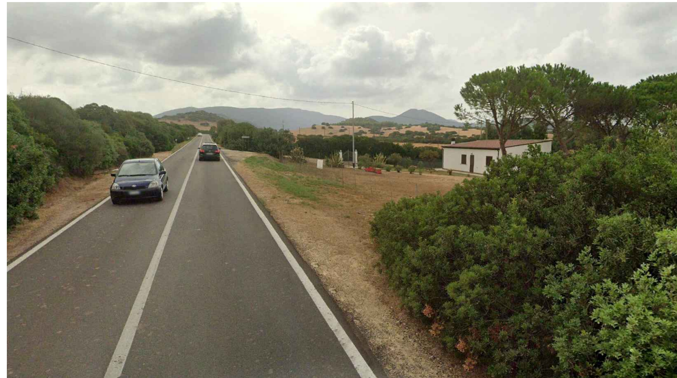
Vista 4 - Stato Ante Operam