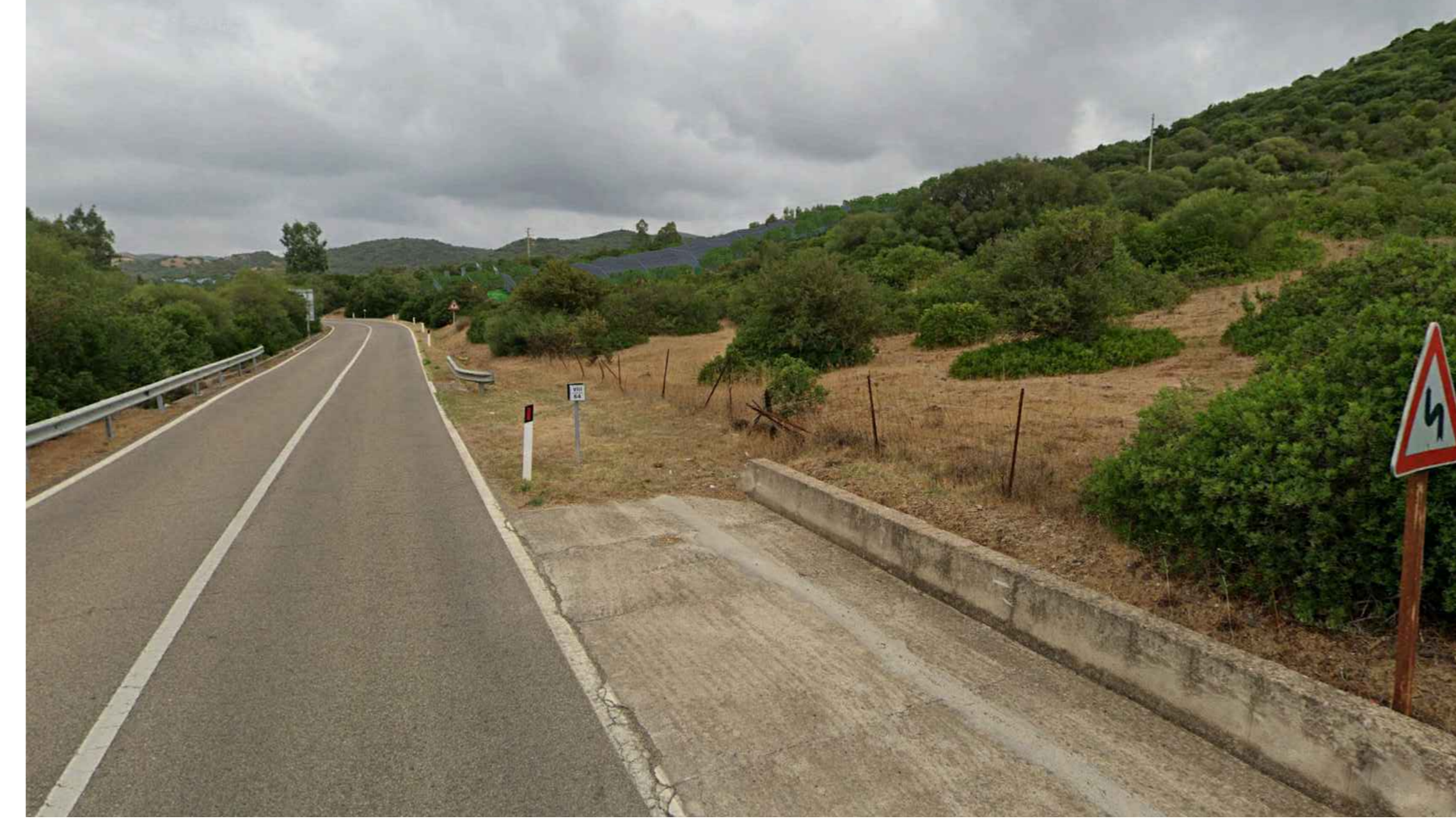
Vista 1 - Stato Post Operam