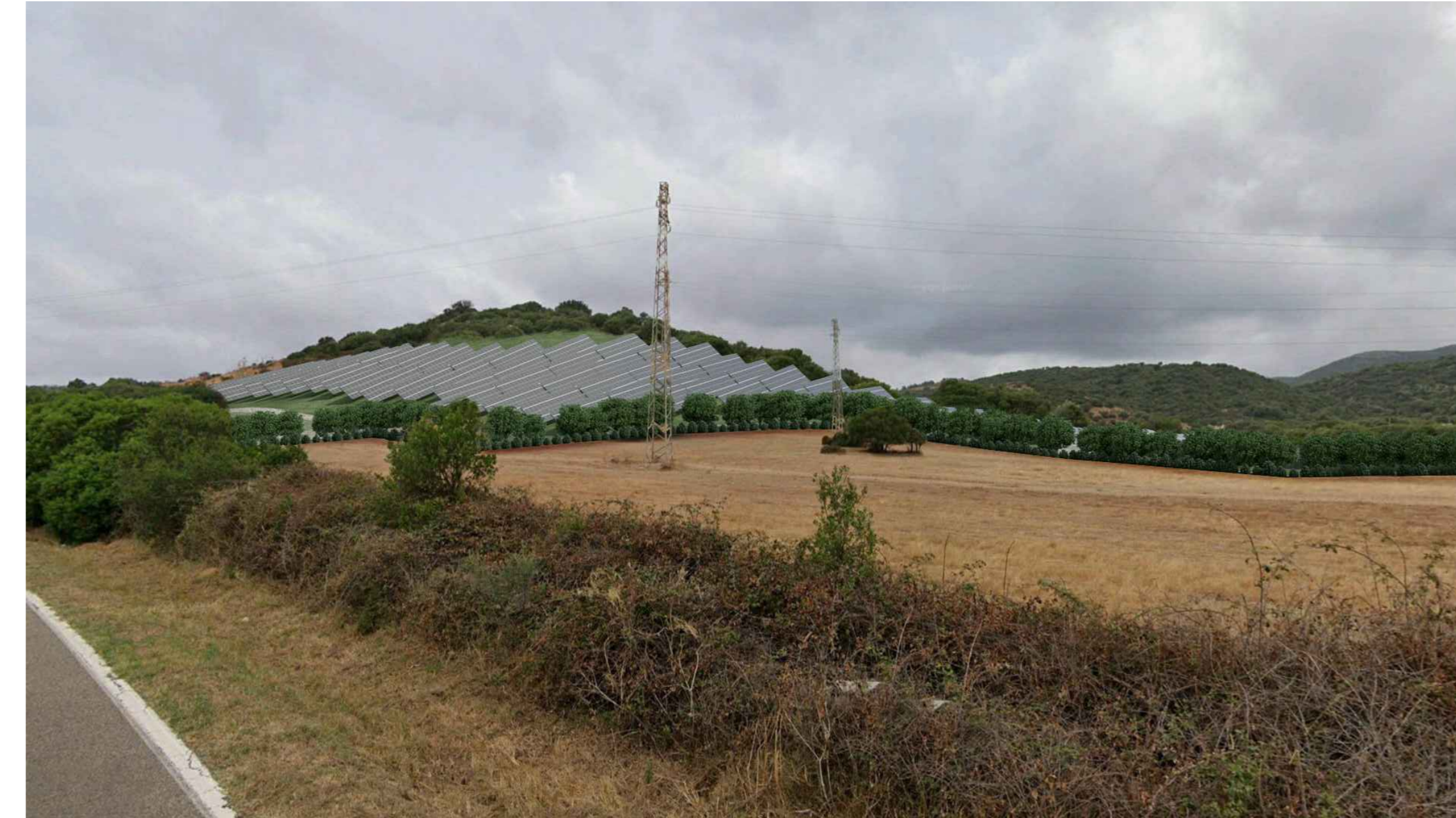
Vista 3 - Stato Post Operam