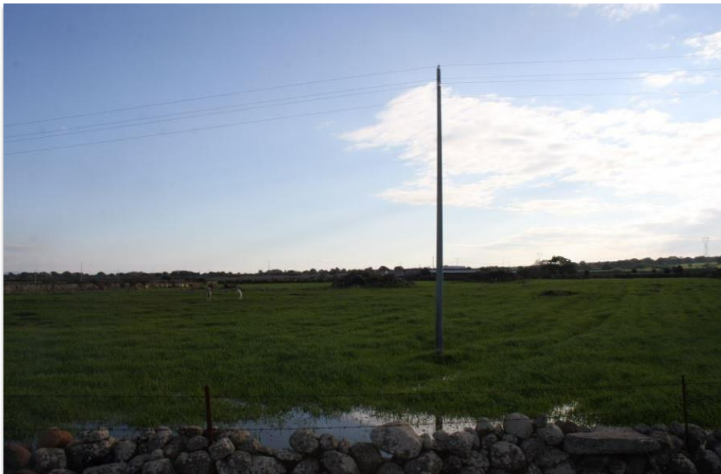
FIGURA 13: VISTA DI UNA DELLE AREE DI PROGETTO.