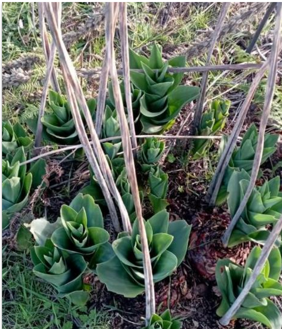
FIGURA 2: CHARYBDIS PANCRATION .