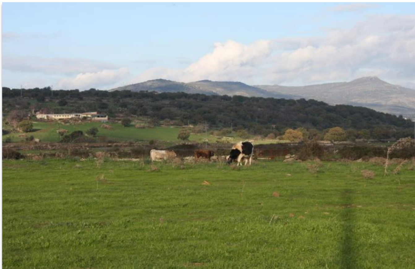
FIGURA 6: PASCOLO IN ATTO DURANTE L'ATTIVITÀ DI SOPRALLUOGO.