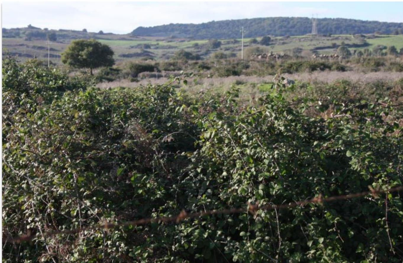
FIGURA 8: SIEPI DI ROVO, RUBUS ULMIFOLIUS .