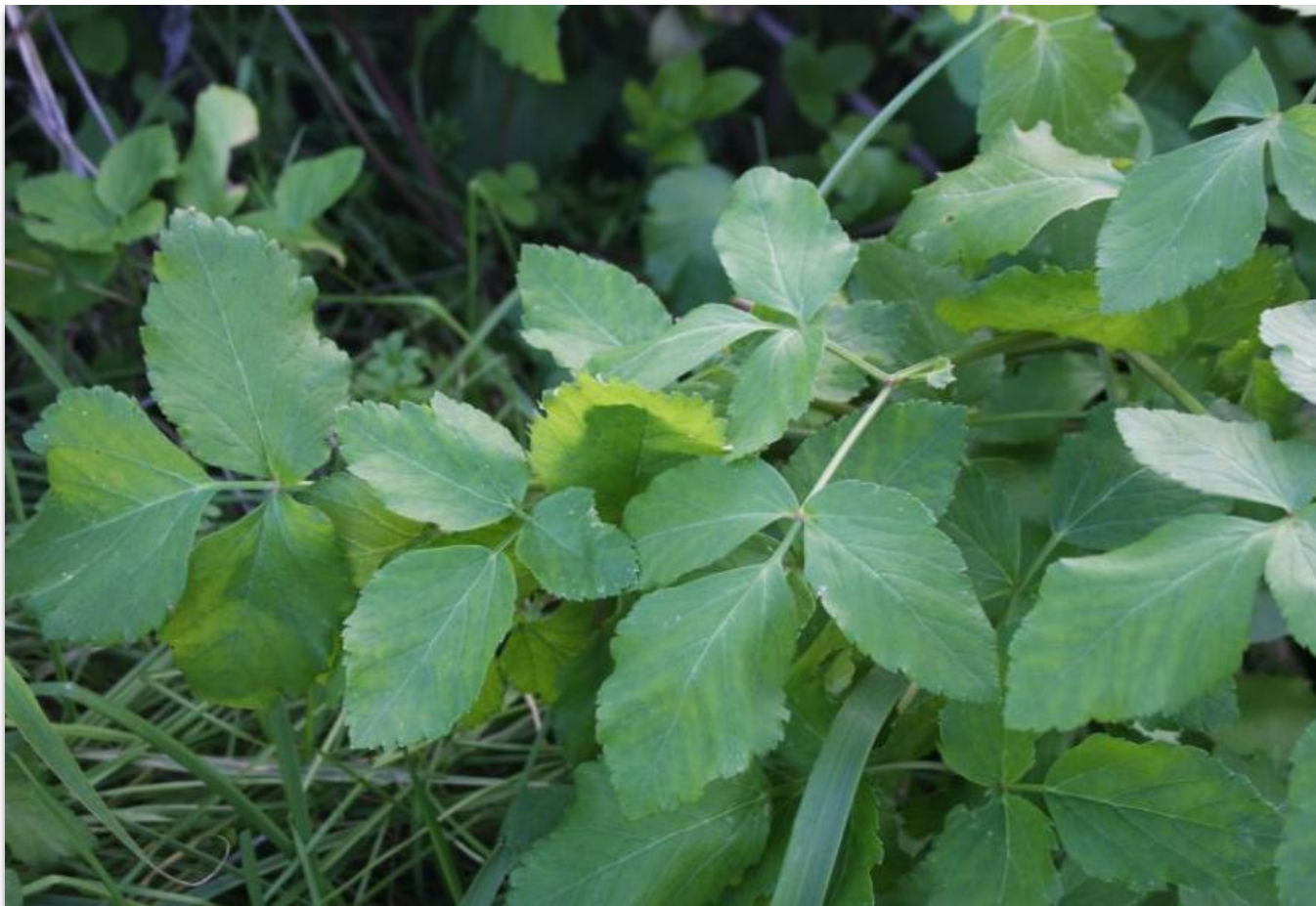
FIGURA 10: SMYRNIUM OLUSATRUM .