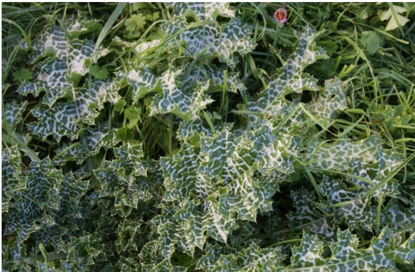
FIGURA 9: SILYBUM MARIANUM .