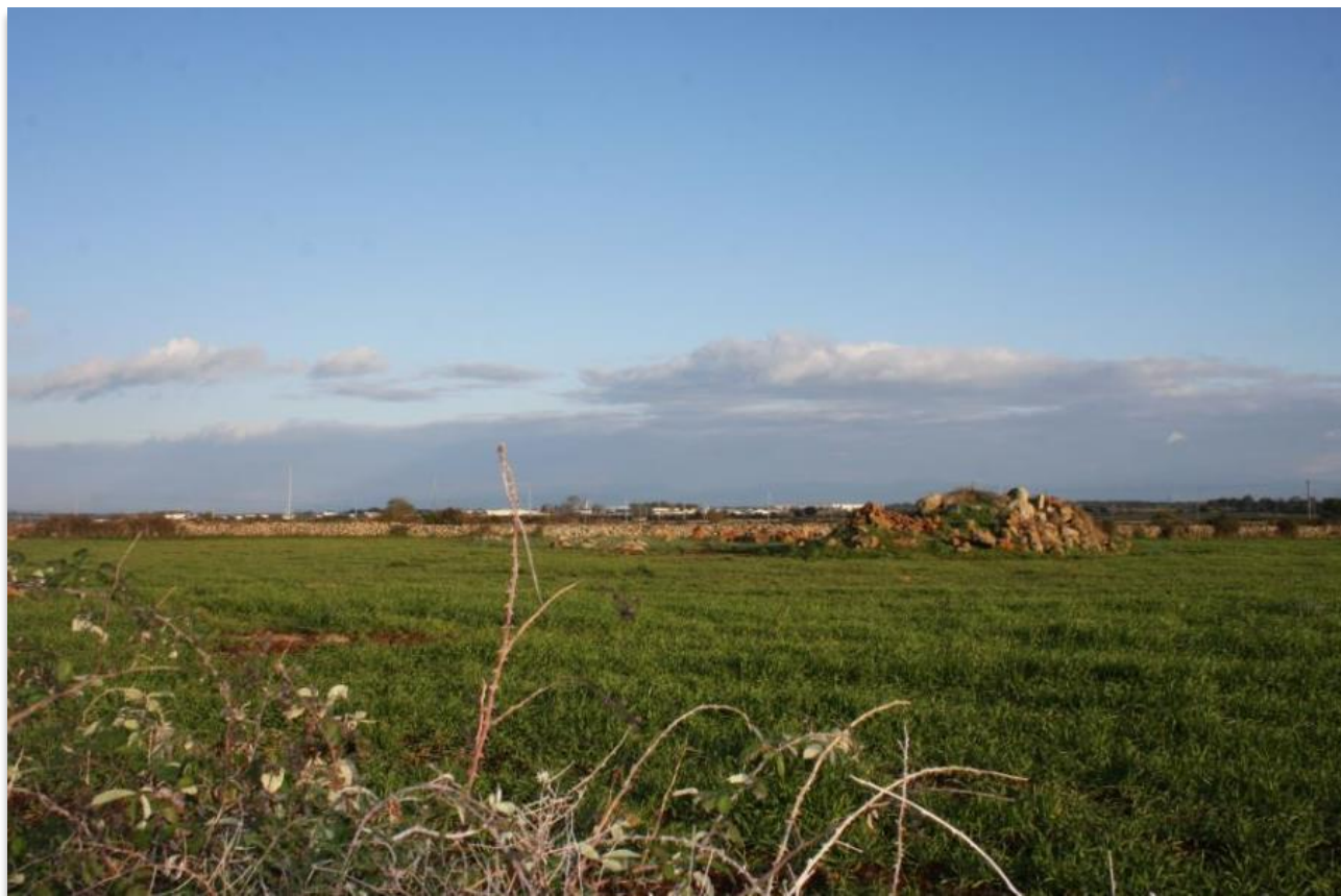
FIGURA 1: VISTA DI UNA DELLE AREE DI PROGETTO.