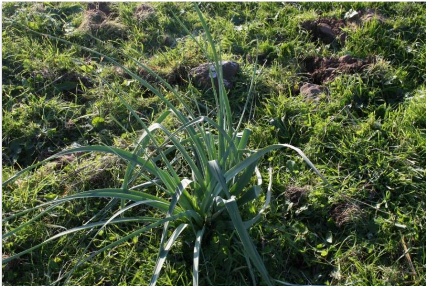
FIGURA 7: PIANTA DI ASFODELO.