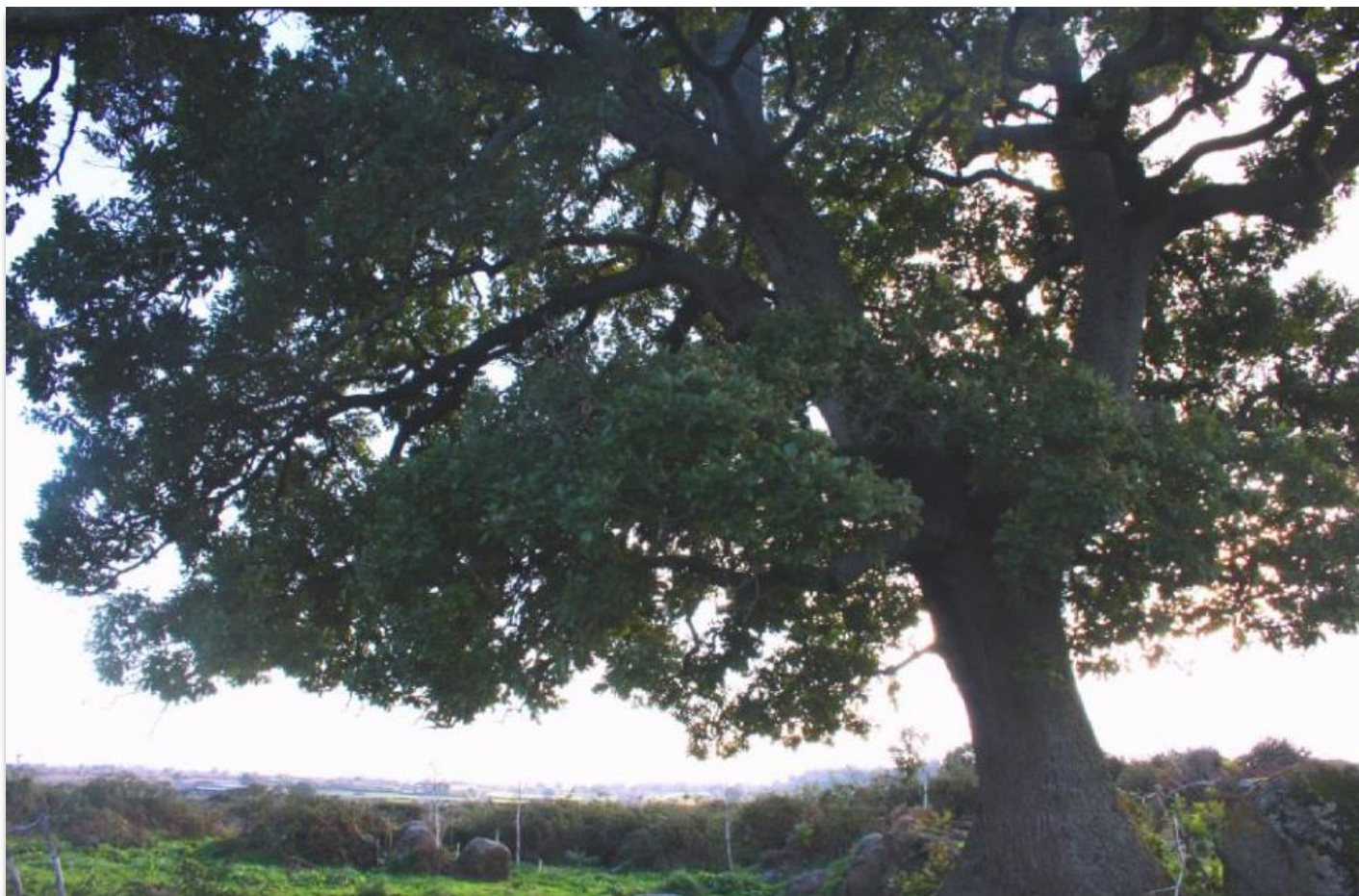
FIGURA 11: UNO DEGLI ALBERI DI QUERCIA RISCONTRATI NELLE AREE DI PROGETTO.