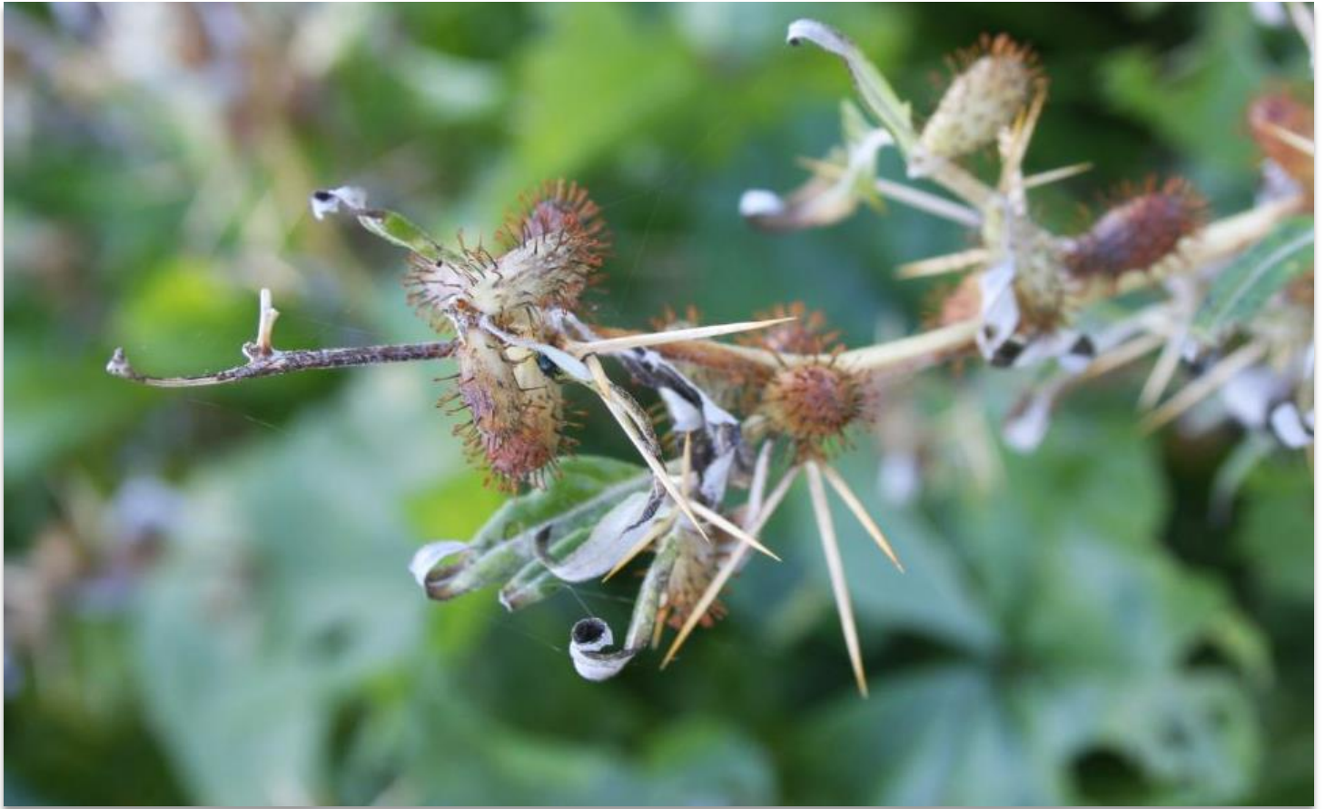
FIGURA 14: XANTHIUM SPINOSUM .