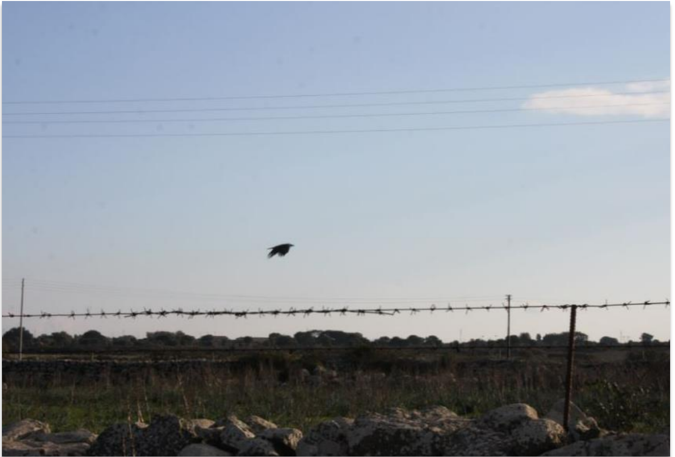
FIGURA 3: CORVUS CORNIX , LA CORNACCHIA GRIGIA.