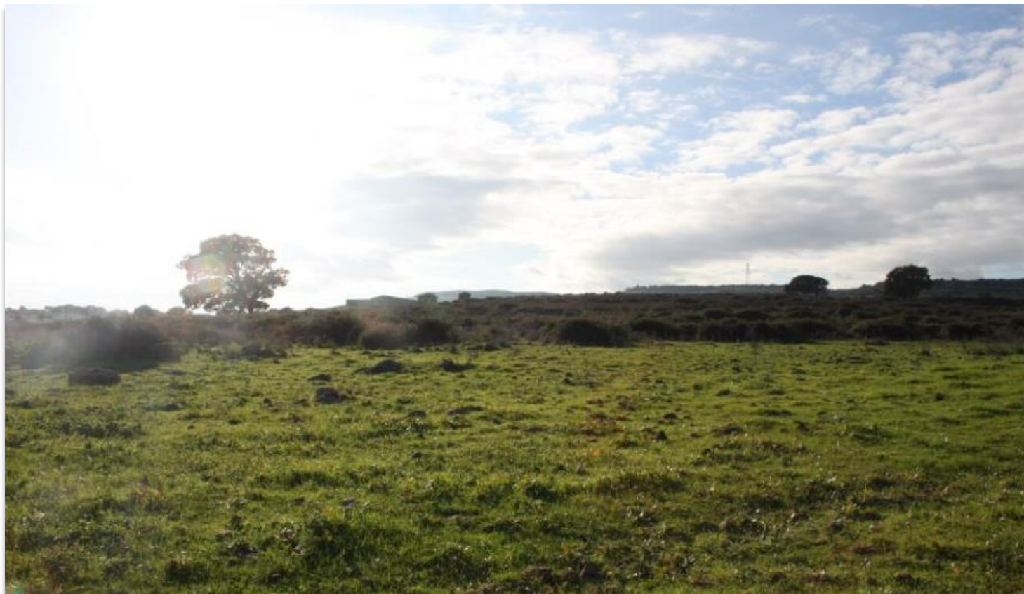
FIGURA 12: VISTA DEL LOTTO COLLOCATO A NORD.