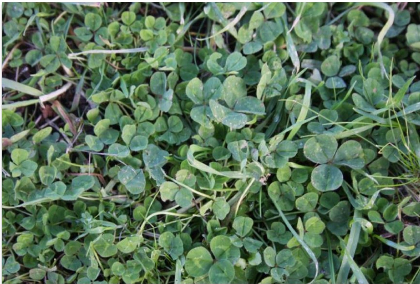
FIGURA 4: IL TRIFOGLIO, LEGUMINOSA GIÀ PRESENTE NELL'AREA DI PROGETTO.