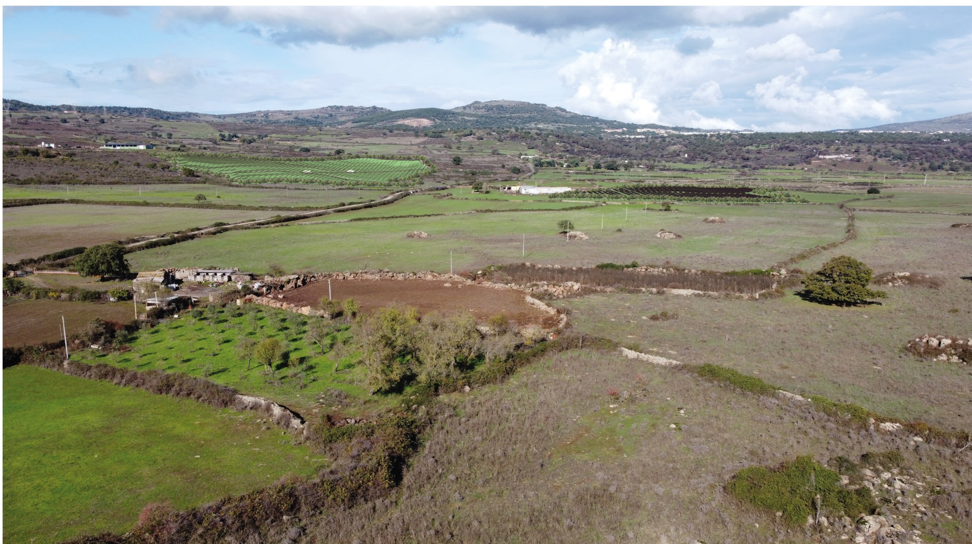
FOTOSIMULAZIONE PROSPETTICA DELL'IMPIANTO VISTA C