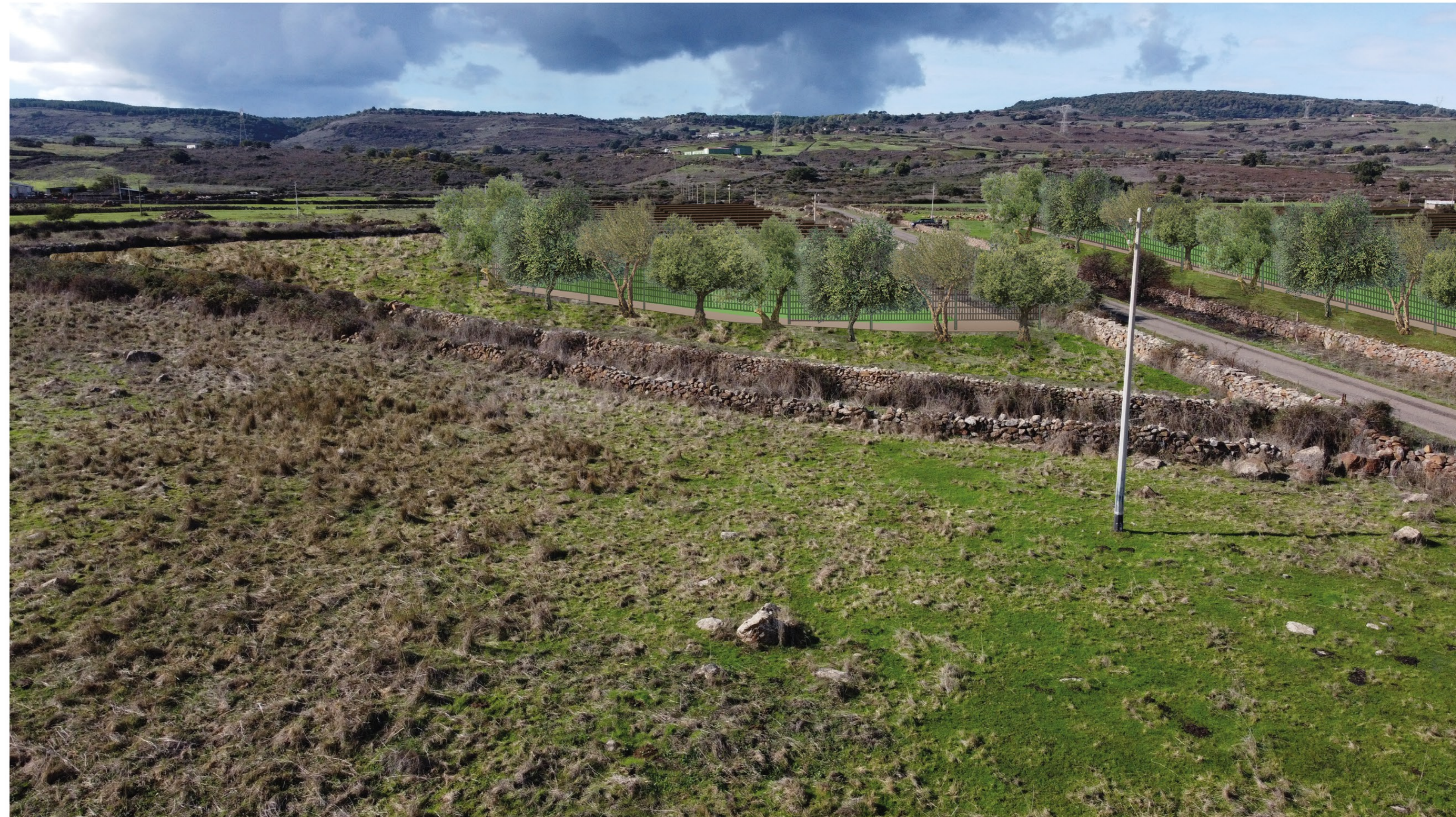
FOTOSIMULAZIONE DA STRADA DELL'IMPIANTO VISTA B