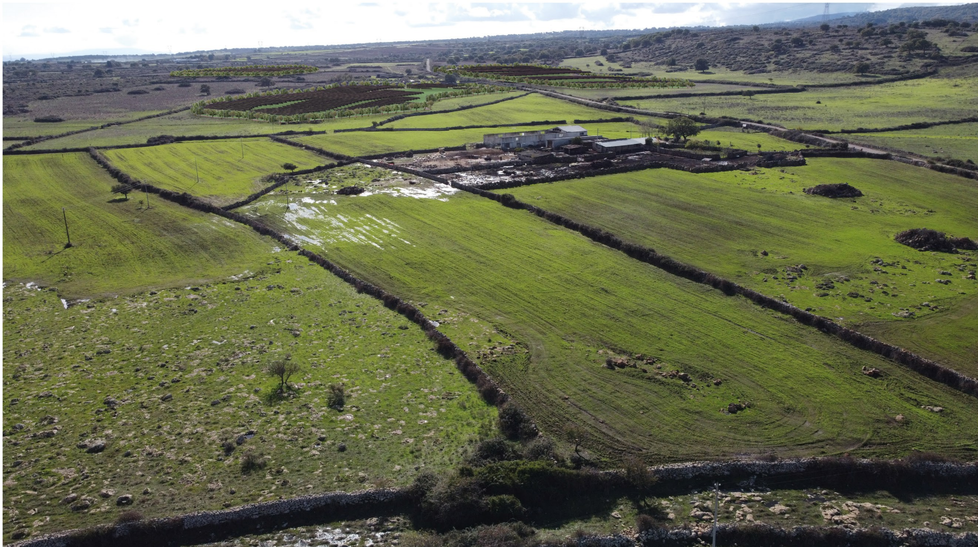
FOTOSIMULAZIONE PROSPETTICA DELL'IMPIANTO VISTA A