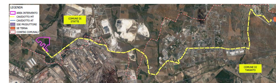
Figura 2-1: Inquadramento territoriale su Ortofoto del complesso del percorso del cavidotto di connessione MT (in giallo)

Le opere in progetto interessano i territori dei Comune di Statte e Taranto (TA) : l'impianto fotovoltaico e l'impianto di produzione di idrogeno interessano il territorio comunale di Statte, mentre le opere di connessione interesseranno in comune di Taranto. Il cavidotto di connessione MT avrà una lunghezza complessiva di circa 16,5 km, interesserà sia il territorio comunale di Statte che di Taranto, della Città Metropolitana di Taranto. Sarà realizzato in cavo interrato con tensione nominale di 30 kV, e collegherà l'impianto fotovoltaico con la stazione di utenza in prossimità della stazione di rete Terna 380/220/150kV denominata "Taranto N2".