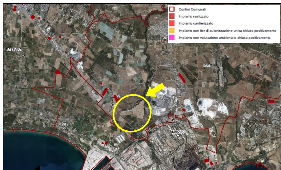
Figura 5-1: impianti fotovoltaici presenti nella zona di impianto

Dalla cartografia degli impianti FER predisposta dalla Regione Puglia non risultano censiti impianti eolici realizzati e cantierizzati nell'area vasta, né impianti eolici con iter di valutazione in corso.