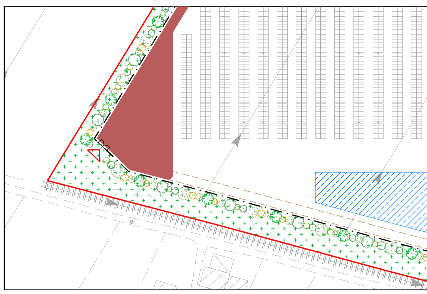
PARTICOLARE B SC. 1:1000