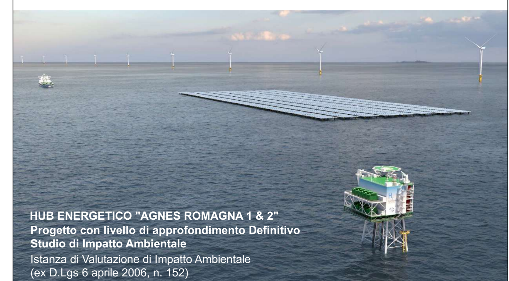
HUB ENERGETICO "AGNES ROMAGNA 1 & 2" Progetto con livello di approfondimento Definitivo Studio di Impatto Ambientale Istanza di Valutazione di Impatto Ambientale (ex D.Lgs 6 aprile 2006, n. 152)

Autore elaborato: ZGA Srl Codice identificativo ufficiale elaborato: AGNROM_EP-D_INQ-CARTA-IDROGEOM Codice identificativo interno elaborato: 21509482/20842 Titolo elaborato: INQUADRAMENTO DELLE OPERE TERRESTRI SU CARTA IDROGEOLOGICA