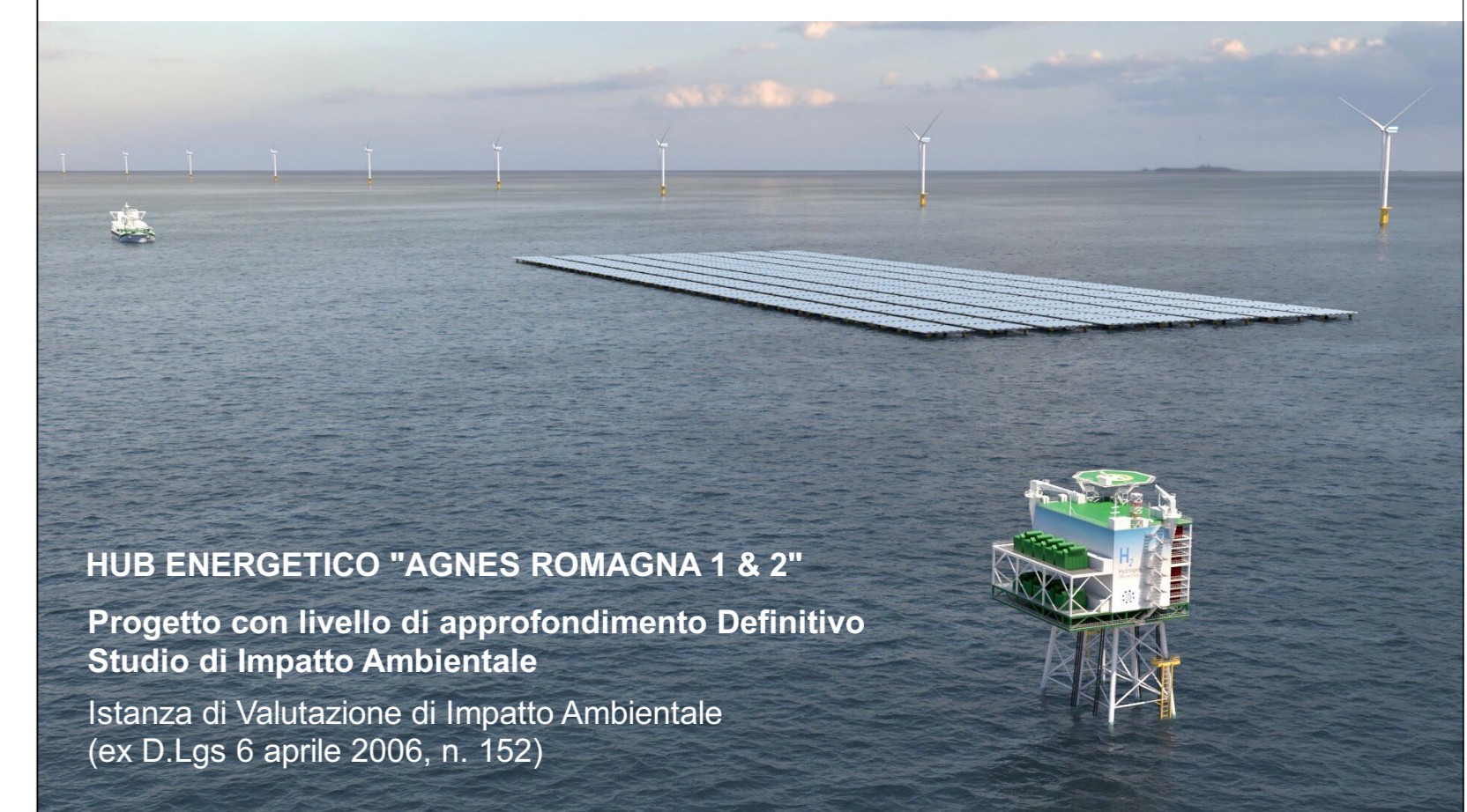
HUB ENERGETICO "AGNES ROMAGNA 1 & 2" Progetto con livello di approfondimento Definitivo Studio di Impatto Ambientale Istanza di Valutazione di Impatto Ambientale (ex D.Lgs 6 aprile 2006, n. 152)

Autore elaborato: AGNES Codice identificativo elaborato: AGNROM_EP-D_INQ-FTM-MARE/02 Titolo elaborato: FASCICOLO DI INQUADRAMENTI SULLE TAVOLE DELLO STUDIO "FRA LA TERRA E IL MARE"