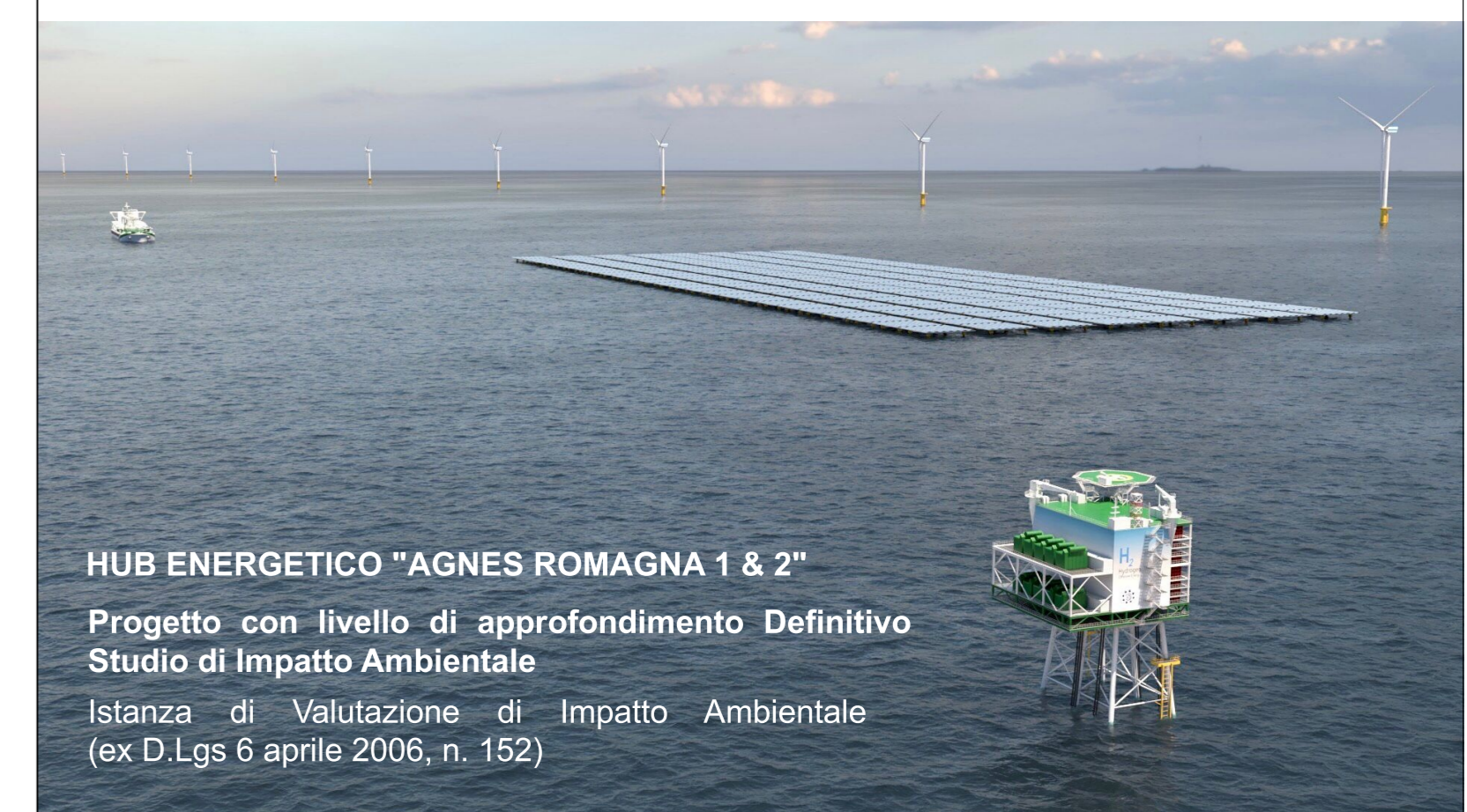
HUB ENERGETICO "AGNES ROMAGNA 1 & 2" Progetto con livello di approfondimento Definitivo Studio di Impatto Ambientale Istanza di Valutazione di Impatto Ambientale (ex D.Lgs 6 aprile 2006, n. 152)

Autore elaborato: UBICA Srl Codice identificativo elaborato: 21509482/20839