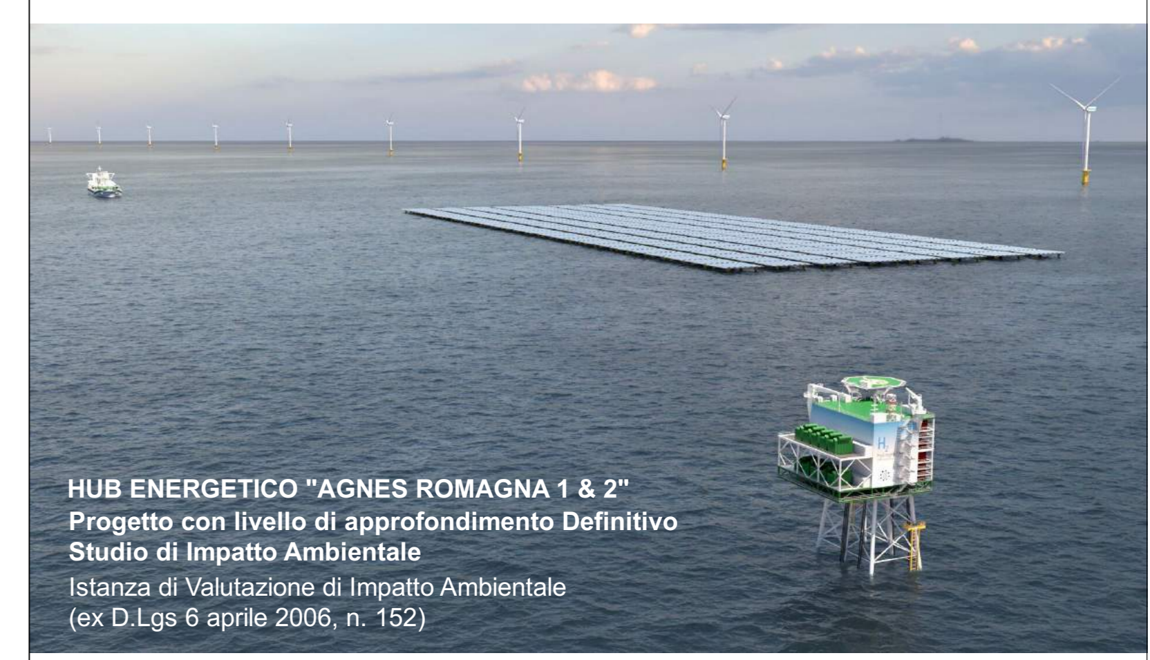
HUB ENERGETICO "AGNES ROMAGNA 1 & 2" Progetto con livello di approfondimento Definitivo Studio di Impatto Ambientale Istanza di Valutazione di Impatto Ambientale (ex D.Lgs 6 aprile 2006, n. 152)