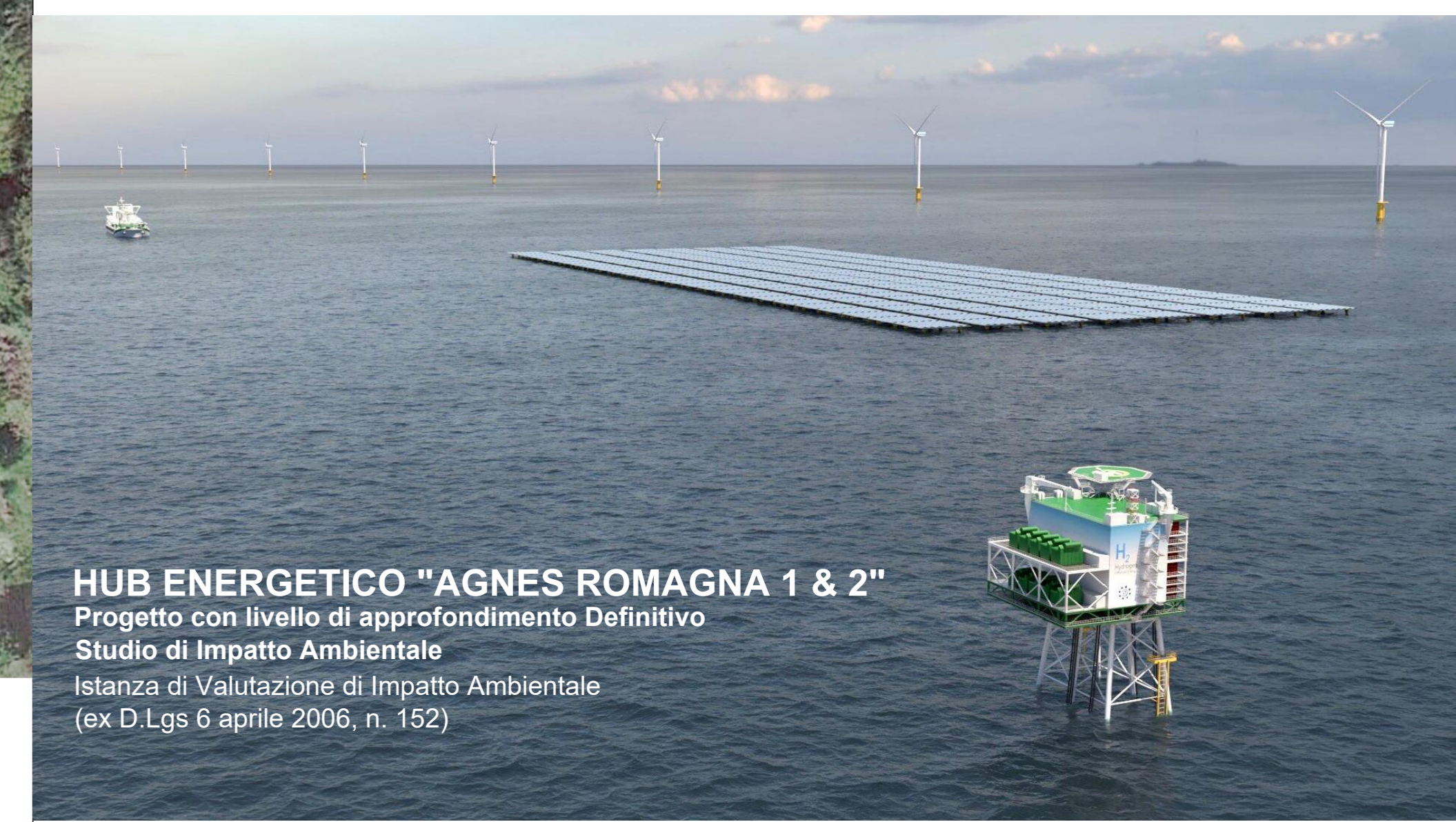
HUB ENERGETICO "AGNES ROMAGNA 1 & 2" Progetto con livello di approfondimento Definitivo Studio di Impatto Ambientale Istanza di Valutazione di Impatto Ambientale (ex D.Lgs 6 aprile 2006, n. 152)