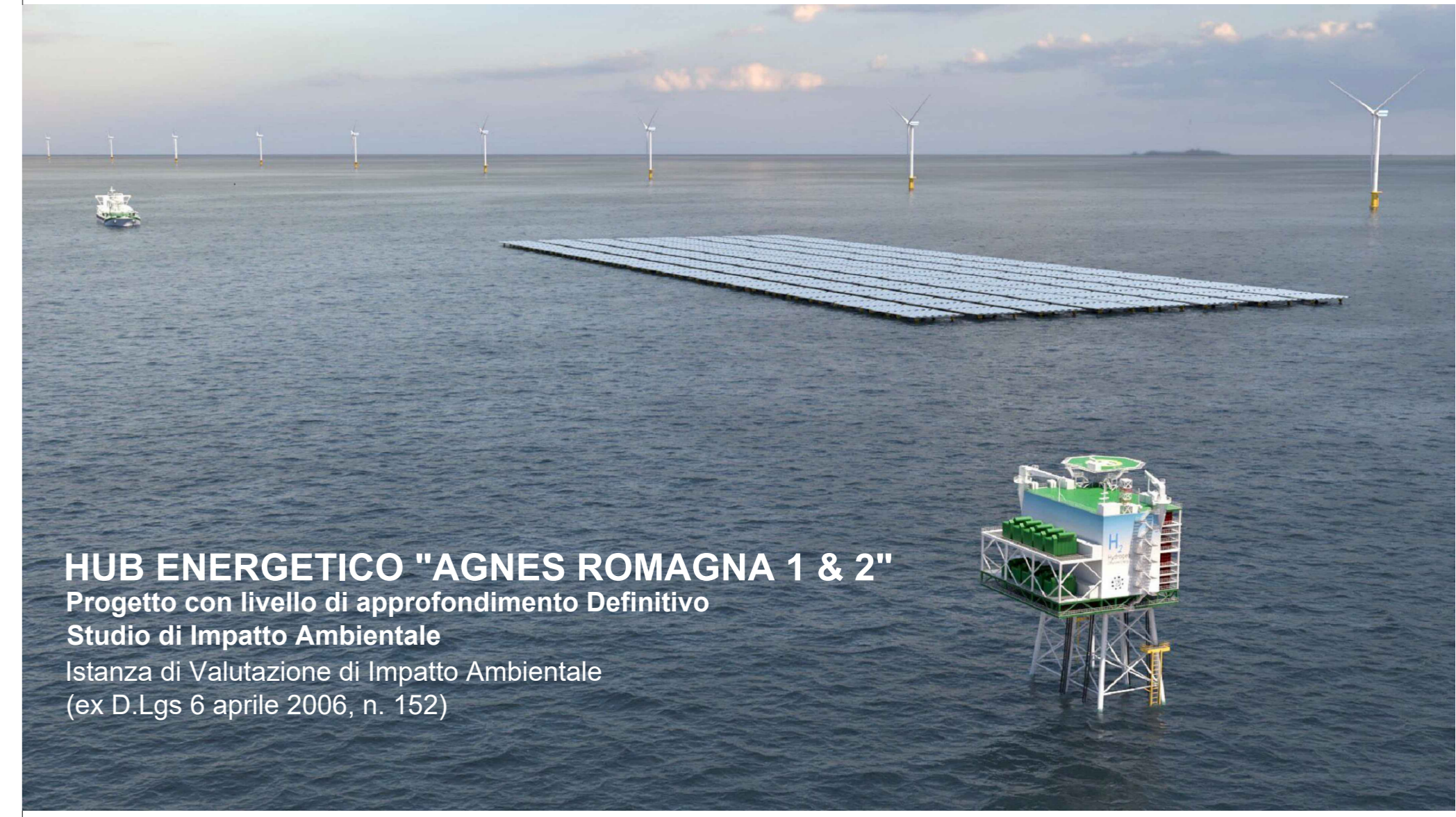
HUB ENERGETICO "AGNES ROMAGNA 1 & 2" Progetto con livello di approfondimento Definitivo Studio di Impatto Ambientale Istanza di Valutazione di Impatto Ambientale (ex D. Lgs 6 aprile 2006, n. 152)