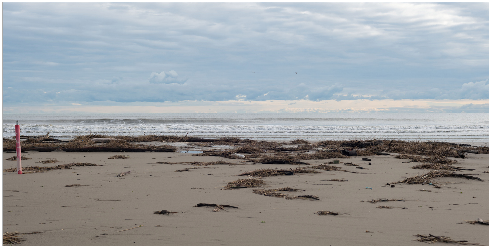
Comacchio ANTE OPERAM