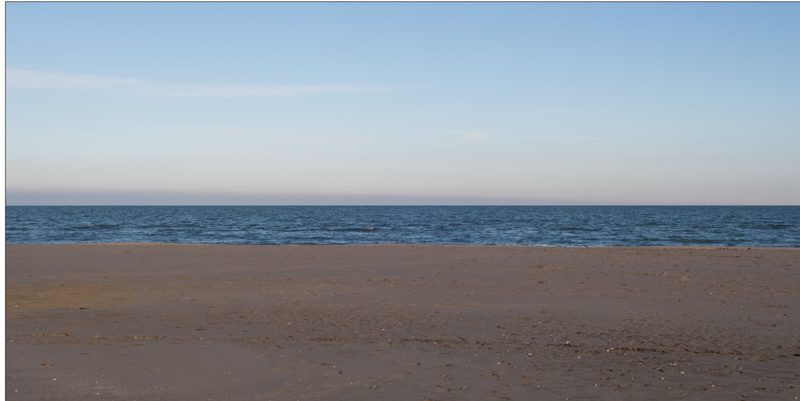
Cesenatico ANTE OPERAM