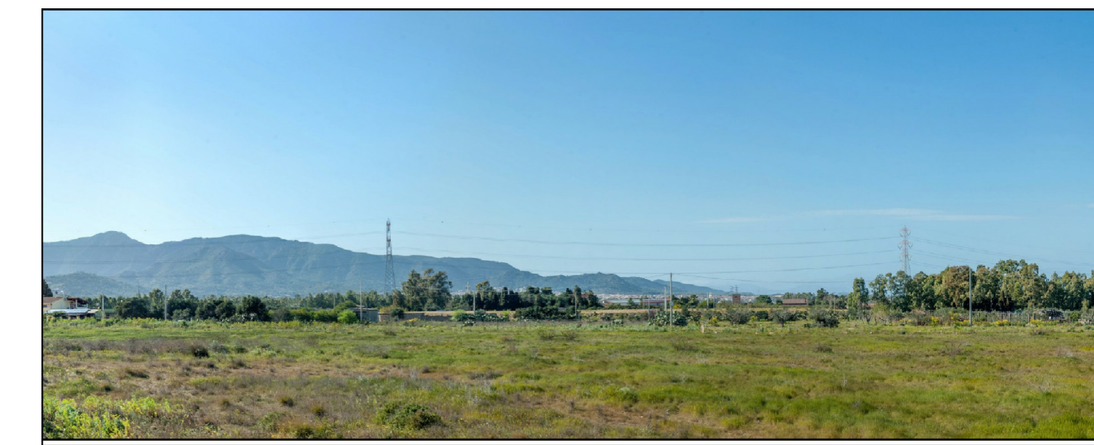
IMPIANTO FOTOVOLTAICO CAPOTERRA COMUNE DI CAPOTERRA

Essa è relativa all'uso del suolo, suddivisa in classi di legenda (Corine Land Cover), per i poligoni delle aree rappresentate; contiene anche strati tematici lineari della viabilità e idrografia. La legenda, organizzata gerarchicamente secondo la classificazione di dettaglio delle cinque categorie CORINE Land Cover fino a 5 livelli. Per la realizzazione e l'aggiornamento della carta dell'uso del suolo è stata basata sui seguenti materiali: immagini Ikonos 2005-06, CTRN10K, toponomastica, vari dati pubblicati su siti tematici istituzionali.