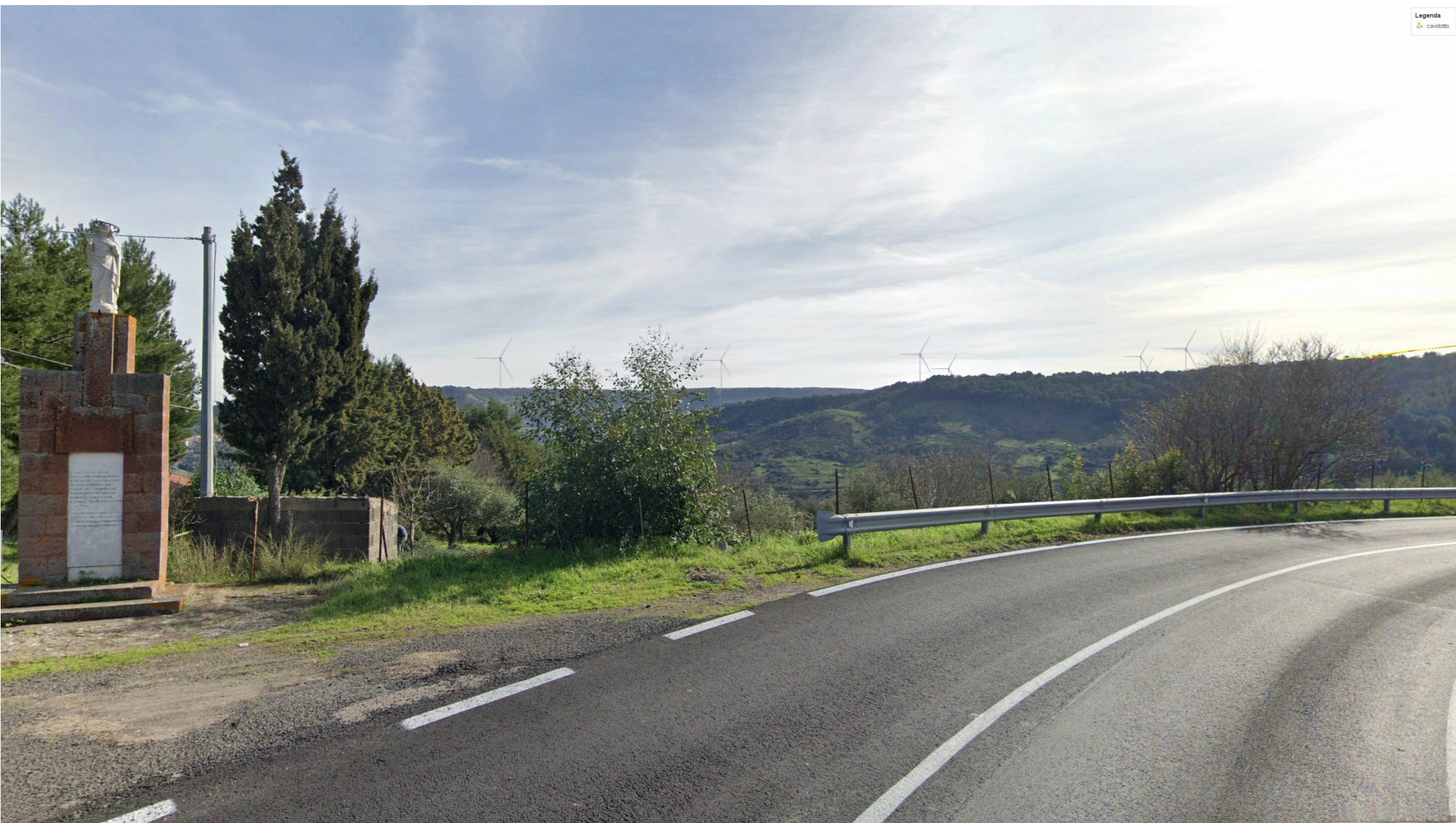
SIMULAZIONE DI PROGETTO