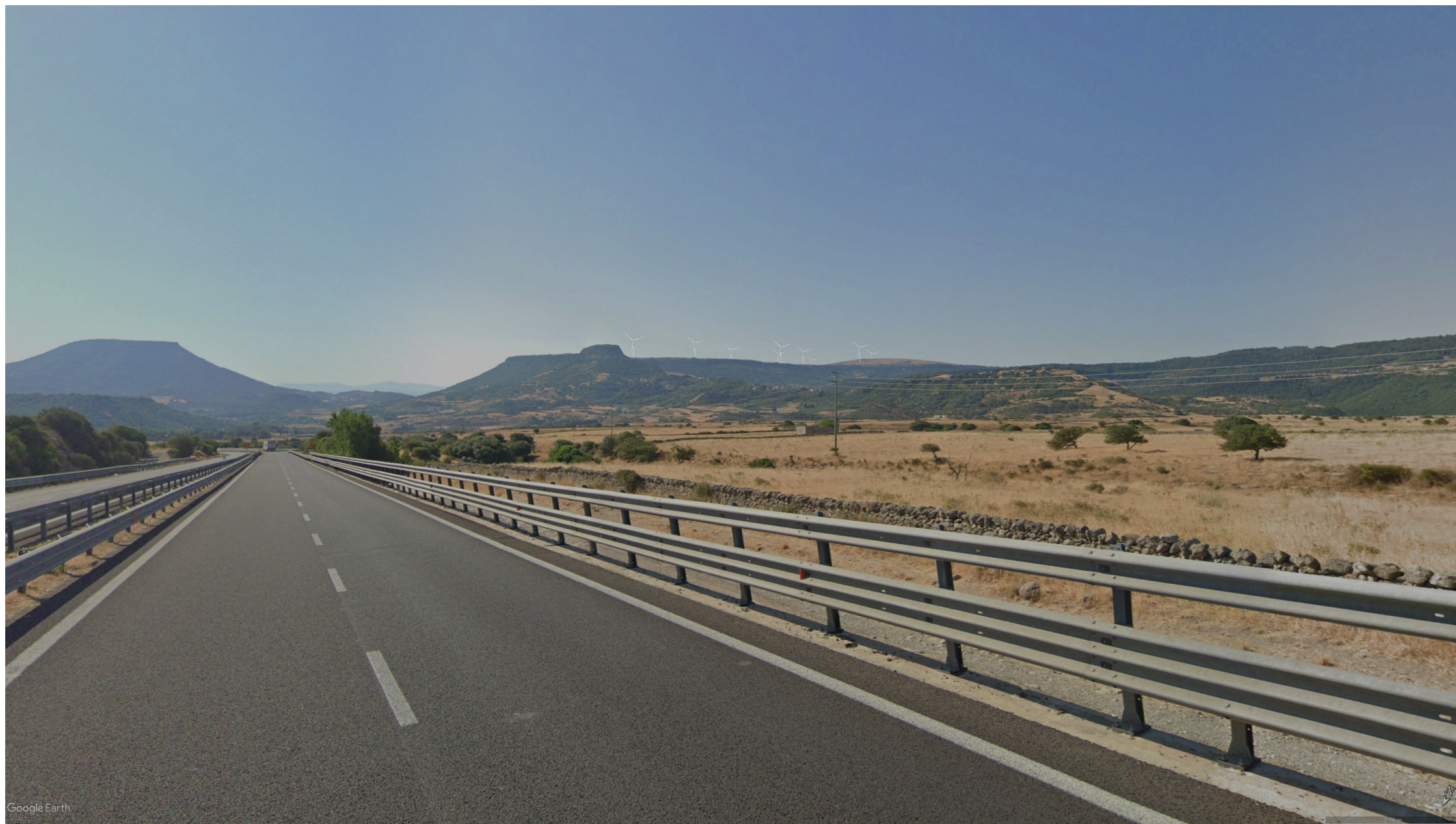
SIMULAZIONE DI PROGETTO