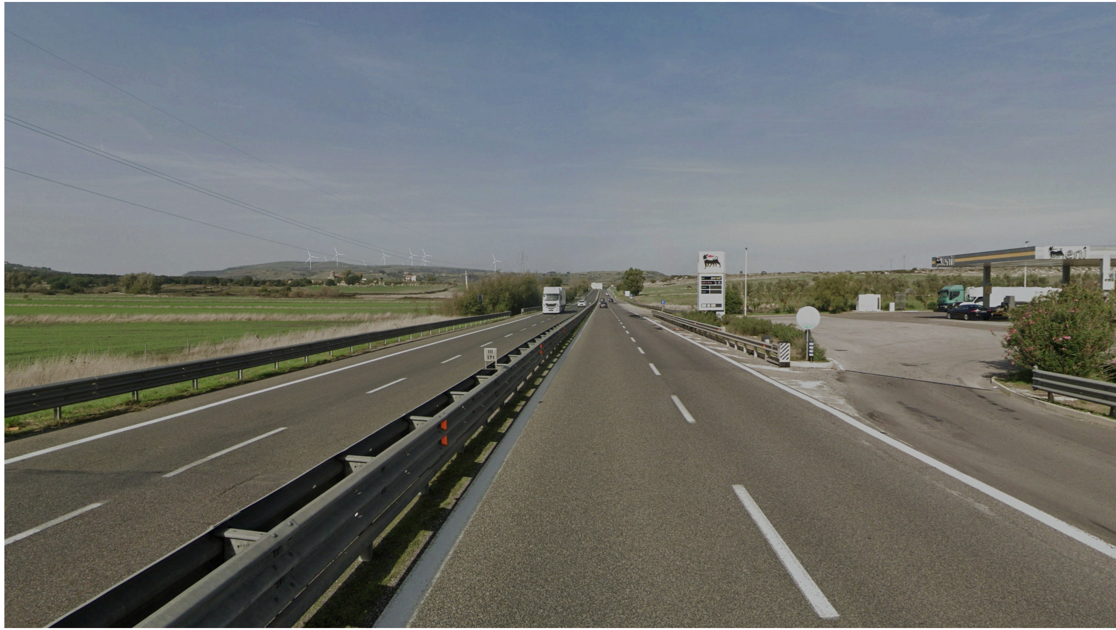
SIMULAZIONE DI PROGETTO