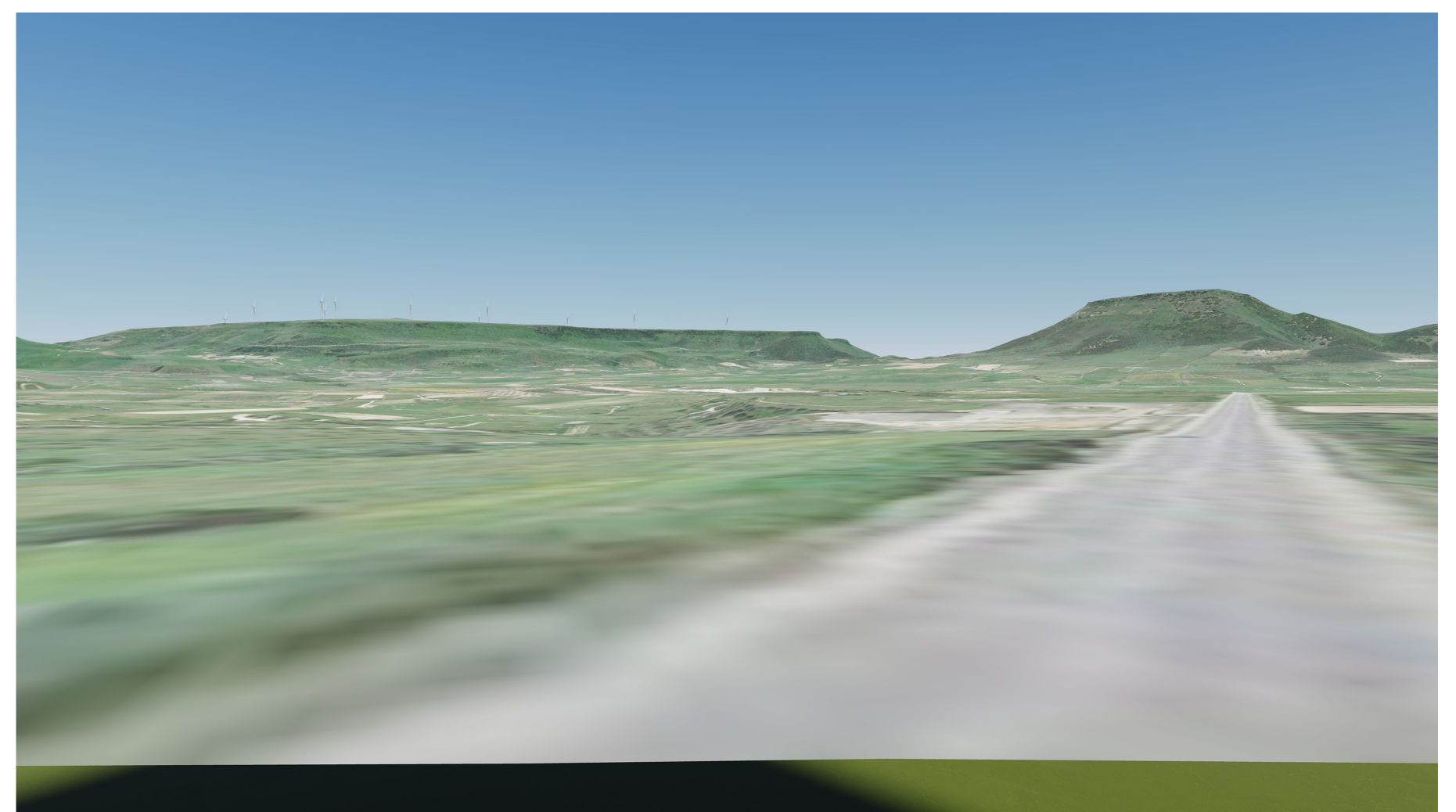
MODELLO DIGITALE TERRENO