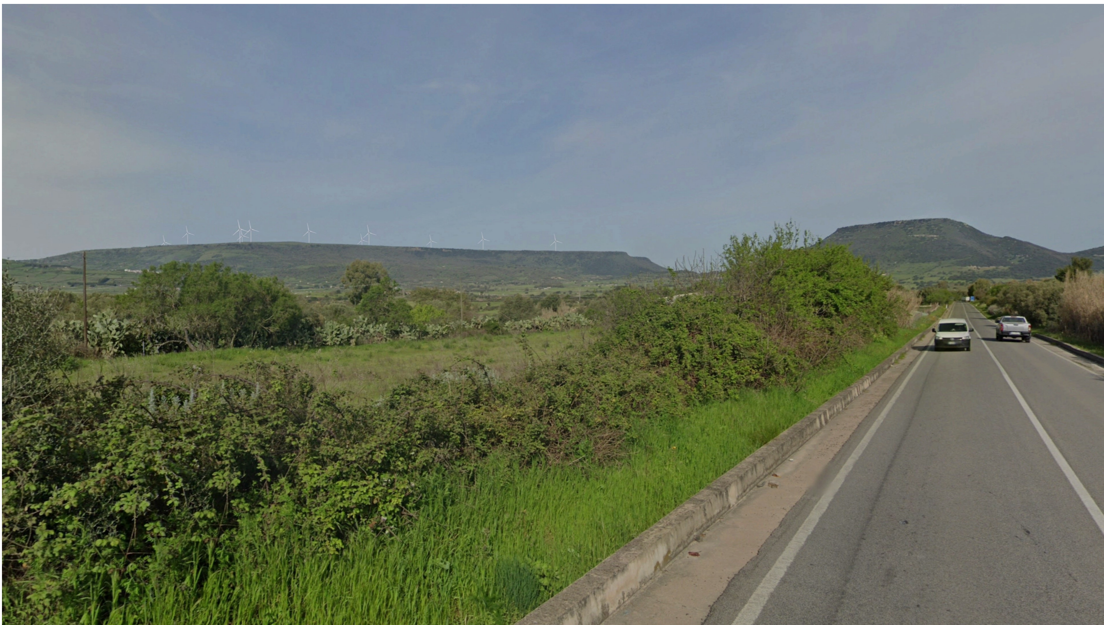
SIMULAZIONE DI PROGETTO