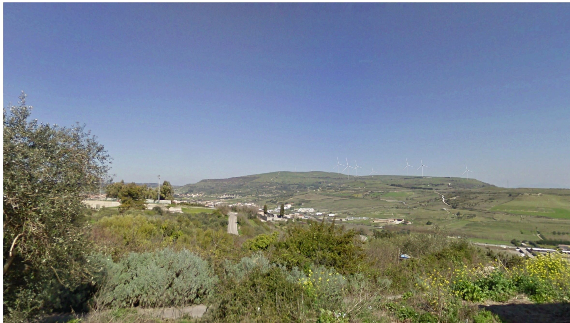
SIMULAZIONE DI PROGETTO