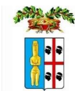
PROVINCIA SUD SARDEGNA