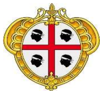
REGIONE AUTONOMA DELLA SARDEGNA