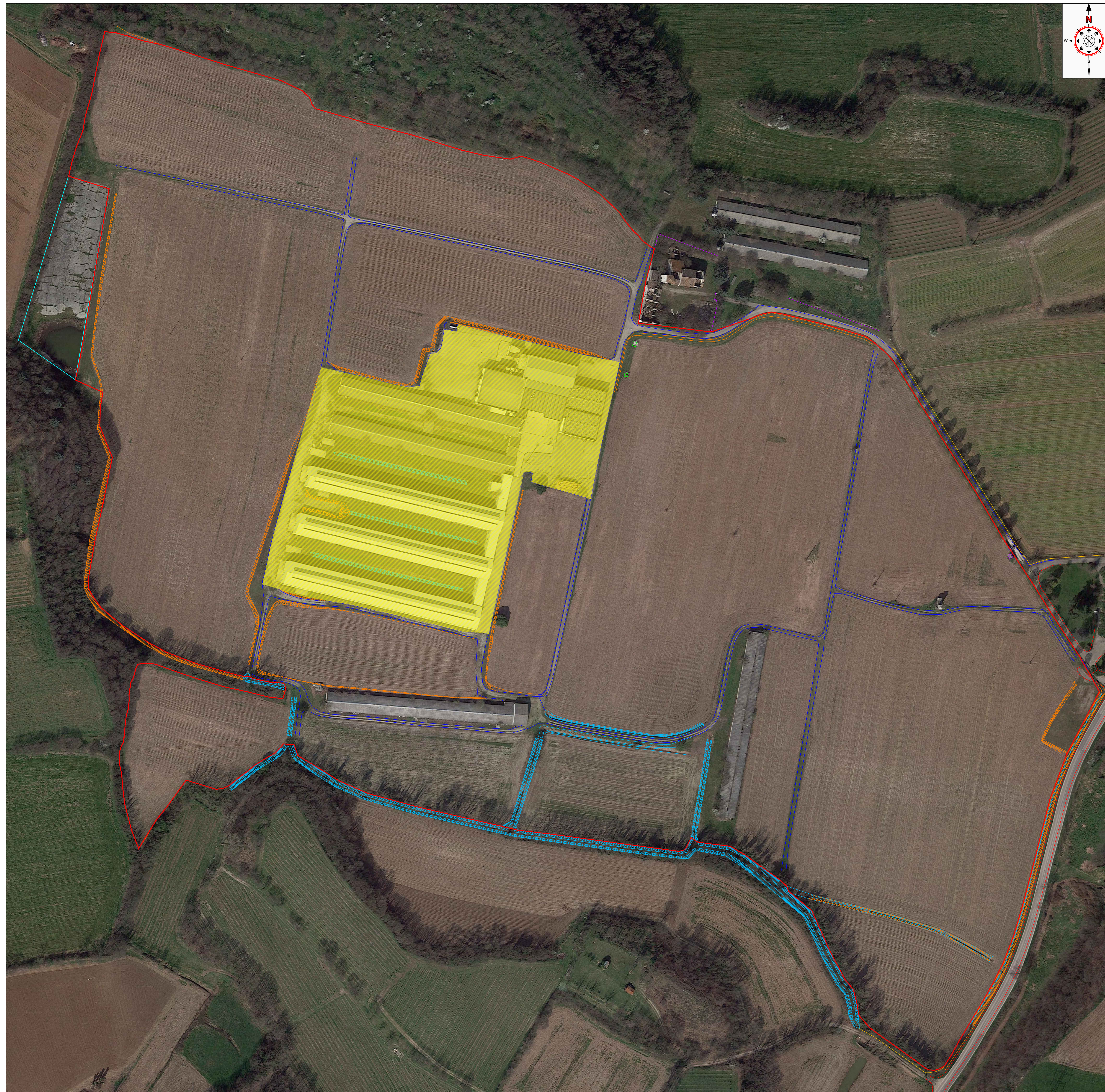
Piano Quotato su ortofoto Scala 1:1.000