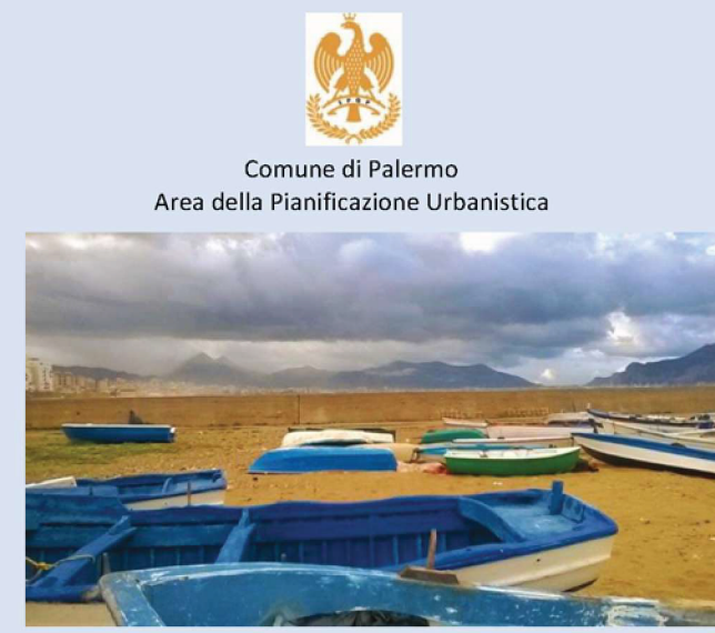
Riqualificazione del Porto Bandita e delle aree portuali

PROGETTO DI FATTIBILITA' TECNICO ECONOMICA Novembre 2022 COMPLETAMENTO / AMPLIAMENTO DEL PORTICCIOLA DELLA BANDITA