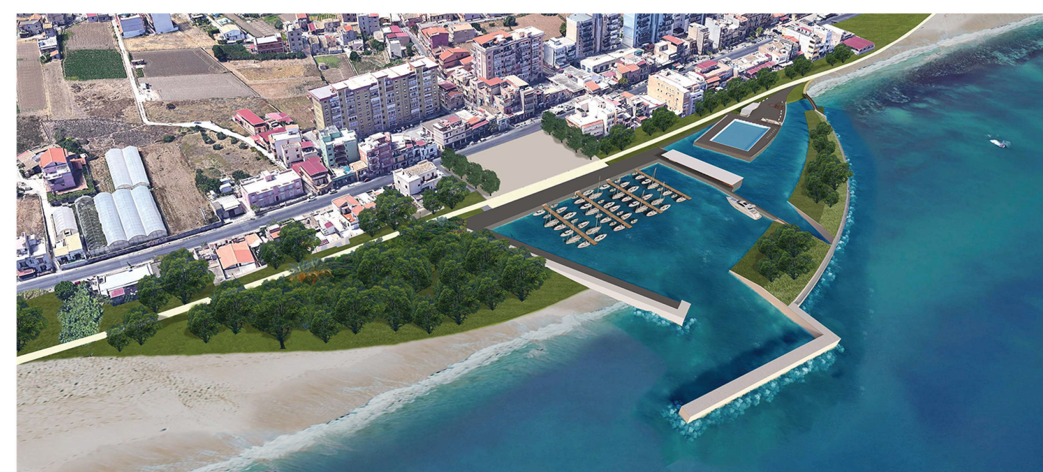
FOTOINSERIMENTO DI PROGETTO