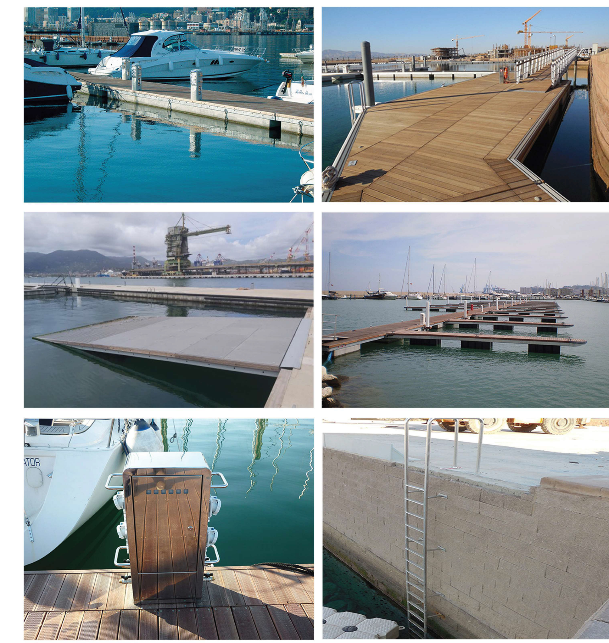
RIFERIMENTI TIPO PER ATTREZZATURE E SERVIZI PORTUALI