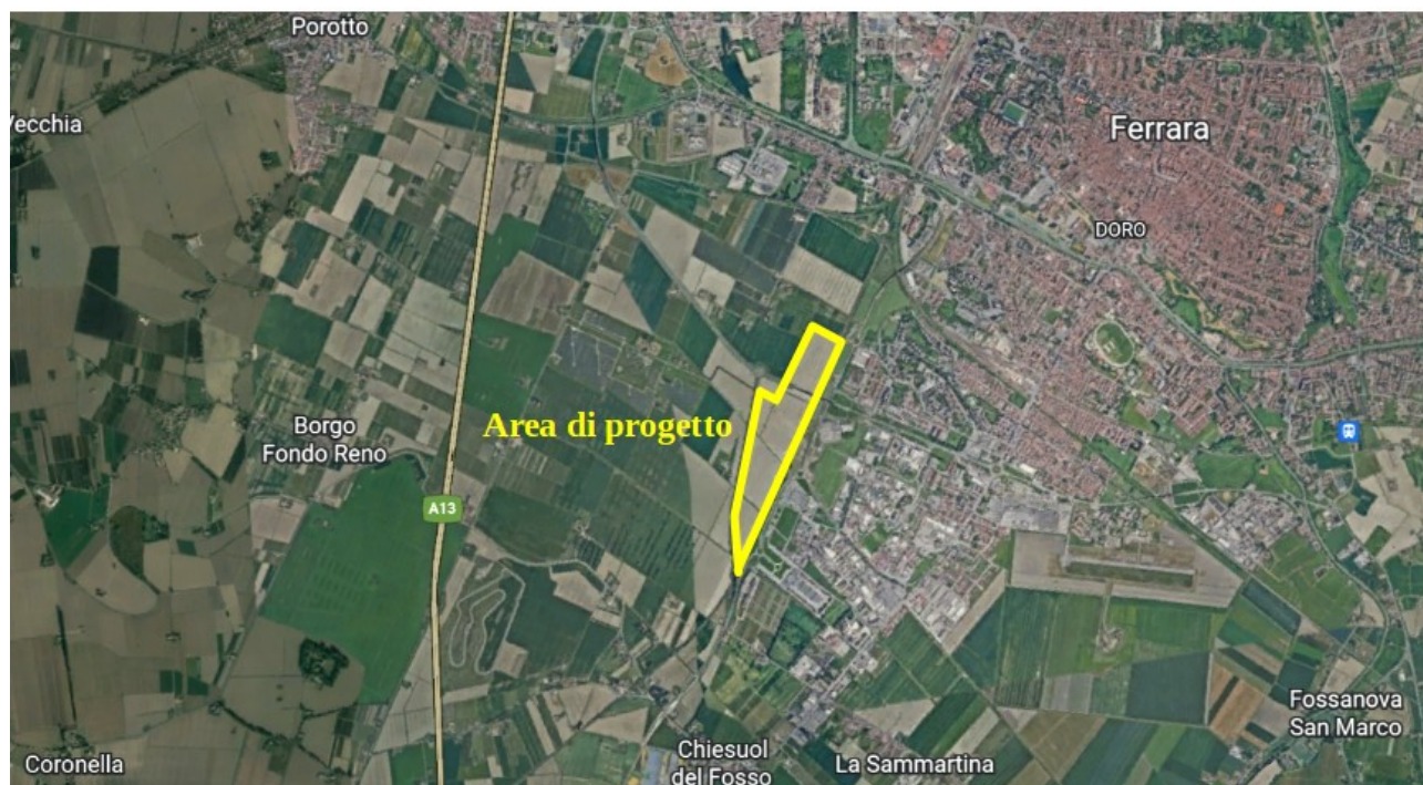
Figura 1: Localizzazione dell'area oggetto di intervento

L'impianto fotovoltaico si sviluppa su terreni agricoli per una superficie complessiva pari a circa 28,70 Ha, nell'immagine seguente si evidenzia l'area oggetto di intervento.