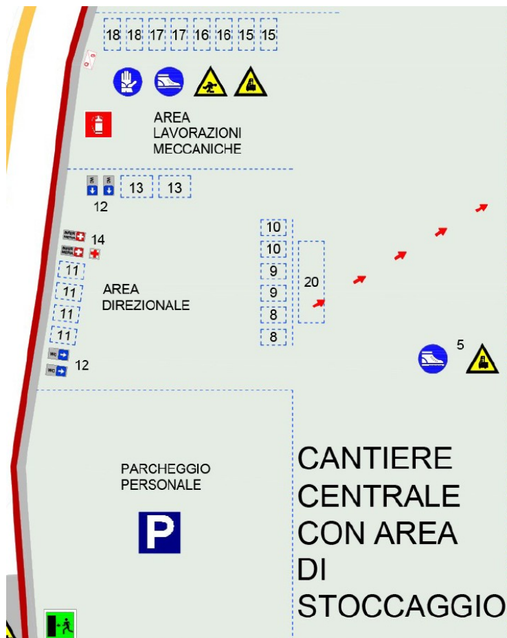
Figura 4: Area di cantiere

Prima di accedere al Cantiere 2 sarà necessario realizzare il ponte di collegamento tra i due poderi.