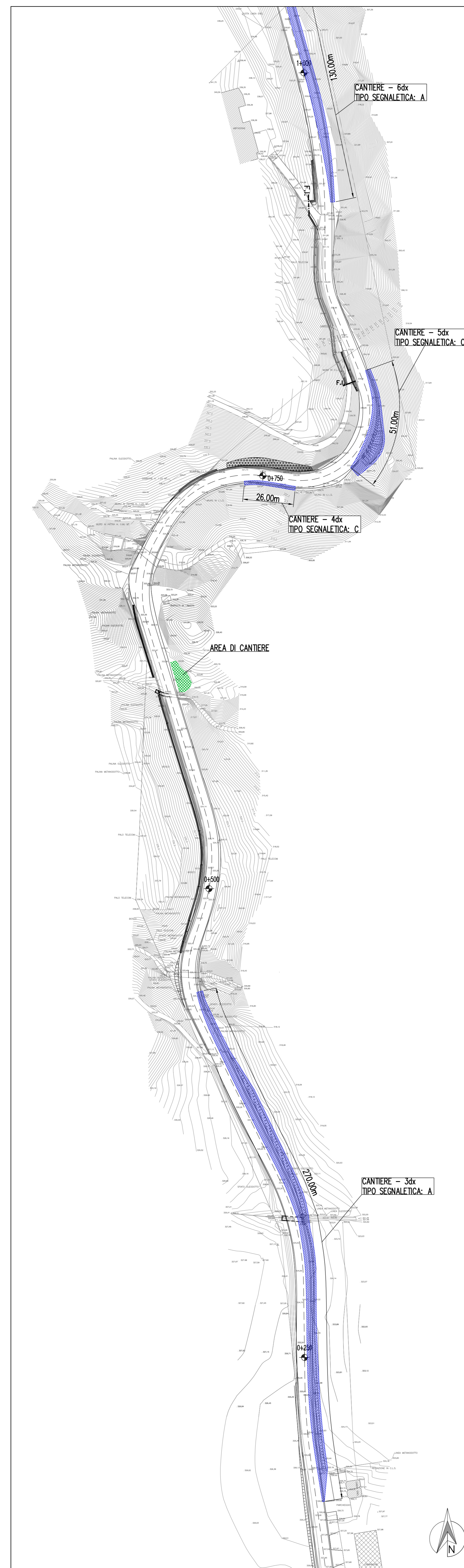
TRATTO 3 - FASE 2 - GESTIONE DEL TRAFFICO SCALA 1:1000