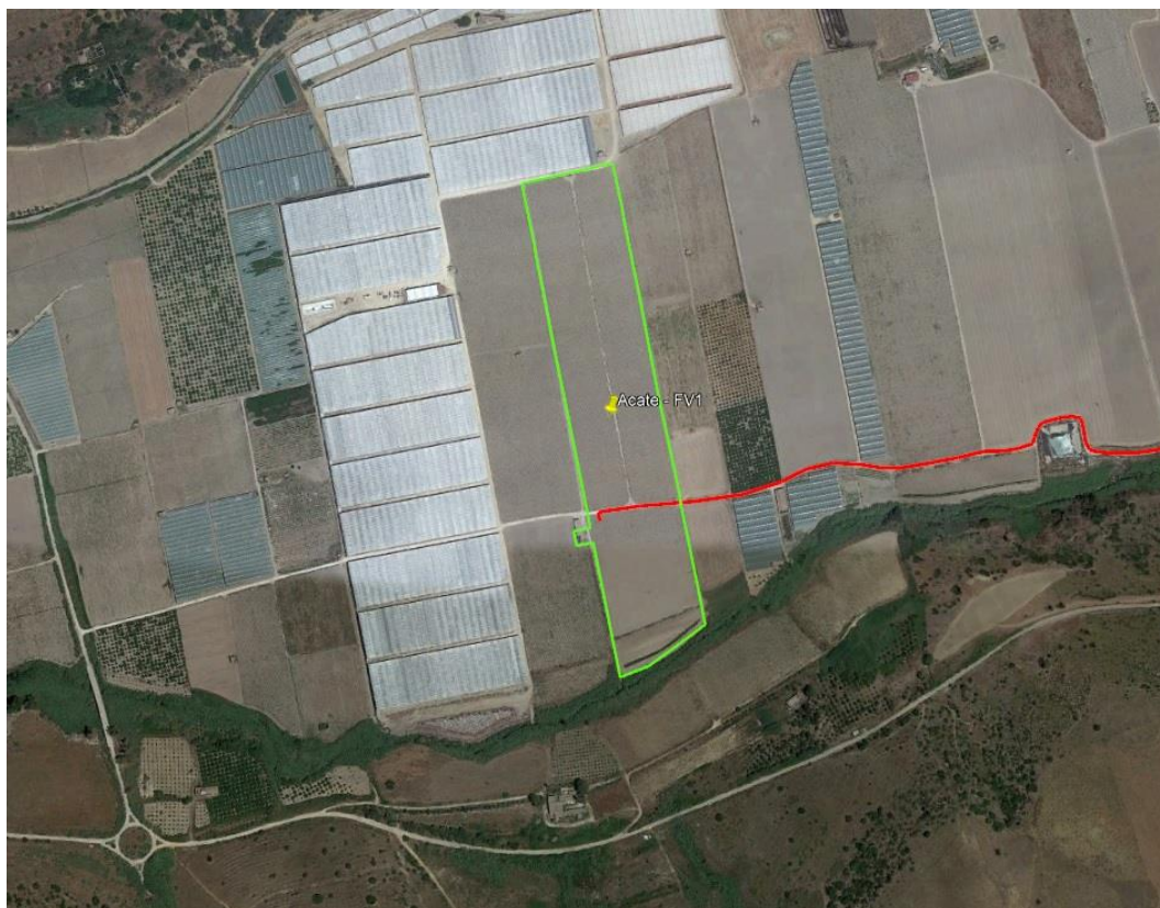
2. Vista satellitare ubicazione impianto FV 1