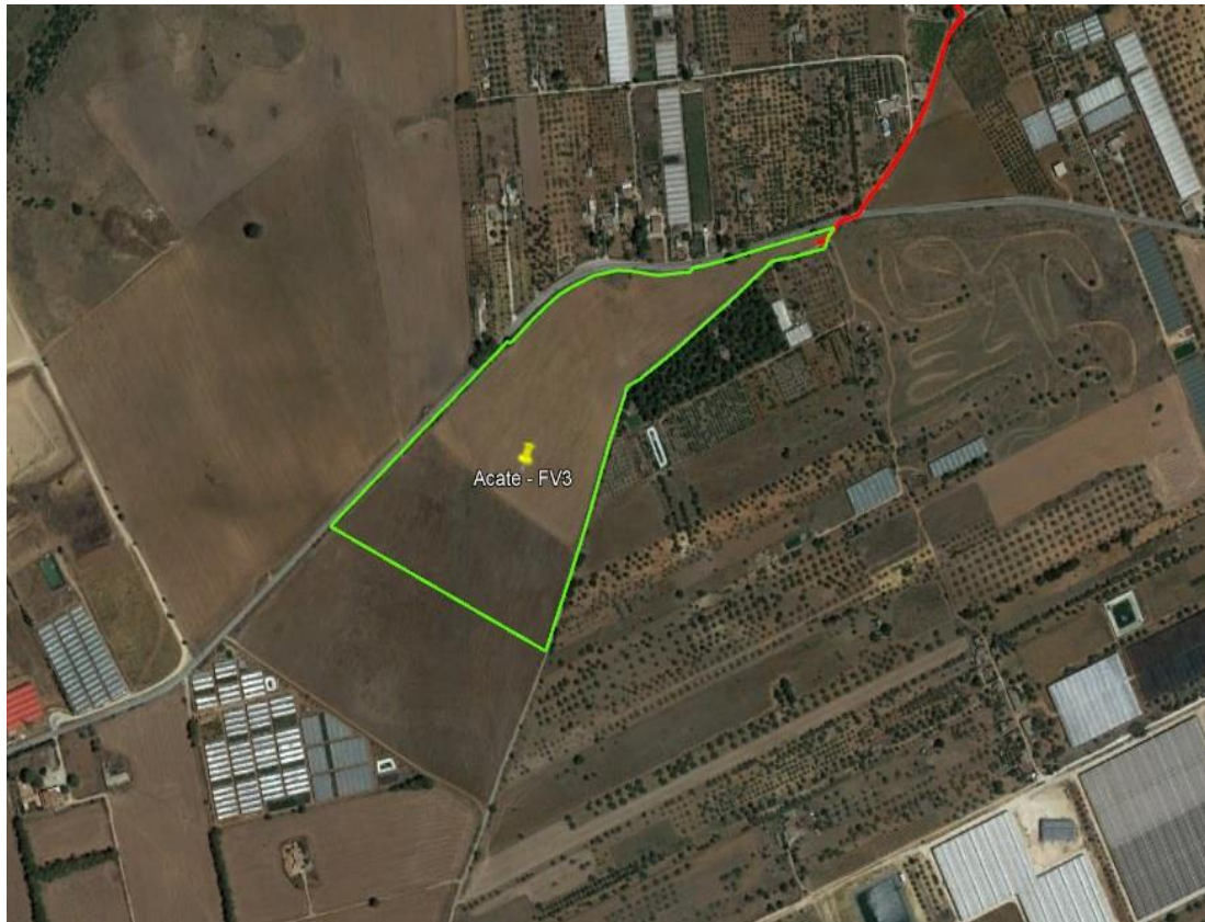
4. Vista satellitare ubicazione impianto FV 3