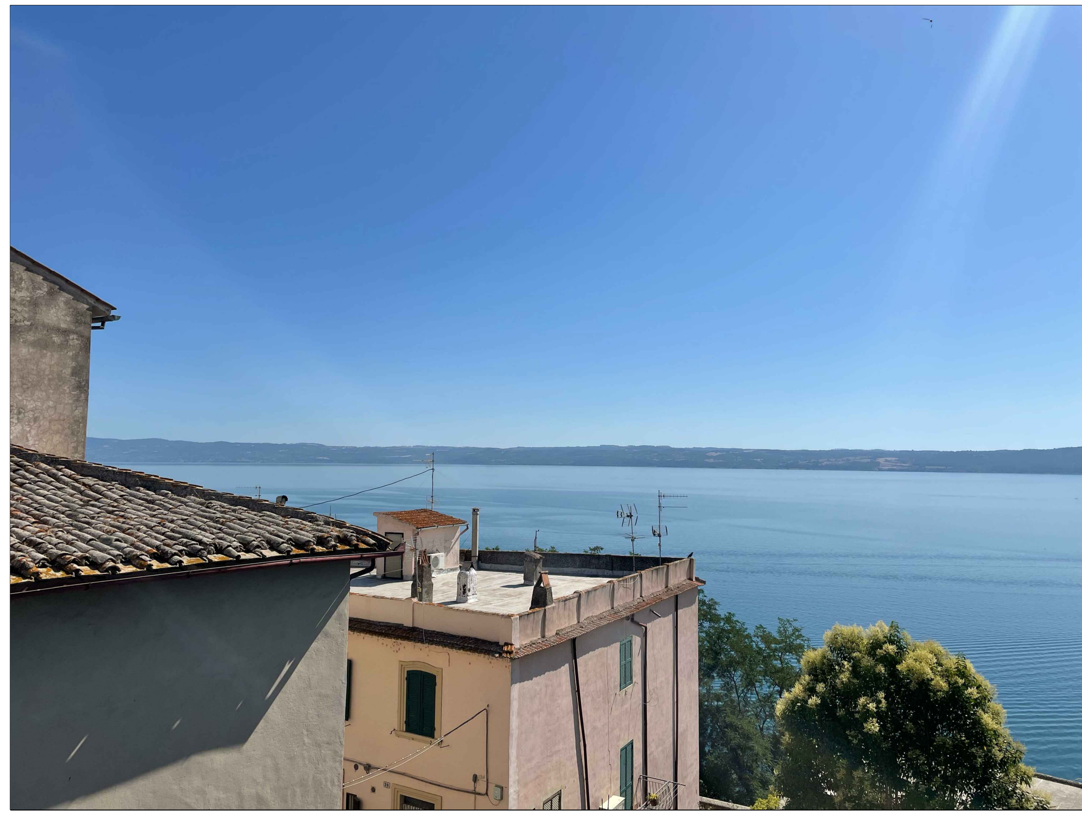
FOTINSERIMENTO 3 - STATO DI FATTO