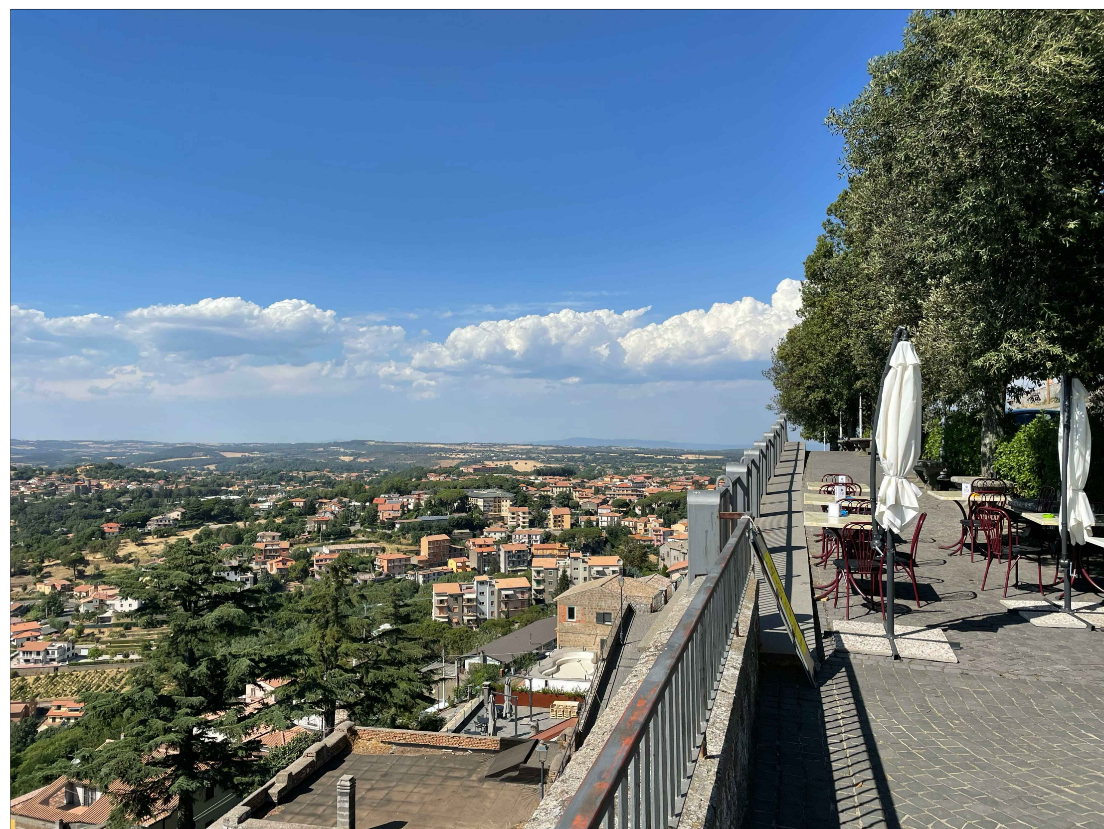
FOTINSERIMENTO 4 - STATO DI FATTO

NOTA: il numero del Fotoinserimento fa riferimento al Recettore individuato, nel navigatore sono stati riportati solo i recettori dai quali è stato sviluppato il Fotoinserimento. Per un elenco completo dei recettori selezionati si faccia riferimento allo Studio di Impatto Ambientale.